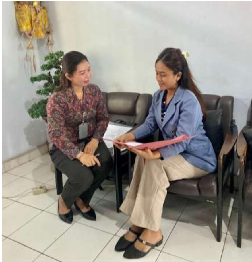
Lampiran 9. Wawancara bersama Pembimbing Kemasyarakatan dari Balai Pembinaan dan Pengawasan Masyarakat Kelas 1 Denpasar