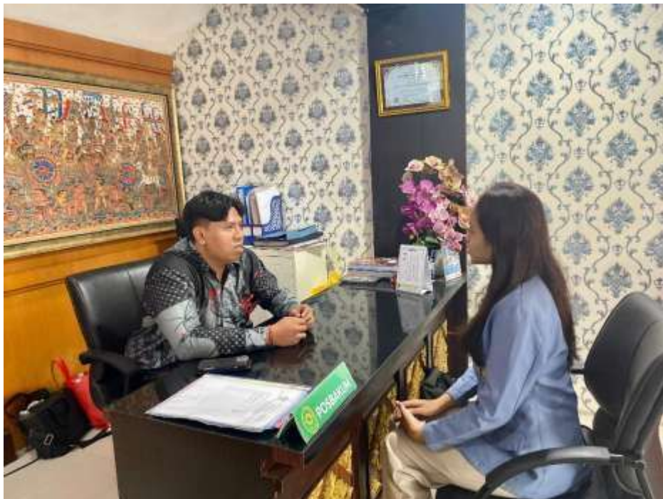
Lampiran 7. Wawancara bersama Advokat di Pengadilan Negeri Denpasar