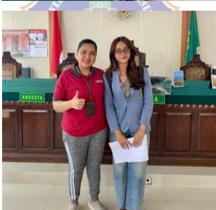
Lampiran 6. Wawancara bersama Ibu Hakim di Pengadilan Negeri Denpasar