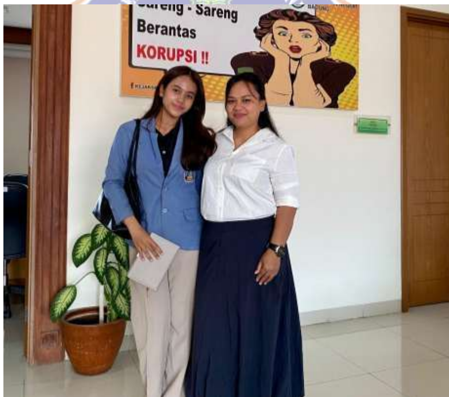
Lampiran 8. Wawancara bersama Jaksa Penuntut Umum di Kejaksaan Negeri Badung