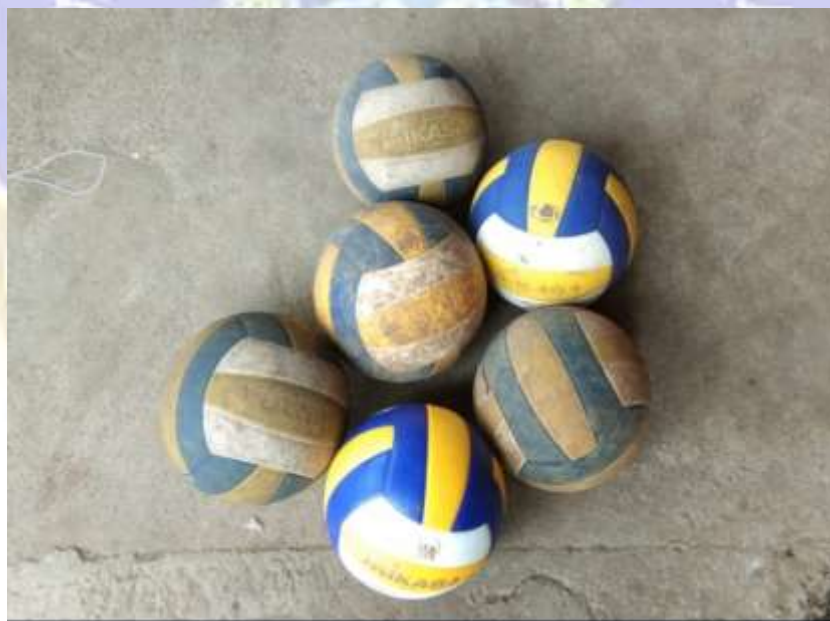
Gambar 6. Bola Voli