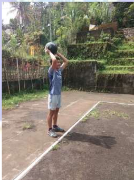
Gambar 4. Pelaksanaan Tes Overhead Medicine Ball Throw