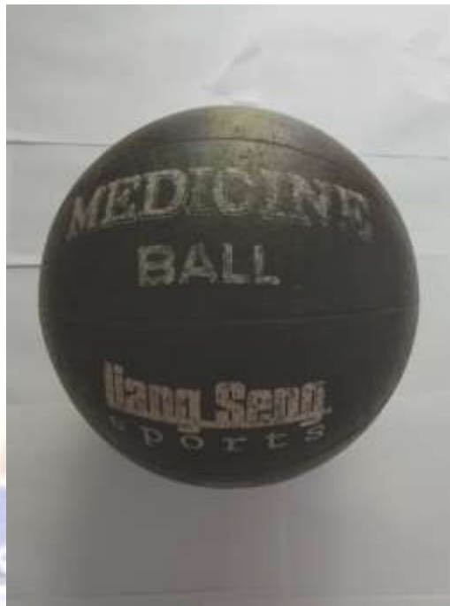
Gambar 7. Medicine Ball