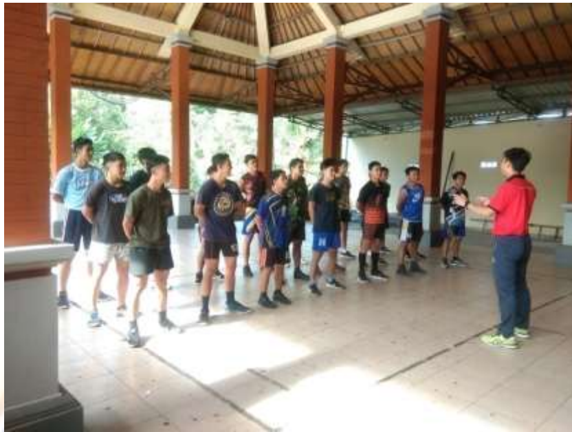
Gambar 1. Pengarahan sebelum Pelaksanaan Tes