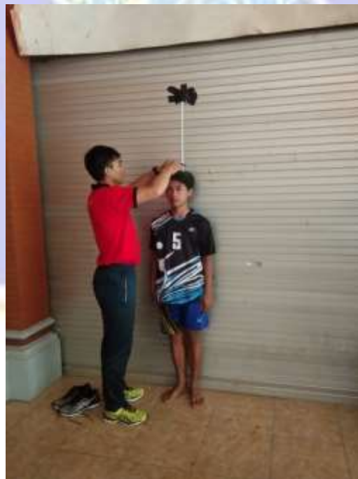
Gambar 2. Pelaksanaan Tes Tinggi Badan