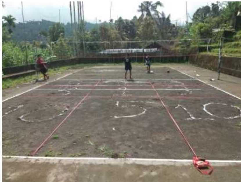
Gambar 5. Pelaksanaan Tes Keterampilan Smash