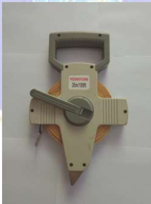
Gambar 8. Meteran