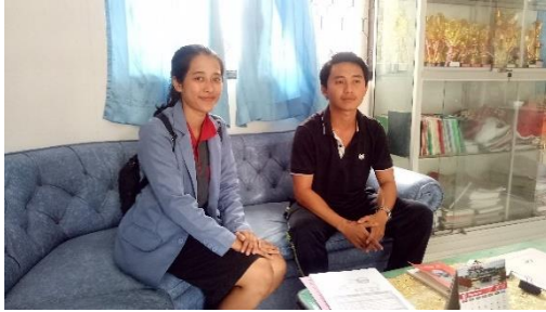
Gambar 7. Kegiatan wawancara di SD Negeri 2 Pulukan