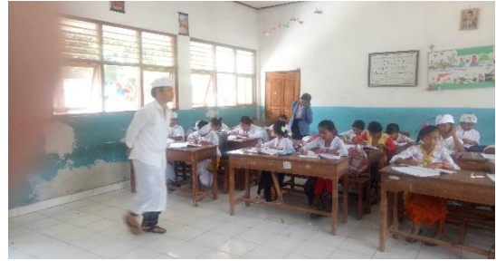
Gambar 8. Kegiatan observasi dalam pembelajaran IPA di kelas IV SD Negeri 2 Pulukan