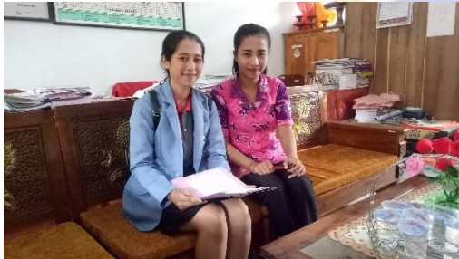
Gambar 3. Kegiatan wawancara di SD Negeri 3 Medewi