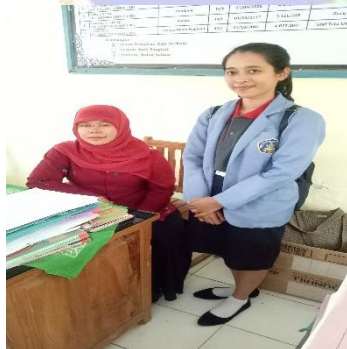
Gambar 5. Kegiatan wawancara di SD Negeri 1 Pulukan