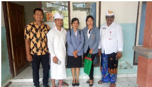
Gambar 9. Kegiatan wawancara di SD Negeri 3 Pulukan