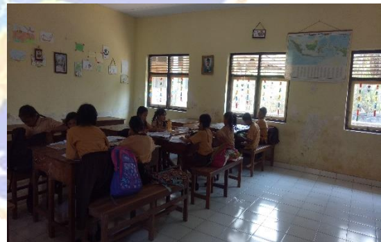
Gambar 6. Kegiatan observasi dalam pembelajaran IPA di kelas IV SD Negeri 1 Pulukan