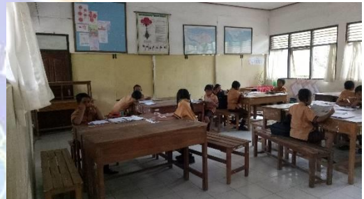
Gambar 4. Kegiatan observasi dalam pembelajaran IPA di kelas IV SD Negeri 3 Medewi