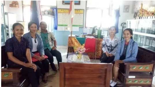
Gambar 1. Kegiatan wawancara di SD Negeri 2 Medewi