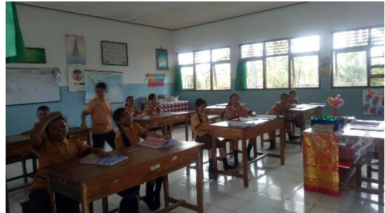
Gambar 2. Kegiatan observasi dalam pembelajaran IPA di kelas IV SD Negeri 2 Medewi