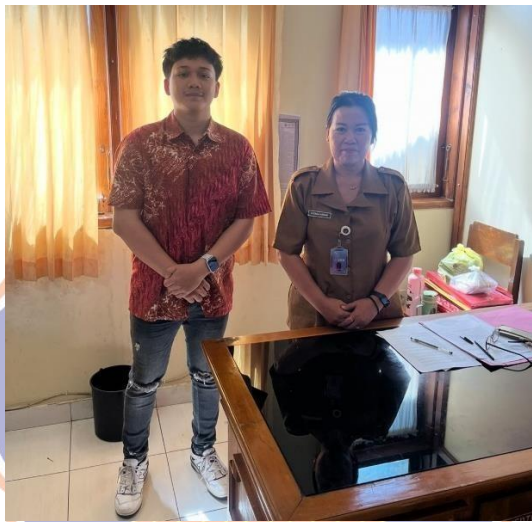
FOTO WAWANCARA DENGAN NARASUMBER 2