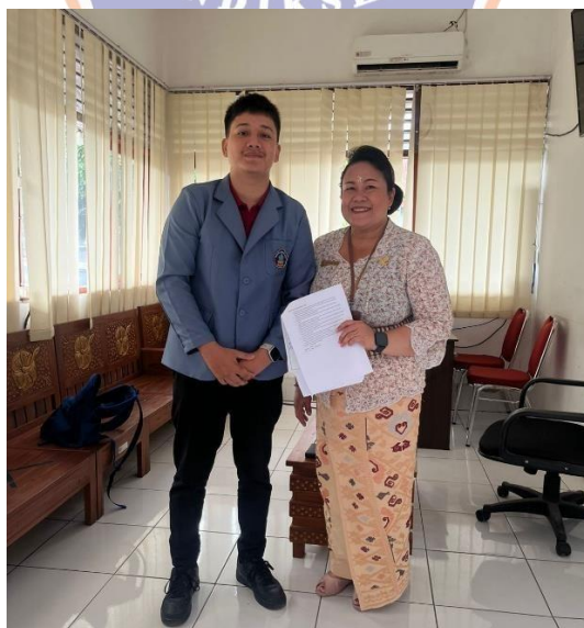
FOTO WAWANCARA DENGAN NARASUMBER 3