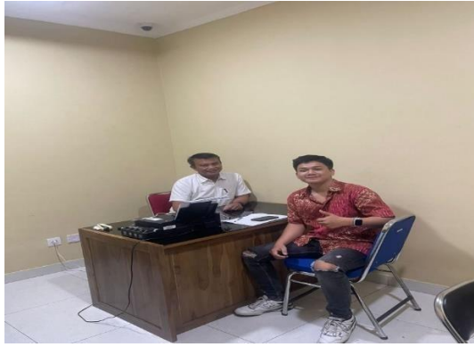
FOTO WAWANCARA DENGAN NARASUMBER 1