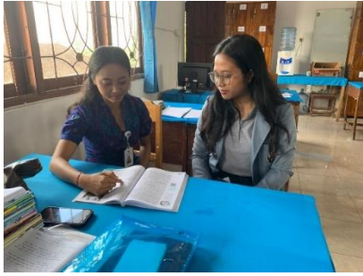
Gambar 13. Wawancara dengan Ibu