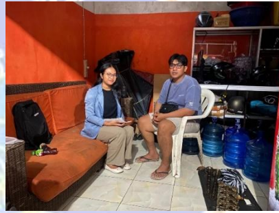
Gambar 3. Wawancara dengan Bapak