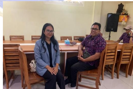
Gambar 5. Wawancara dengan Bapak