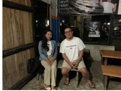
Gambar 1. Wawancara dengan Bapak