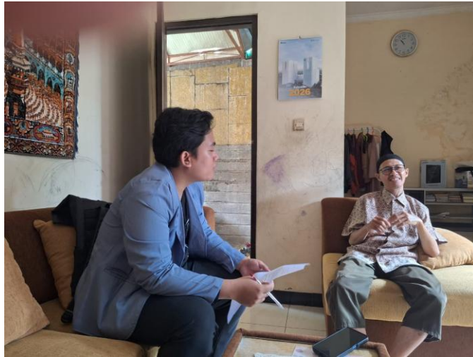
Gambar 7. Wawancara Bersama Bendahara Kelompok Fardu Kifayah Al-Mujahidin 2025-2029