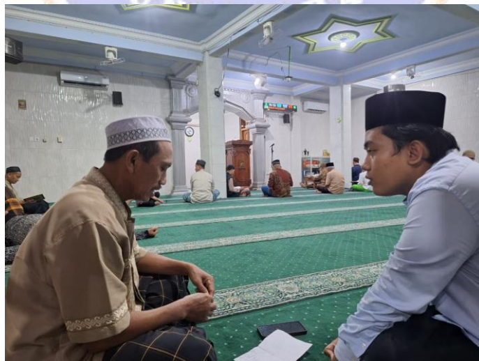
Gambar 6. Wawancara Bersama Anggota Kelompok Fardu Kifayah Al-Mujahidin