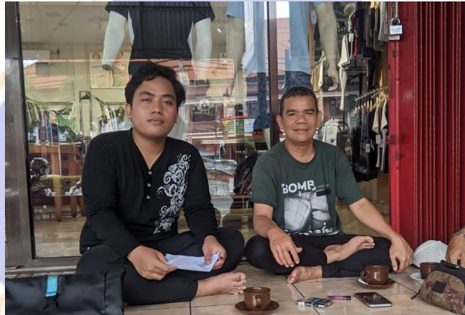
Gambar 11. Wawancara Bersama Ketua Kelompok Fardu Kifayah Al-Mujahidin 2020-2024