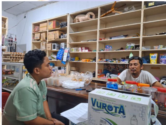
Gambar 14. Wawancara Bersama Bendahara Kelompok Fardu Kifayah Al-Mujahidin 2020-2024