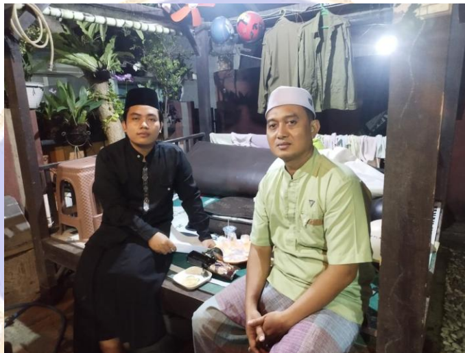
Gambar 5. Wawancara Bersama Wakil Ketua Kelompok Fardu Kifayah Al-Mujahidin 2025-2029