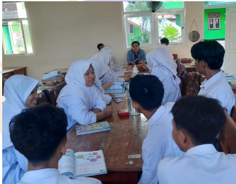
Gambar 17. Focus Group Discussion Bersama Siswa Kelas 11 SMAS Muhammadiyah 2 Singaraja