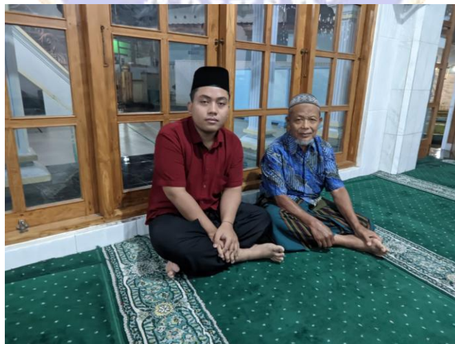
Gambar 9. Wawancara Bersama Pemandi Jenazah Fardu Kifayah Al-Mujahidin