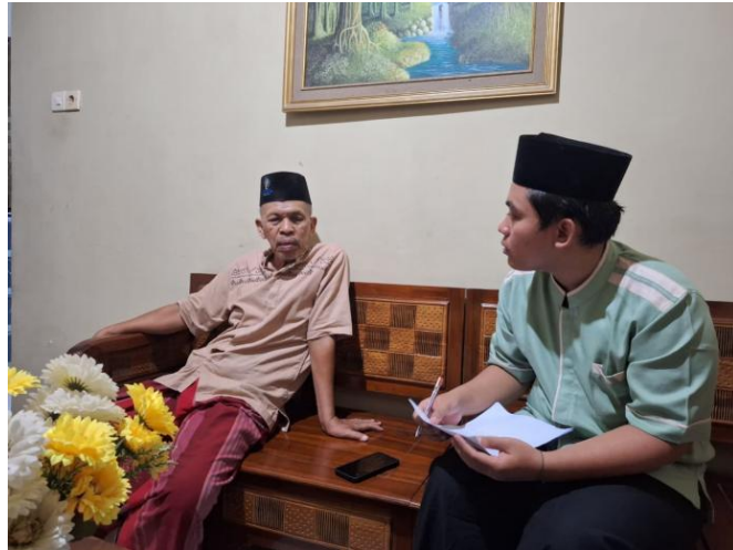
Gambar 4. Wawancara Bersama Pendiri Yayasan Al-Mujahidin