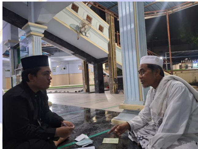
Gambar 8. Wawancara Bersama Ketua Kelompok Fardu Kifayah Al-Mujahidin 2010-2019