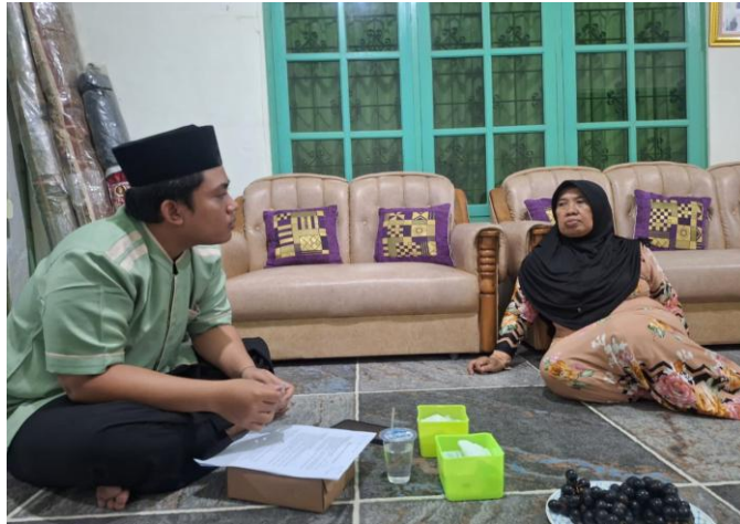
Gambar 13. Wawancara Bersama Pemandi Jenazah Perempuan Fardu Kifayah Al-Mujahidin