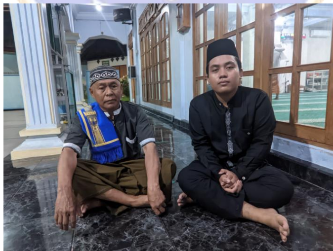
Gambar 12. Wawancara Bersama Anggota Kelompok Fardu Kifayah Al-Mujahidin