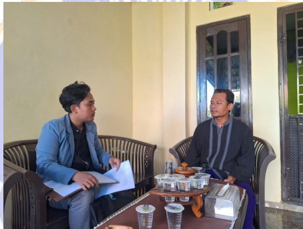
Gambar 2. Wawancara Bersama Ketua Kelompok Fardu Kifayah Al-Mujahidin 2025-2029