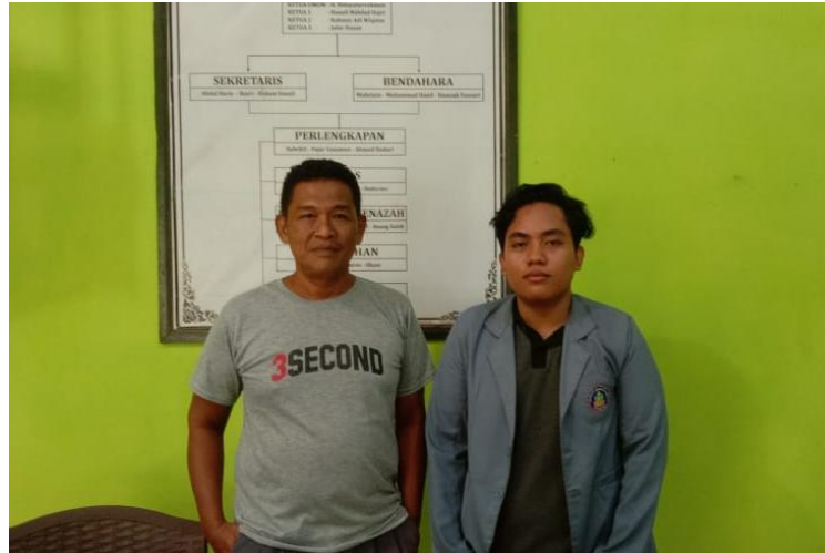
Gambar 16. Wawancara Bersama Penjaga Pemakaman Islam Kayu Buntul