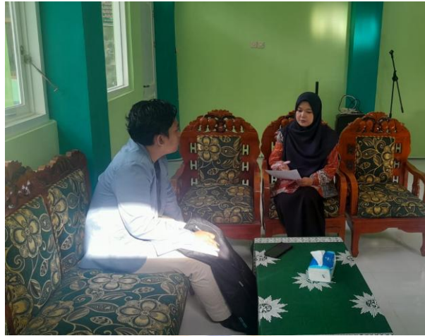
Gambar 1. Wawancara Bersama Guru Sosiologi SMAS Muhammadiyah 2 Singaraja