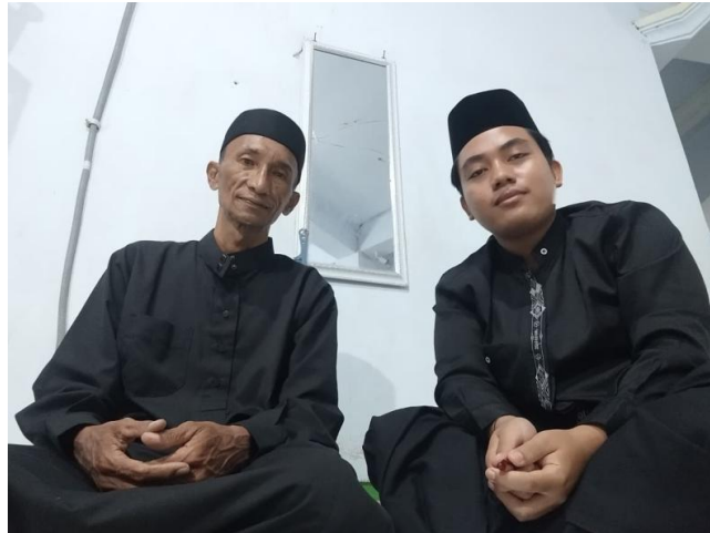
Gambar 10. Wawancara Bersama Pemandi Jenazah Fardu Kifayah Al-Mujahidin