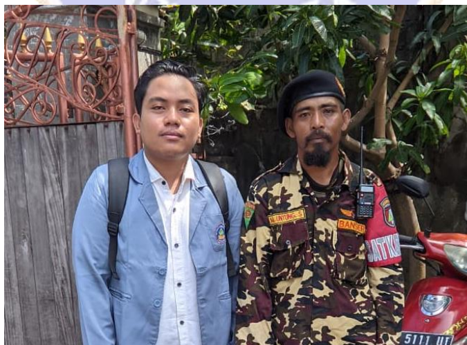
Gambar 15. Wawancara Bersama Pengurus Bagian Perlengkapan dan Keamanan Fardu Kifayah Al-Mujahidin 2025-2029