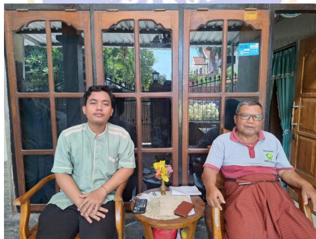
Gambar 3. Wawancara Bersama Ketua Yayasan Al-Mujahidin