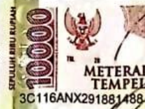
Kadek Torry Pingkany Dwijayanti