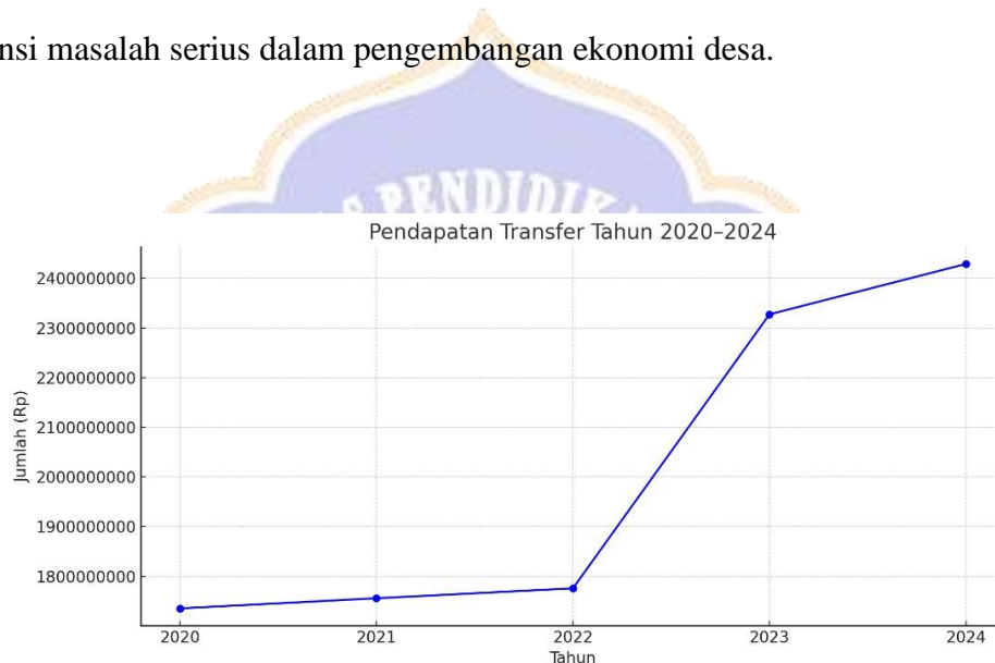
Gambar 1.2 Grafik Pendapatan Transfer Desa Busungbiu (2020-2024) Sumber: Diolah Peneliti, (2025)

2020-2021 merupakan masa pandemi Covid-19 yang penuh keterbatasan aktivitas ekonomi, PADes masih berada pada angka yang relatif tinggi. Namun, pada tahun 2022 PADes anjlok menjadi Rp22.325.000,00. Kondisi ini berlanjut pada tahun 2023 dengan sedikit kenaikan menjadi Rp38.400.000,00, namun tetap jauh di bawah angka tahun-tahun sebelumnya. Sedangkan pada tahun 2024, PADes kembali turun menjadi Rp33.400.000,00. Padahal tahun 2024 perekonomian dunia sudah terbilang membaik dan bahkan bertumbuh lebih pesat karena perkembangan teknologi yang ada. Fenomena penurunan tajam PADes ini, mengidentifikasi potensi masalah serius dalam pengembangan ekonomi desa.