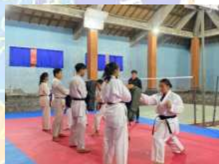
Lampiran 5. Hasil Tes Kecepatan Pukulan