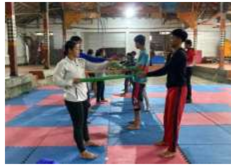
Lampiran 4. Pelaksanaan Posttest