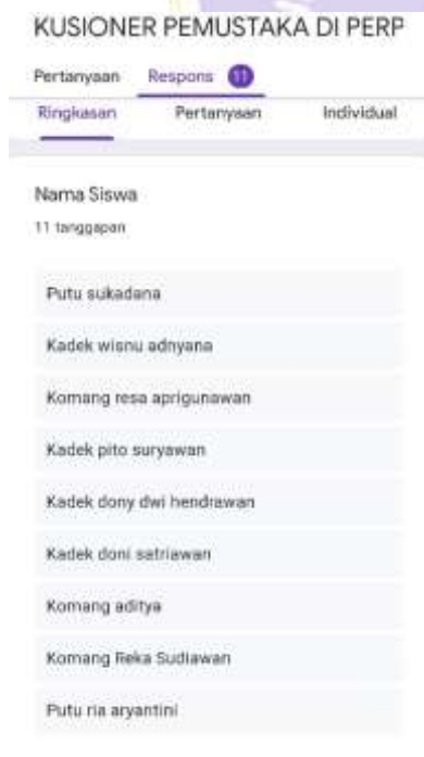
Gambar 8 : Responden Kusioner Google Forms Kepuasan Pemustaka di Perpustakaan SMK Negeri 2 Singaraja