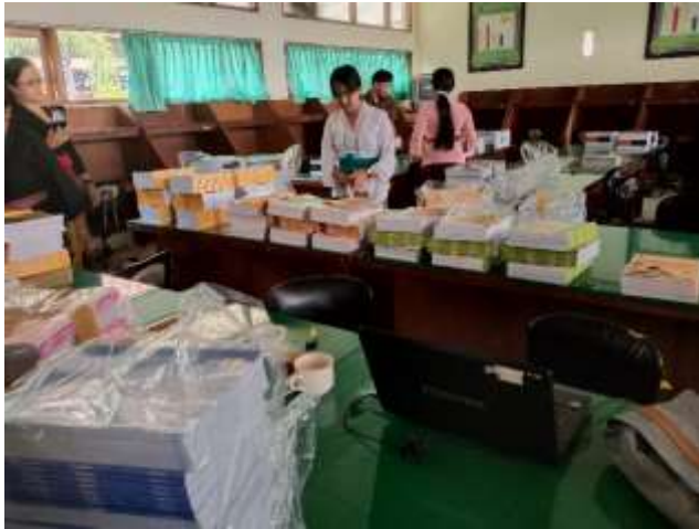
Gambar 3 : Aktifitas Pengadaan Bahan Pustaka oleh Pustakawan dan Mahasiswa PKL di Perpustakaan SMK Negeri 2 Singaraja

Sumber : Dokumen Ridwan, 15 Februari 2020