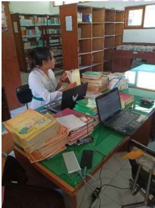
Gambar 4 : Aktifitas Pendataan Buku oleh Pustakawan dan Mahasiswa PKL di Perpustakaan SMK Negeri 2 Singaraja