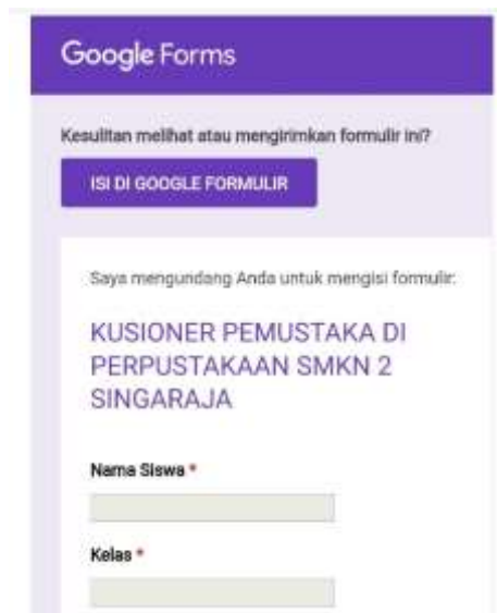
Gambar 7 : Halaman Awal Kusioner Google Forms Kepuasan Pemustaka di Perpustakaan SMK Negeri 2 Singaraja