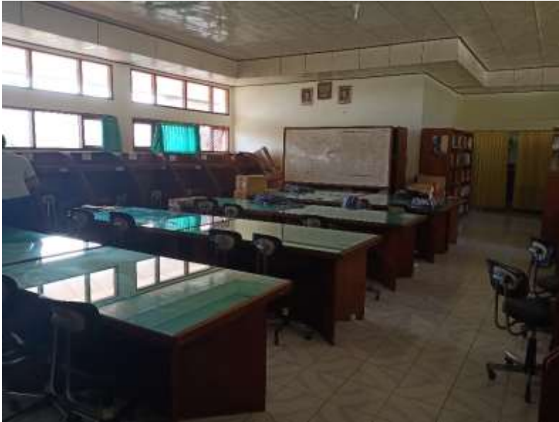
Gambar 1 : Ruang Baca Perpustakaan SMK Negeri 2 Singaraja