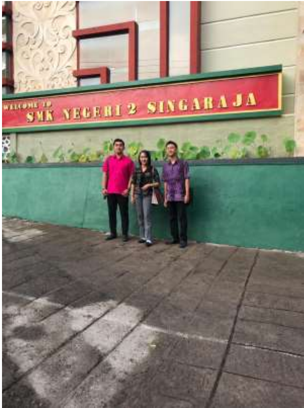
Gambar 9 : Foto Bersama di Depan Gedung SMK Negeri 2 Singaraja