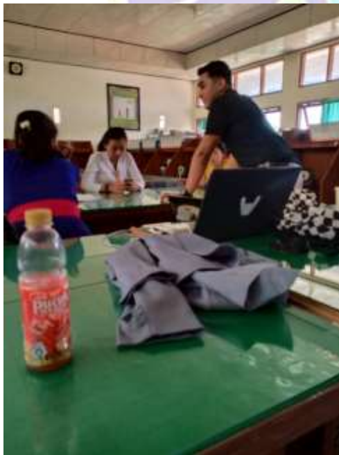
Gambar 2 : Aktifitas Literasi Siswa dan Siswi di Perpustakaan SMK Negeri 2 Singaraja

Sumber : Dokumen Ridwan, 12 Februari 2020