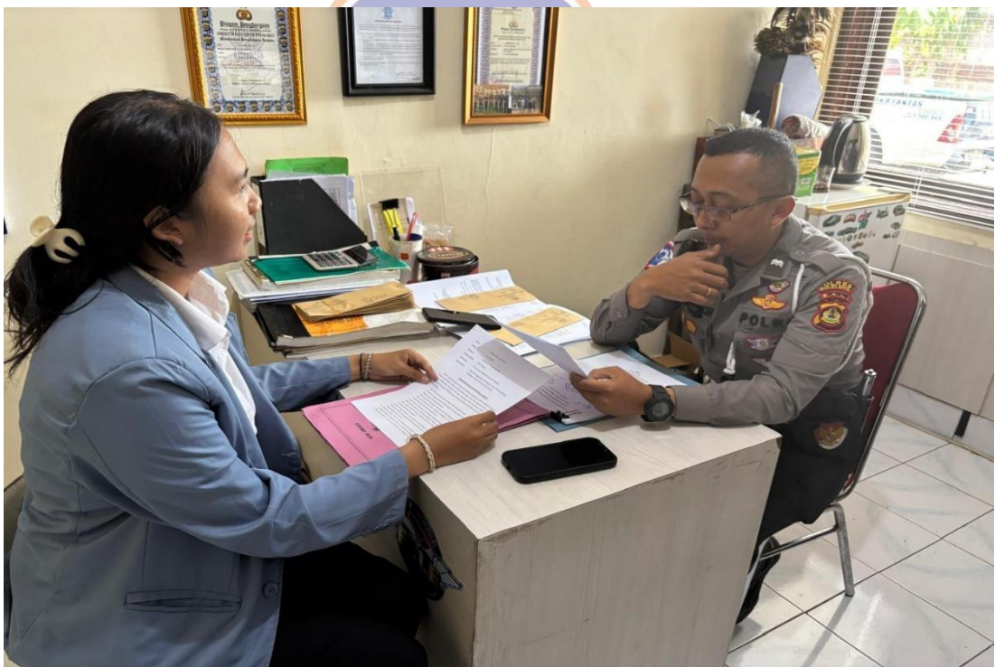
Lampiran 5. Wawancara bersama Anggota Unit Tilang Satuan Lalu Lintas Polres Buleleng