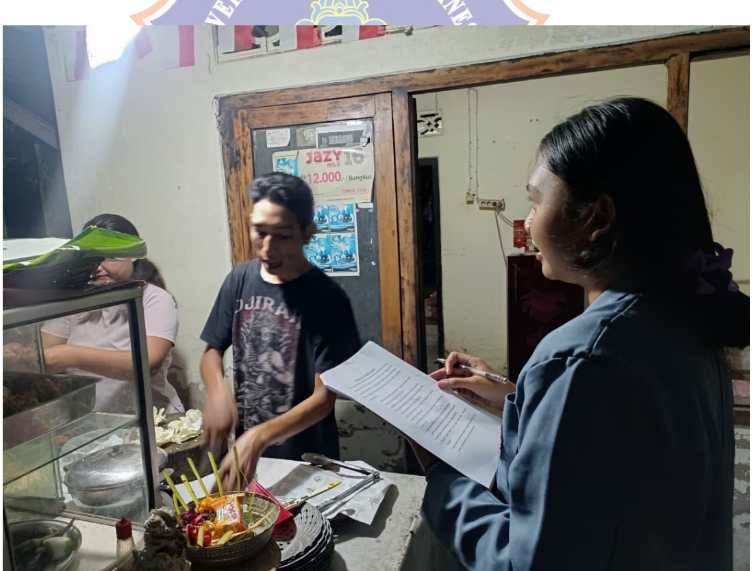
Lampiran 8. Wawancara bersama Masyarakat di Lokasi Jalan Kapten Muka, Kelurahan Banjar Jawa, Kota Singaraja