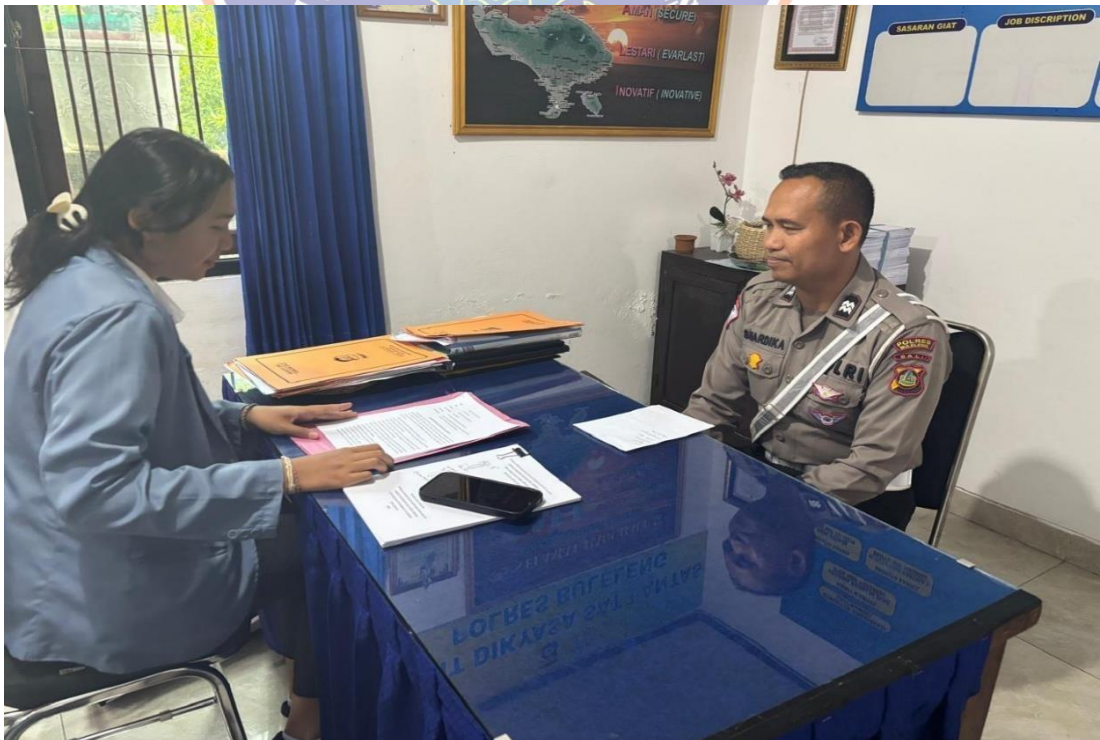
Lampiran 6. Wawancara bersama Pejabat Sementara Unit Keamanan dan Keselamatan Satuan Lalu Lintas Polres Buleleng