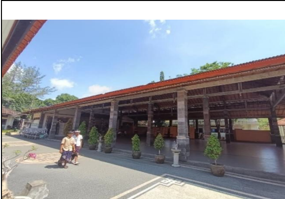
Gambar Aula Sekolah