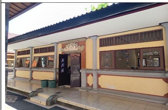
Gambar Ruang Kelas XI C