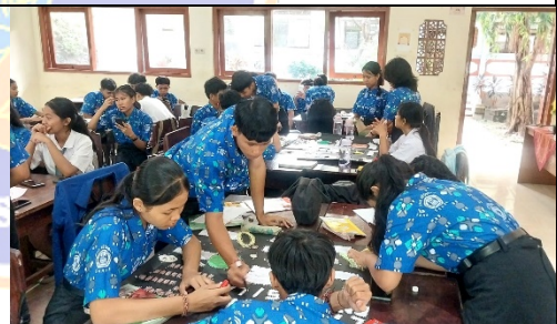
Gambar 1. Pembelajaran berbasis Project