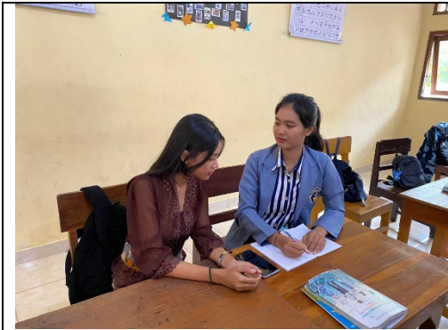
Gambar 1. Wawancara dengan Siswa A