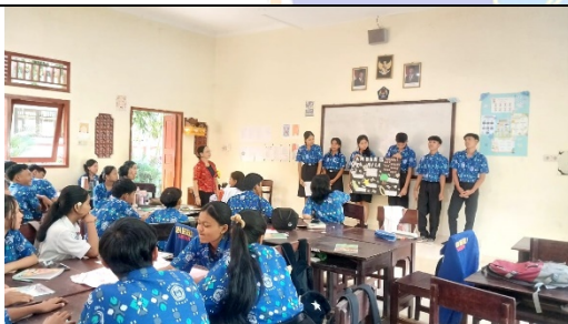
Gambar 1. Pembelajaran berbasis Project