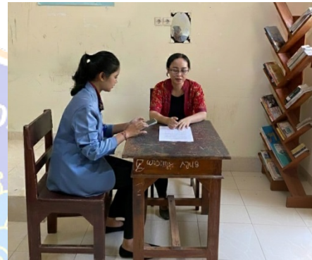
Gambar 1. Wawancara dengan Guru Pendidikan Pancasila sekaligus Wali Kelas XI C