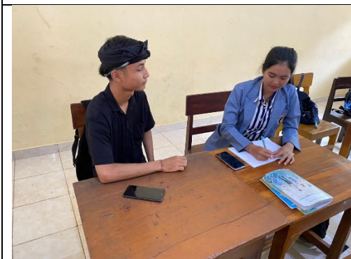
Gambar 1. Wawancara dengan Siswa B