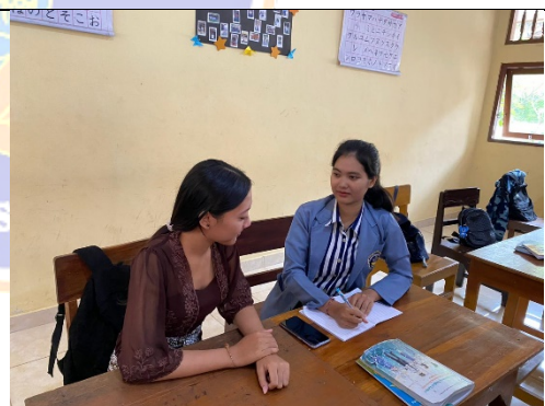
Gambar 1. Wawancara dengan Siswa C