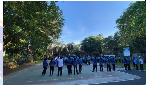
Gambar 1. Program Pagi Ceria