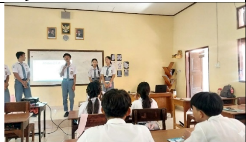
Gambar 1. Presentasi Kelompok