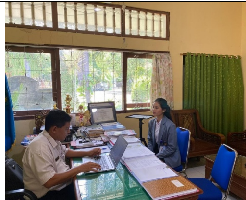
Gambar 1. Wawancara dengan Kepala Sekolah