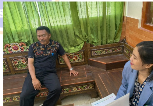
Gambar 1. Wawancara dengan Guru BK