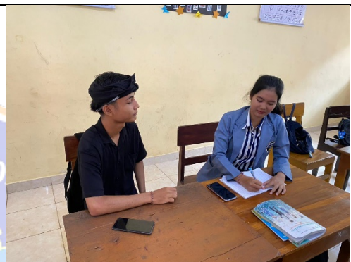
Gambar 1. Wawancara dengan Siswa B