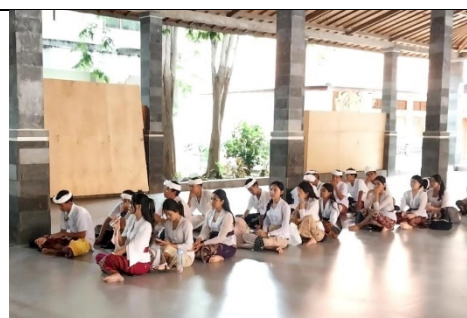
Gambar 1. Program Penguatan Karakter