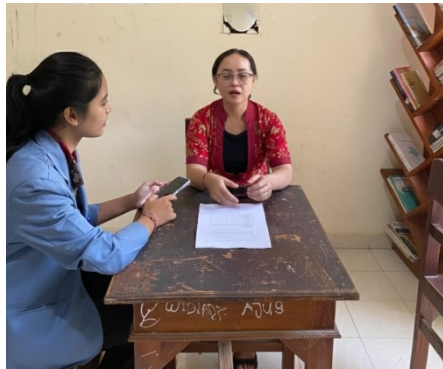
Gambar 1. Wawancara dengan Guru Pendidikan Pancasila sekaligus Wali Kelas XI C