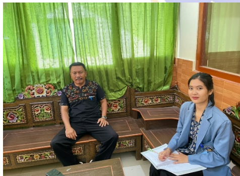
Gambar 1. Wawancara dengan Guru BK