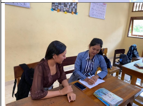
Gambar 1. Wawancara dengan Siswa C