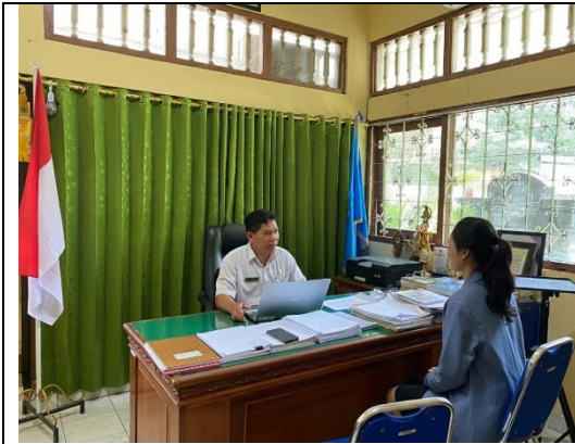
Gambar 1. Wawancara dengan Kepala Sekolah