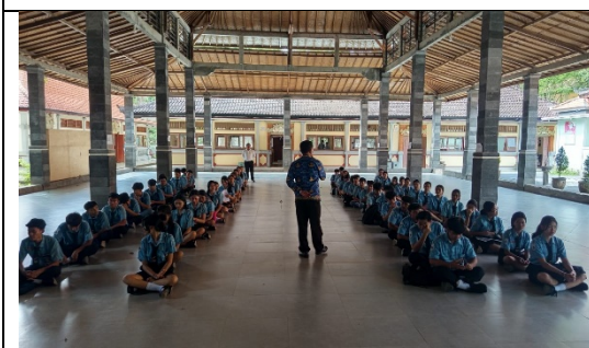
Gambar 1. Program Penguatan Karakter