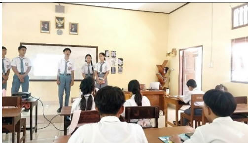
Gambar 1. Presentasi Kelompok