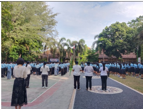
Gambar 1. Program Pagi Ceria