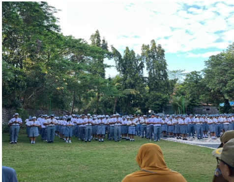
Gambar 1. Pelaksanaan Upacara Bendera