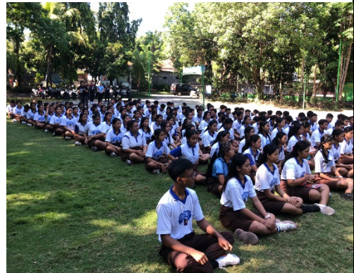
Gambar 1. Pembinaan Rutin