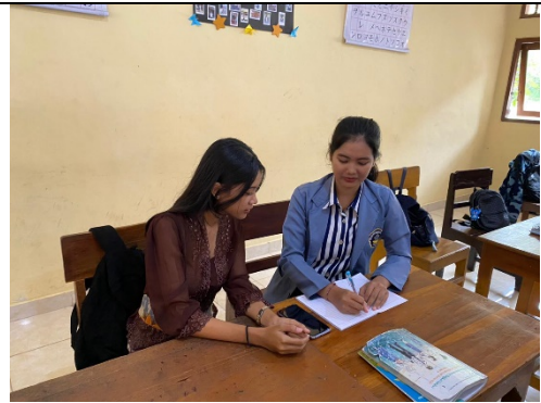
Gambar 1. Wawancara dengan Siswa A