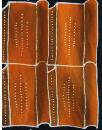
Gambar 1. 2 Motif Genteng

Ragam motif yang diproduksi industri “Ida Batik Bondowoso” terinspirasi dari budaya serta kekayaan alam Bondowoso khususnya desa Kalianyar. Motif-motif yang di produksi “Ida Batik Bondowoso” yakni motif daun singkong, daun kopi, kopi, genteng, blue fire , tahu, daun tembakau, ijen geopark, dan motif burung surga. Dari beragam motif yang dikembangkan industri tersebut akan dikombinasikan dengan motif lain dan akan di tambahkan dengan ornamen pendukung sehingga menghasilkan visual yang utuh, menarik, dan memiliki nilai estetika yang tinggi. Pembuatan batik di “Ida Batik Bondowoso” tidak hanya di desain untuk bahan baju saja, melainkan juga mengembangkan desain yang dapat di terapkan pada berbagai produk seperti udeng, jarik, dan berbagai aksesoris dengan tujuan agar tetap relevan dengan kebutuhan masyarakat modern. Akan tetapi sebagian besar yang dihasilkan tetap didominasi oleh desain yang diperuntukkan untuk baju.