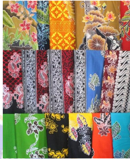
(Putri Ana Sabilillah 10 April 2025)