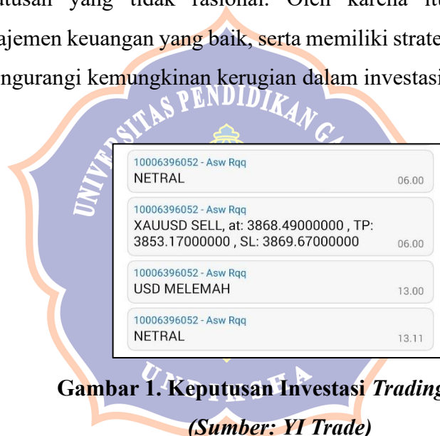
Gambar 1. Keputusan Investasi TradingForex

memperbesar profit tetapi juga meningkatkan risiko kehilangan modal dalam waktu singkat jika tidak dikelola dengan baik. Over trading atau terlalu sering membuka posisi tanpa analisis matang sering kali berujung pada kerugian akibat keputusan impulsif. Slippage dan eksekusi order yang tidak sesuai juga menjadi risiko, terutama saat pasar bergerak cepat. Risiko likuiditas dapat muncul saat pasar sepi, menyebabkan spread melebar dan biaya trading lebih tinggi. Selain faktor pasar dan teknis, kesalahan teknis seperti gangguan platform , koneksi internet terputus, atau kesalahan input order dapat menyebabkan kerugian yang tidak terduga. Psikologi trading juga menjadi tantangan besar, di mana emosi seperti keserakahan dan ketakutan dapat mendorong trader mengambil keputusan yang tidak rasional. Oleh karena itu, memahami risiko, menerapkan manajemen keuangan yang baik, serta memiliki strategi yang disiplin sangat penting untuk mengurangi kemungkinan kerugian dalam investasi trading forex .