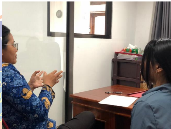
Gambar Lampiran 8 Wawancara Inspektorat