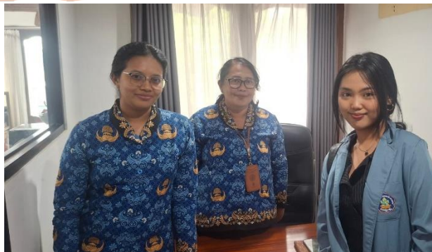
Gambar Lampiran 10 Penelitian Inspektorat