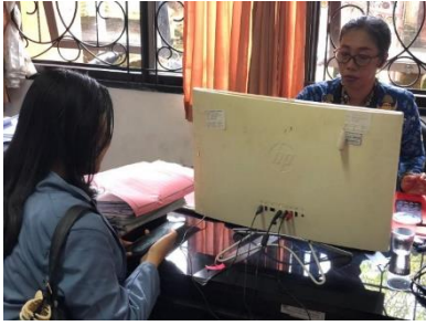
Gambar Lampiran 11 Penelitian di OPD