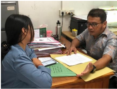
Gambar Lampiran 5 wawancara BPKAD