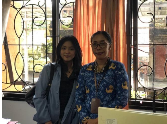
Gambar Lampiran 12 Wawancara OPD