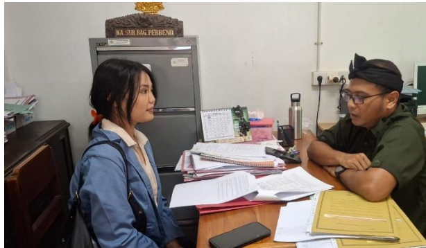
Gambar Lampiran 6 Penelitian BPKAD