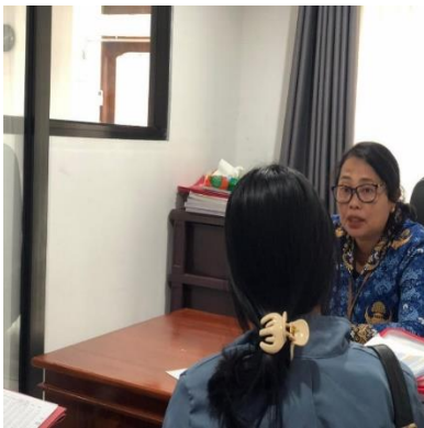
Gambar Lampiran 7 Wawancara Inspektorat