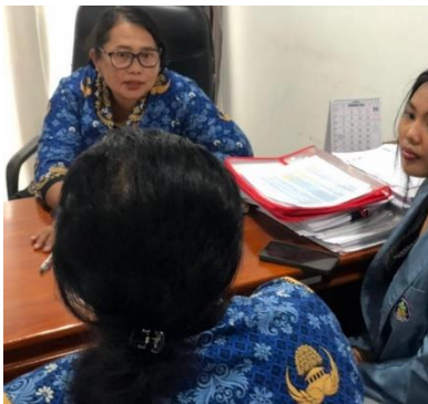
Gambar Lampiran 9 Penelitian Inspektorat