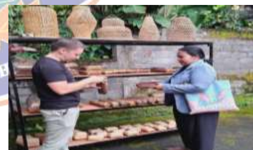
Aktivitas Melihat Produk yang di Pajang