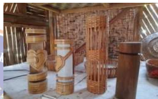
Produk Tempat Lampu dan Tumbler