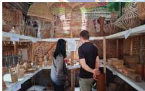
Aktivitas Melihat Produk yang di Pajang