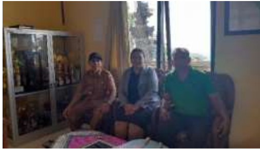
Permohonan izin kepada Kelapa Desa dalam Pengambilan data penelitian