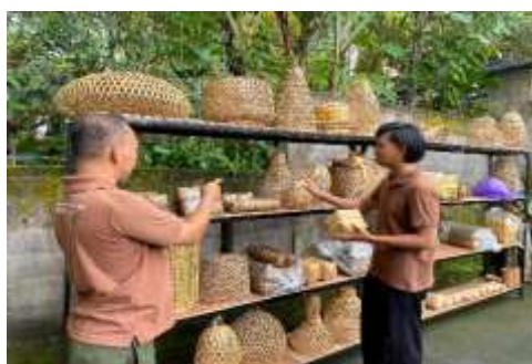
Aktivitas Melihat Produk yang di Pajang