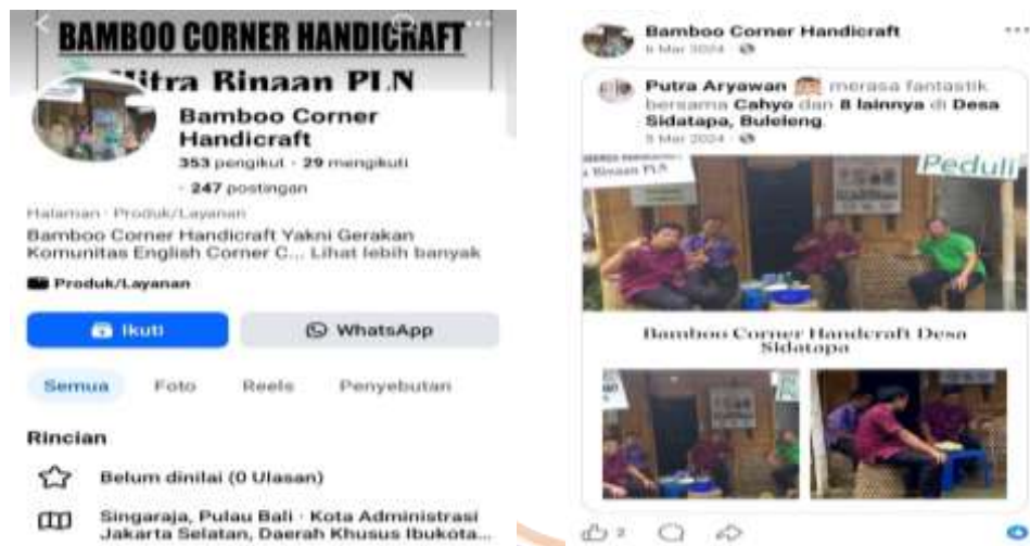
Tampilan Media Sosial (Facebook) Bamboo Corner Handicraft