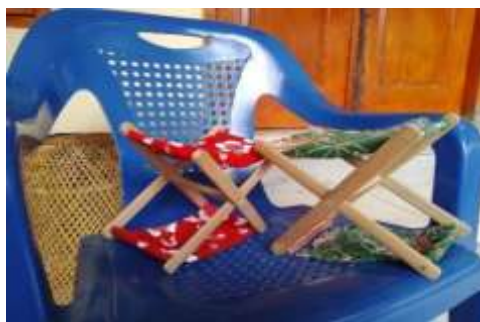
Bantal Tidur Pantai