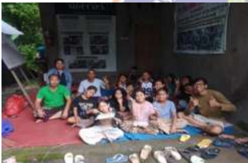
Hasil Kegiatan Menganyam