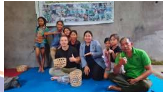
Hasil Kegiatan Menganyam