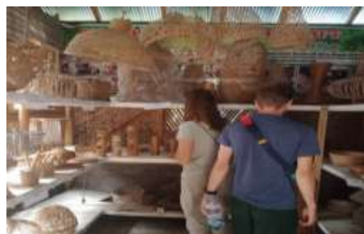
Aktivitas Melihat Produk yang di Pajang