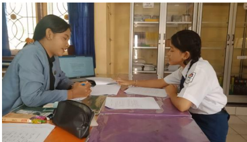
Gambar 9 Wawancara S 5