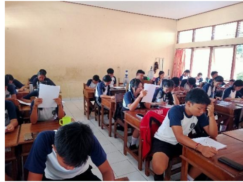
Gambar 2 Pelaksanaan Uji Coba Tes