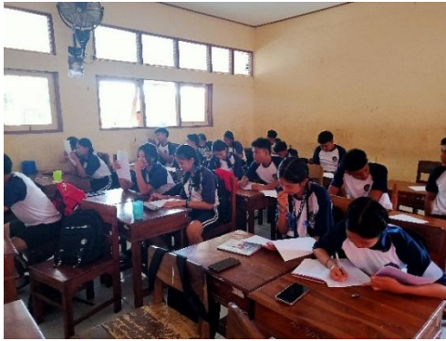
Gambar 1 Pelaksanaan Uji Coba Tes