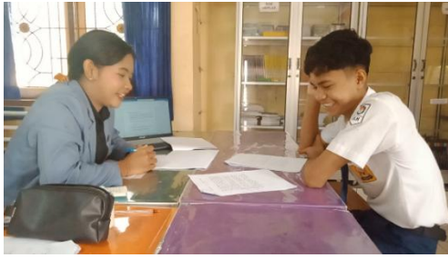
Gambar 7 Wawancara S 3