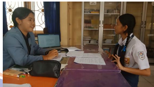
Gambar 10 Wawancara S 6