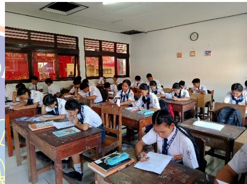
Gambar 4 Pelaksanaan Tes HOTS