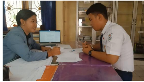
Gambar 8 Wawancara S 4