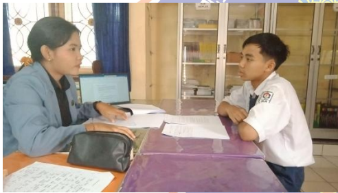
Gambar 11 Wawancara S 7