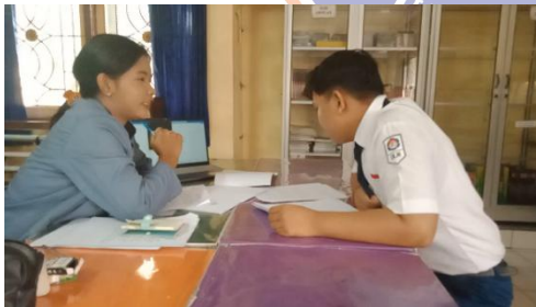
Gambar 5 Wawancara S 1