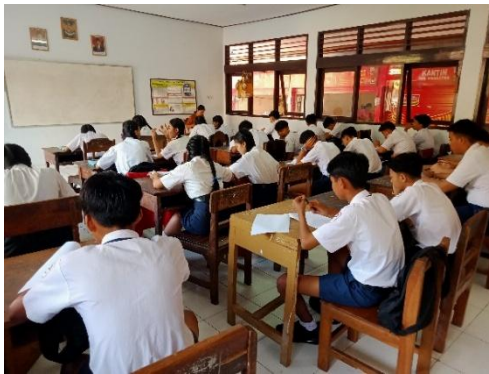
Gambar 3 Pelaksanaan Tes HOTS