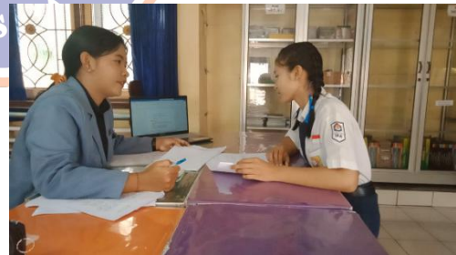
Gambar 6 Wawancara S 2