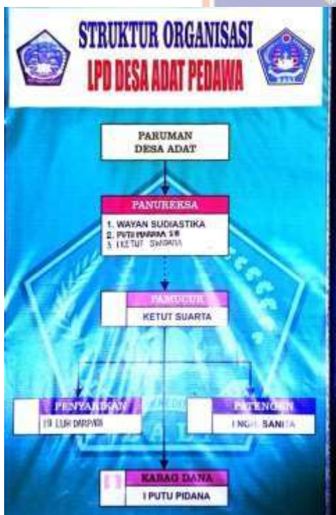
Struktur Organisasi LPD Desa Adat Pedawa