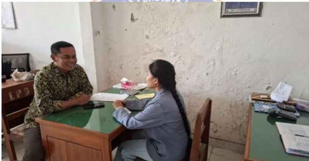
Obsevasi dan Wawancara dengan Bendahara LPD Desa Adat Pedawa