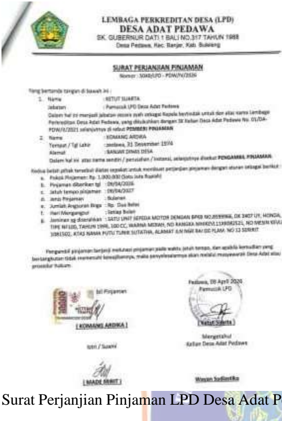
Surat Perjanjian Pinjaman LPD Desa Adat Pedawa