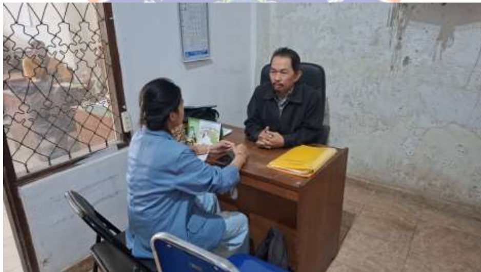
Obsevasi dan Wawancara dengan Kepala LPD Desa Adat Pedawa