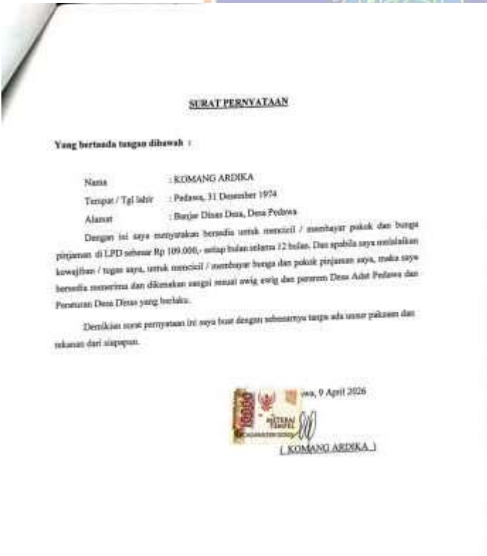
Surat Pernyataan LPD Desa Adat Pedawa