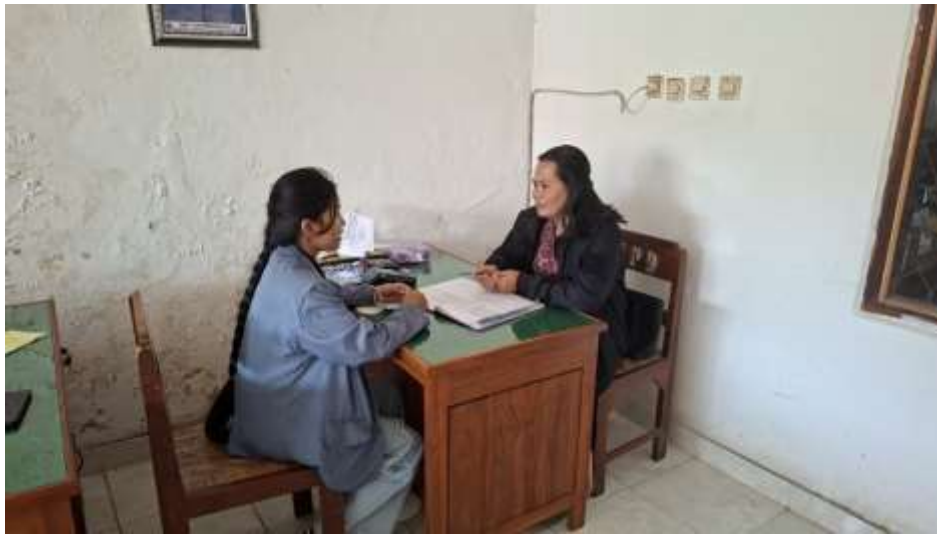
Obsevasi dan Wawancara dengan Sekretaris LPD Desa Adat Pedawa