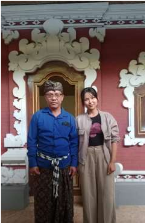
Wawancara dengan Kelian Adat Pedawa