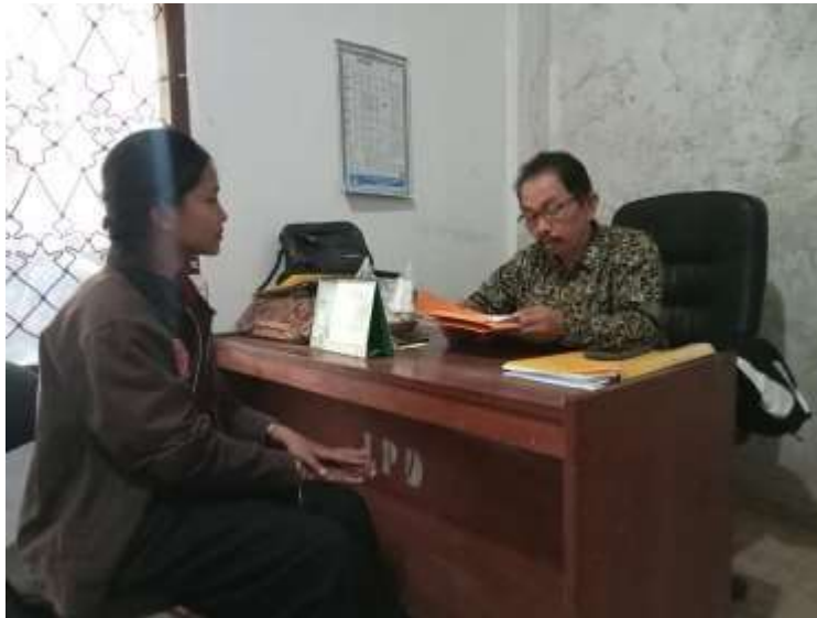
Observasi langsung pada LPD Desa Adat Pedawa