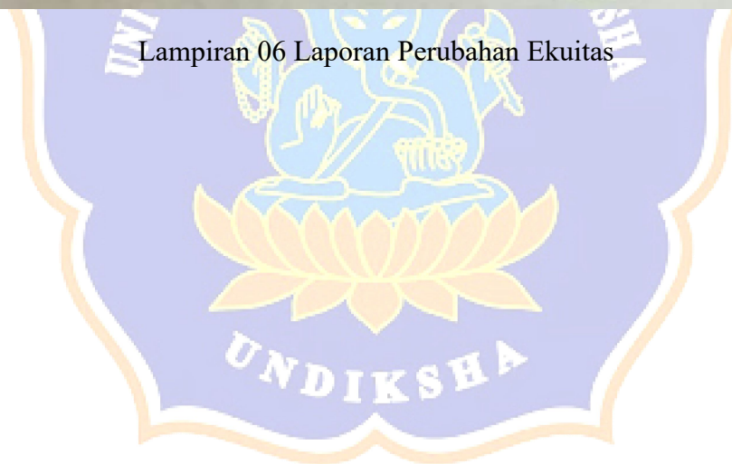
Lampiran 06 Laporan Perubahan Ekuitas