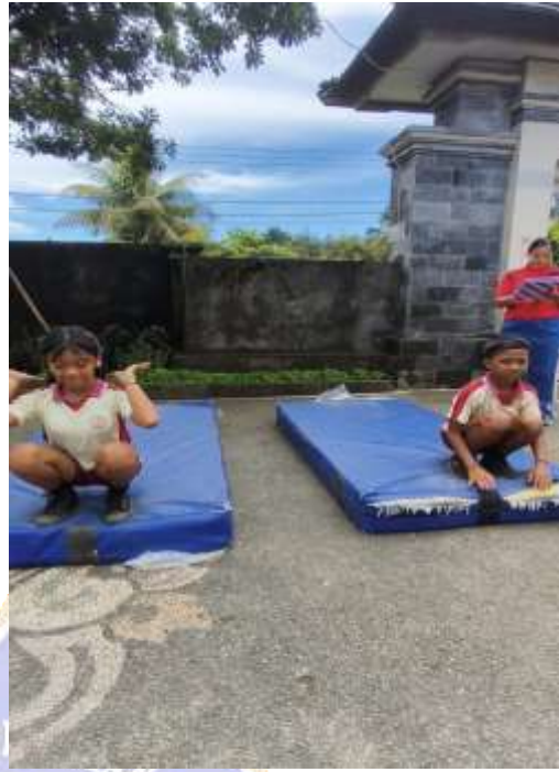
Post Tes Hasil Belajar Pembelajaran TPS