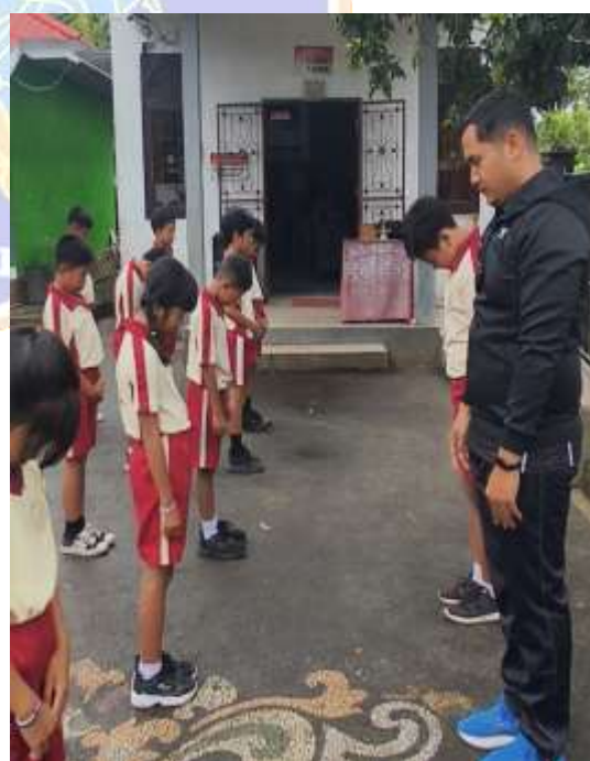
Post Tes Pembelajaran PBL