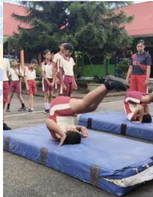
Pretest Hasil Belajar Pembelajaran TPS