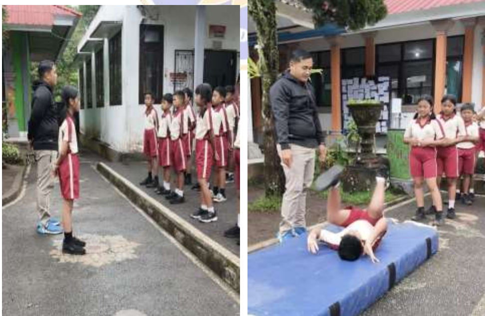
Pretest Pembelajaran PBL