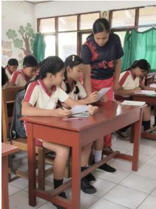
Pretest Motivasi Pembelajaran TPS