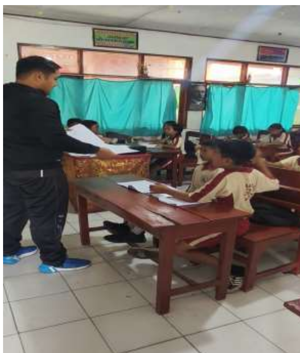
Post Tes Motivasi Belajar Pembelajaran PBL