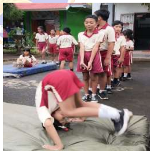
Proses Pembelajaran PBL