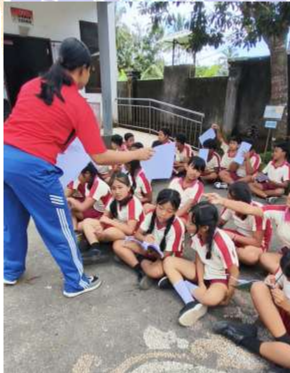
Post Tes Motivasi Belajar Pembelajaran TPS