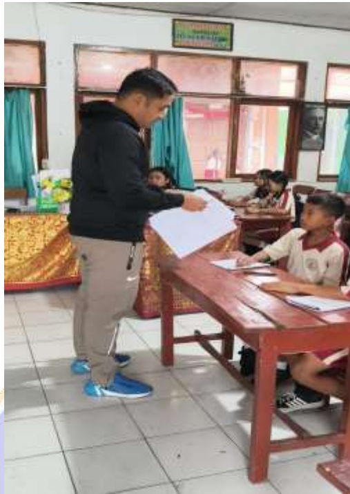
Pretest Motivasi Pembelajaran PBL