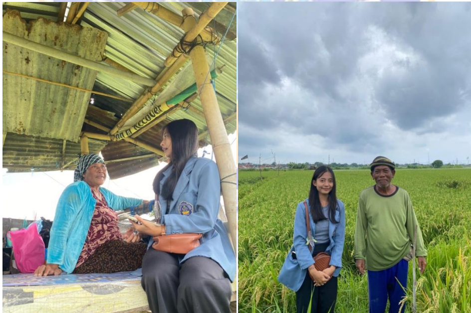
Lampiran 14. Wawancara bersama pasangan suami istri. Selaku Petani di Kelurahan Banyuning, Jalan Pulau Komodo