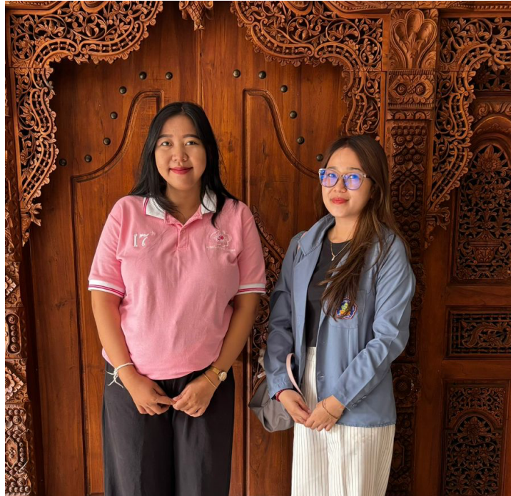
Wawancara di Banyualit Spa and Resort