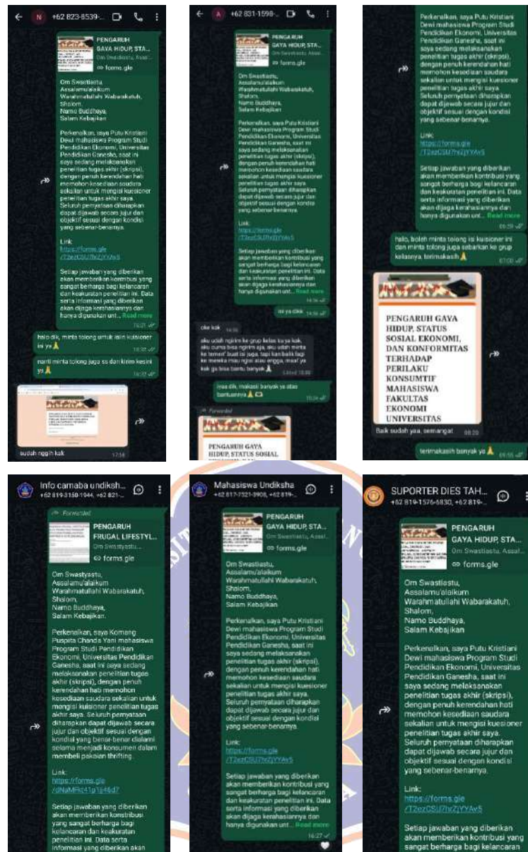
Penyebaran Kuesioner Penelitian Tahap 3 Melalui WhatsApp Pribadi dan Grup