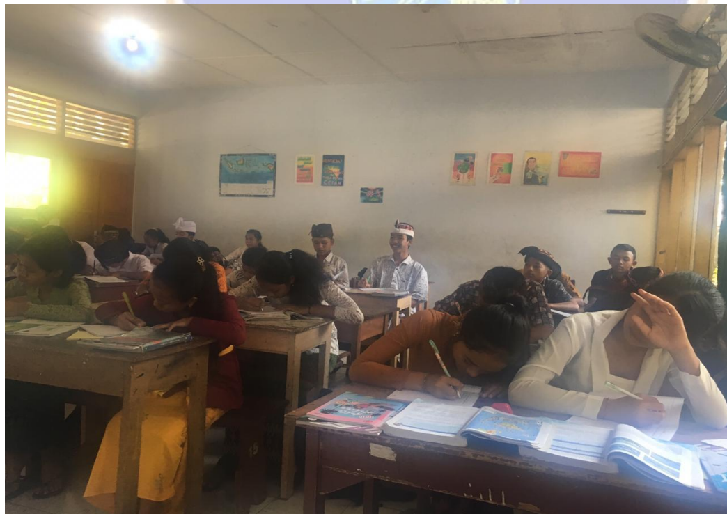
Keterangan kegiatan siswa belajar mengajar hari Kamis di SMP Negeri 2 singlaraja.