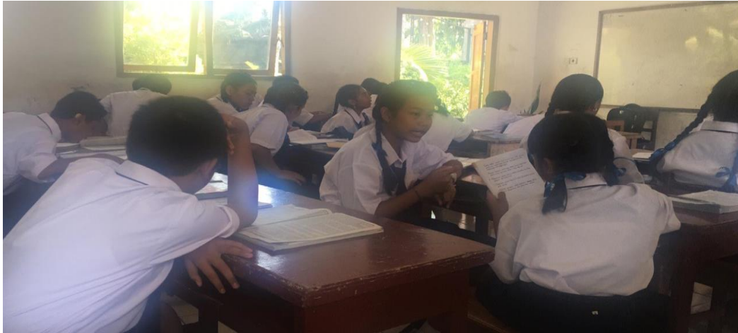
Keterangan keadaan kelas saat guru mengajar (data observasi, 2019)