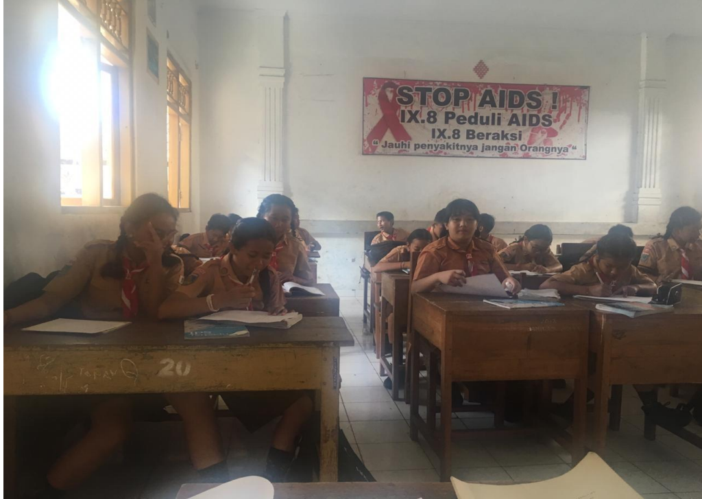
Keterangan kegiatan belajar siswa kelas VII SMP Negeri 2 Singaraja (data observasi, 2019)