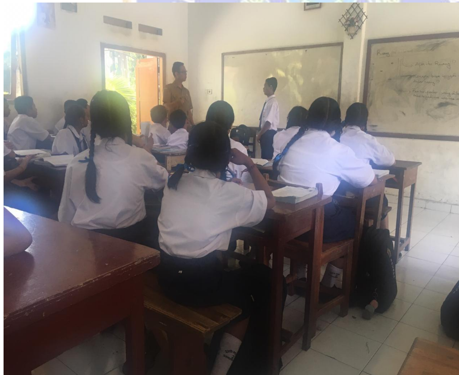
Keterangan keadaan guru mengajar saat di dalam kelas (data observasi, 2019)