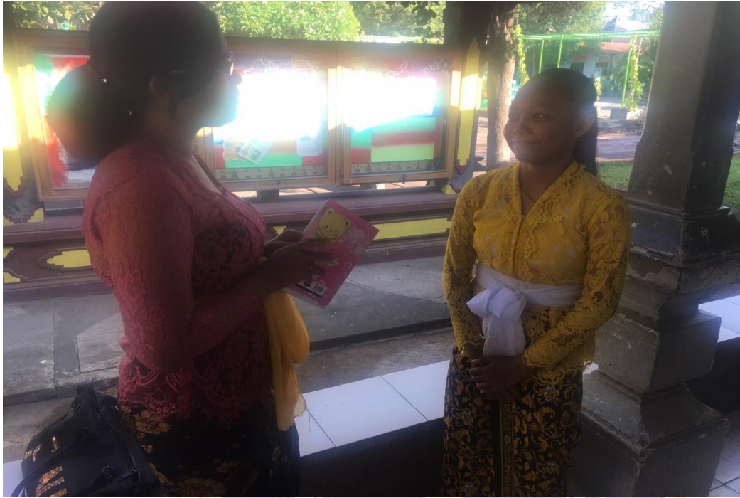
Keterangan kegiatan wawancara siswa kelas VII SMP Negeri 2 Singaraja (data wawancara, 2019)