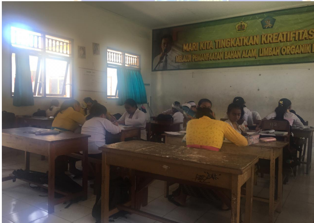
Keterangan kegiatan belajar siswa kelas VII di SMP Negeri 2 Singaraja (data observasi, 2019)