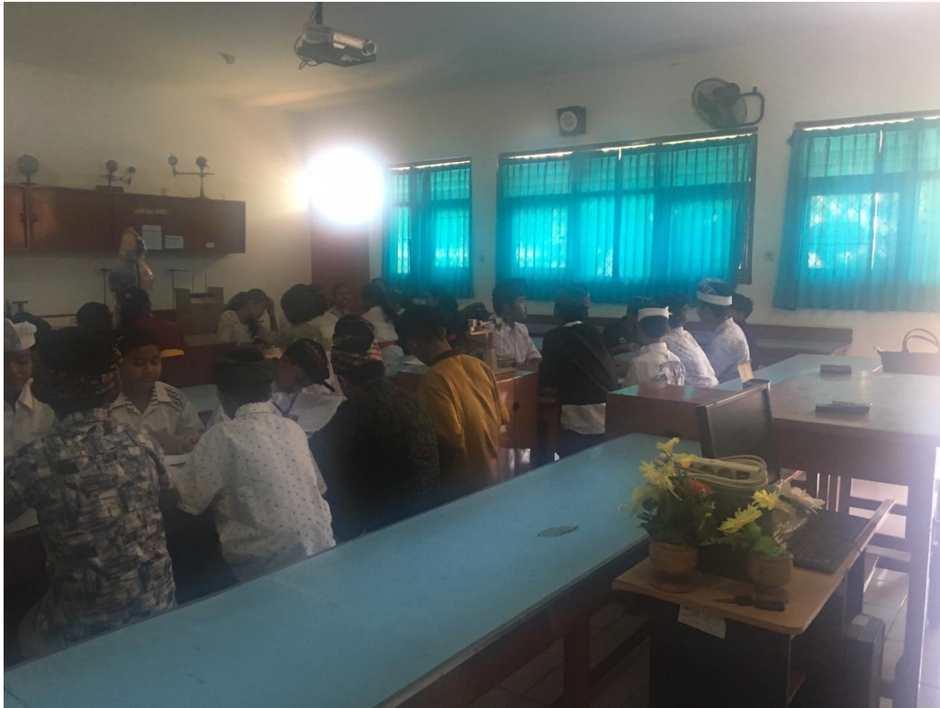
Keterangan kegiatan siswa kelas VII belajar di LAB (data, observasi 2019)