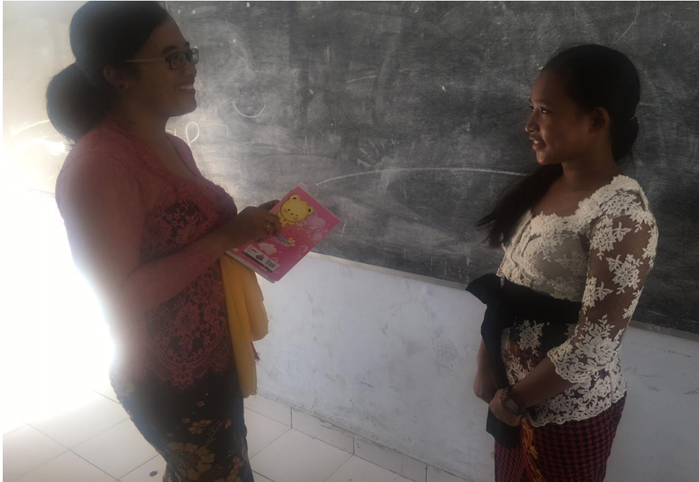
Keterangan kegiatan wawancara siswa kelas VII SMP Negeri 2 Singaraja (data wawancara, 2019)