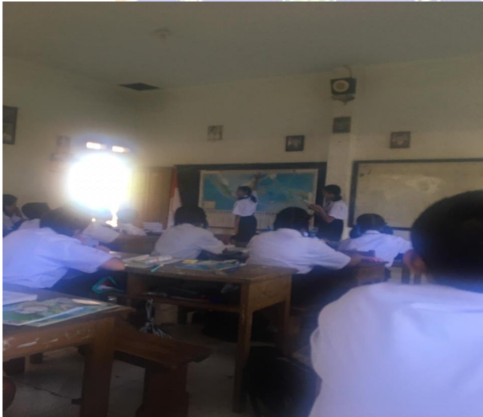
Keterangan belajar dalam kelas menggunakan media Globe (data observasi,2019)