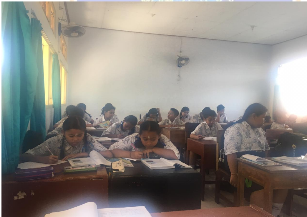
Keterangan belajar mengajar latihan soal (data observasi, 2019)