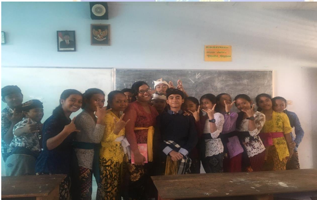
Keterangan foto bersama setelah belajar mengajar siswa kelas VII SMP Negeri 2 Singaraja (data wawancara, 2019)