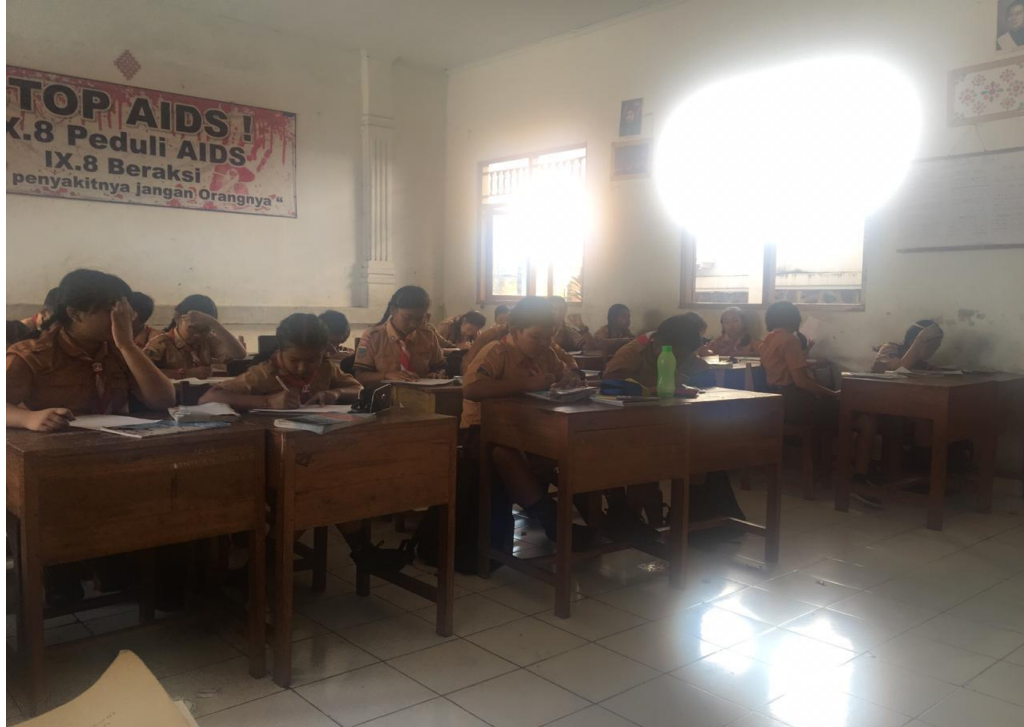
Keterangan kegiatan belajar mengajar siswa kelas VII SMP Negeri 2 Singaraja (data wawancara, 2019)