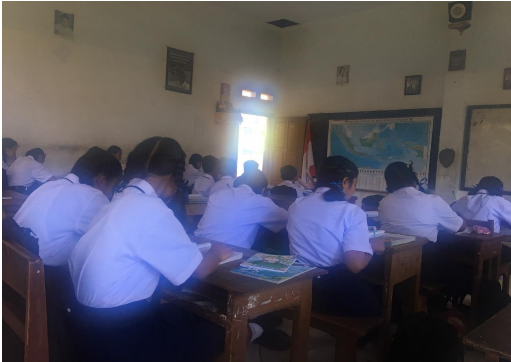
Keterangan proses belajar mengajar di dalam kelas menggunakan Globe (data observasi,2019)