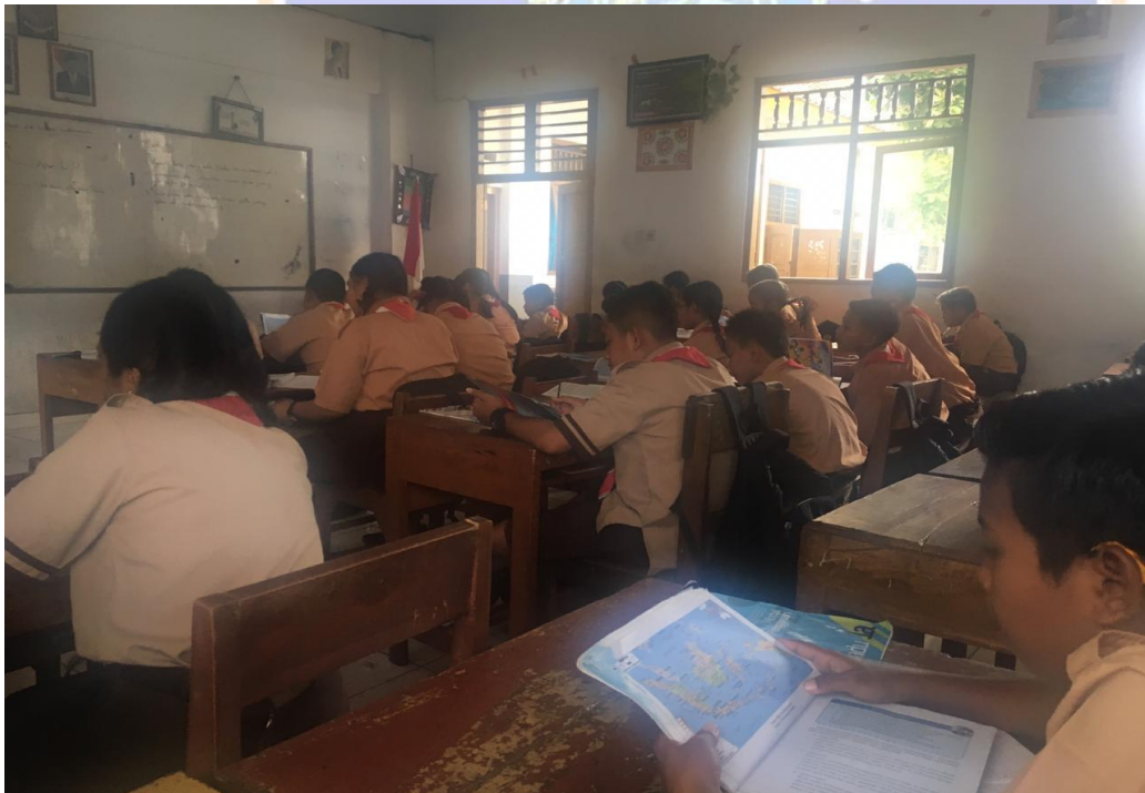
Keterangan siswa belajar mengajar kelas VII SMP Negeri 2 Singaraja (data observasi, 2019)