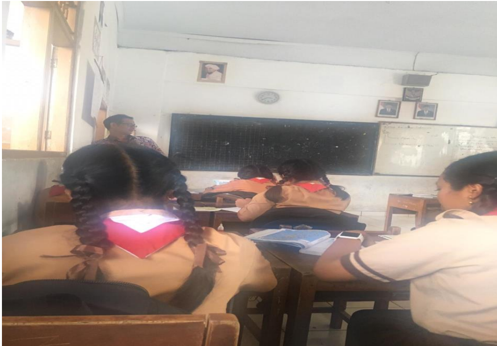
Keterangan kegiatan siswa belajar mengajar di dalam kelas SMP Negeri 2 Singaraja (data observasi, 2019)