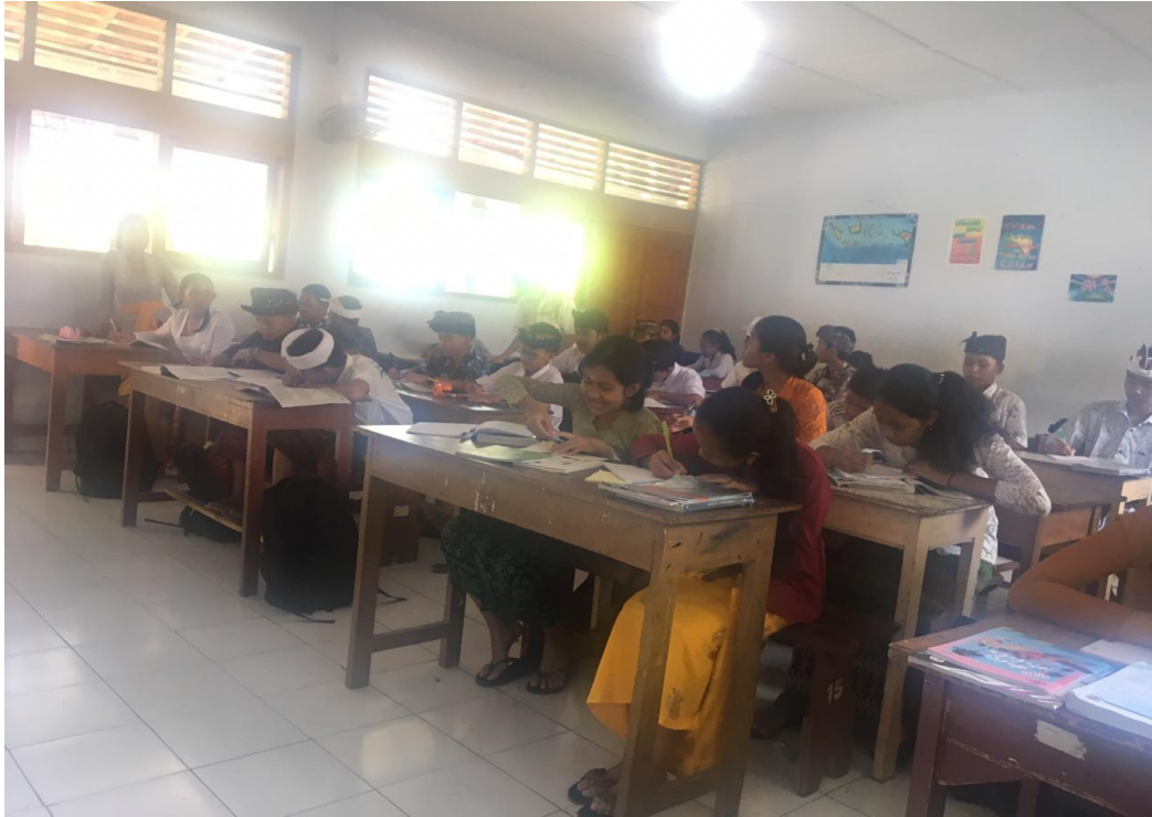
Keterangan siswa belajar di dalam kelas hari Kamis menggunakan pakaian adat Bali (data observasi ,2019)