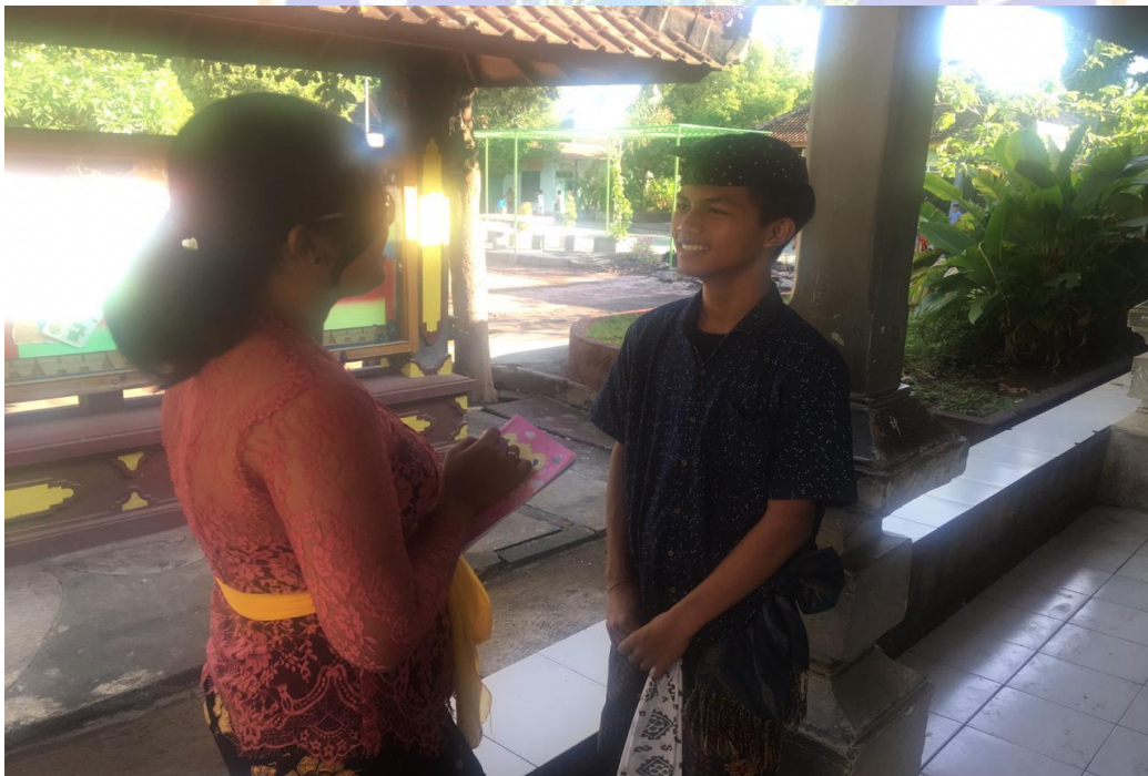
Keterangan kegiatan wawancara siswa kelas VII SMP Negeri 2 Singaraja (data wawancara, 2019)