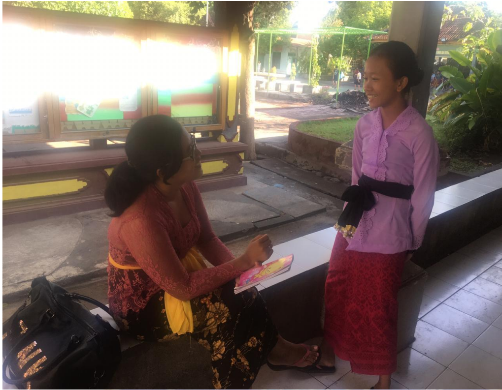
Keterangan kegiatan wawancara terhadap siswa (data wawancara, 2019)