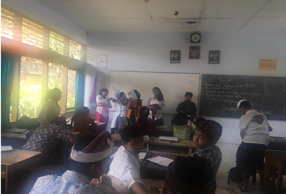
Keterangan kegiatan siswa belajar di dalam kelas sesi tanya jawab (data observasi, 2019)