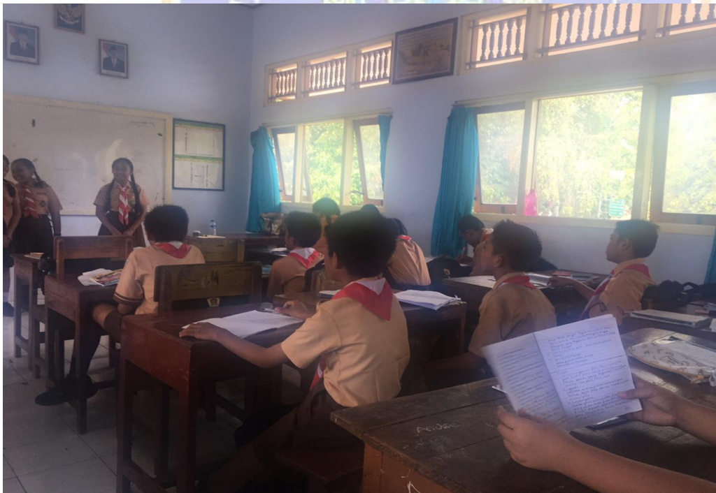
Keterangan belajar mengajar siswa kelas VII SMP Negeri 2 Singaraja (data observasi)