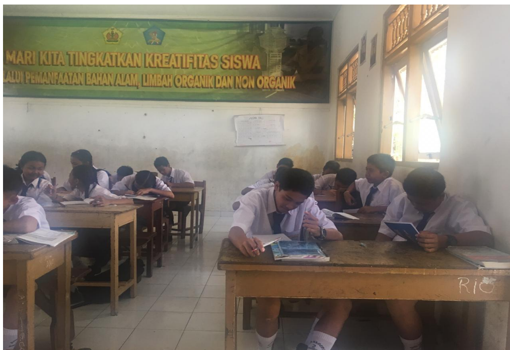
Keterangan belajar mengajar siswa kelas VII SMP Negeri 2 Singaraja (data observasi, 2019)