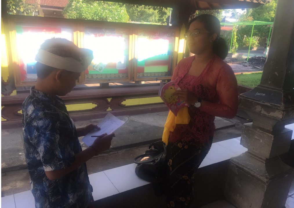
Keterangan kegiatan wawancara siswa kelas VII SMP Negeri 2 Singaraja (data wawancara, 2019)