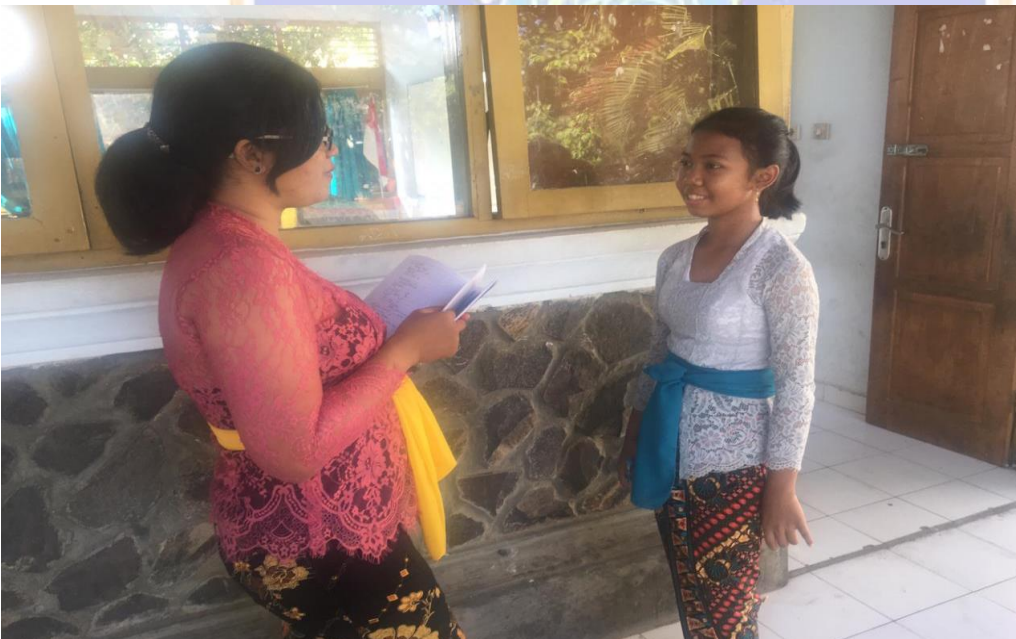
Keterangan kegiatan wawancara siswa kelas VII SMP Negeri 2 Singaraja (data wawancara, 2019)