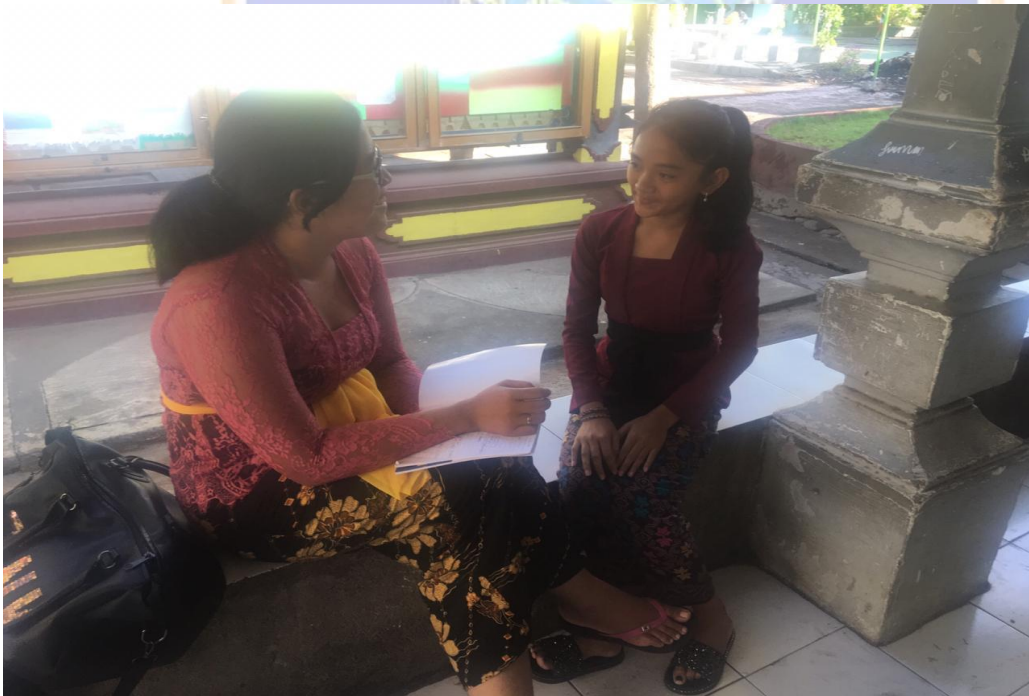
Keterangan kegiatan wawancara siswa kelas VII SMP Negeri 2 Singaraja (data wawancara, 2019)