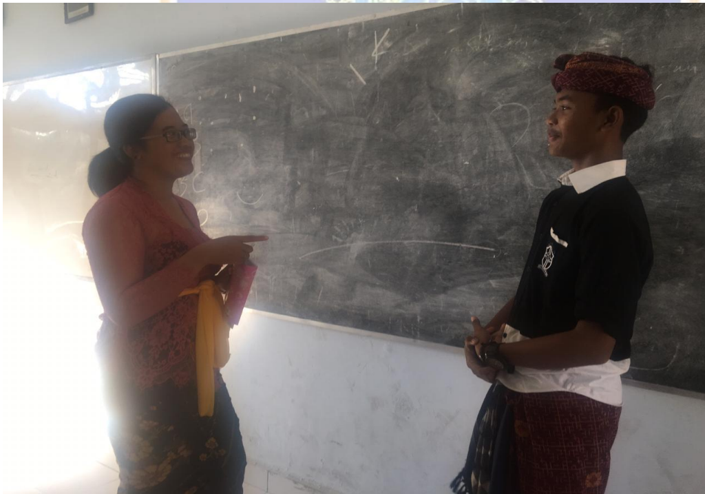
Keterangan kegiatan wawancara siswa kelas VII SMP Negeri 2 Singaraja (data wawancara, 2019)