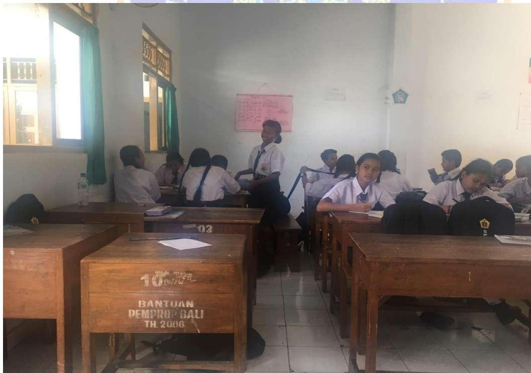
Keterangan belajar mengajar di kelas sesi diskusi atau belajar kelompok (data observasi, 2019)