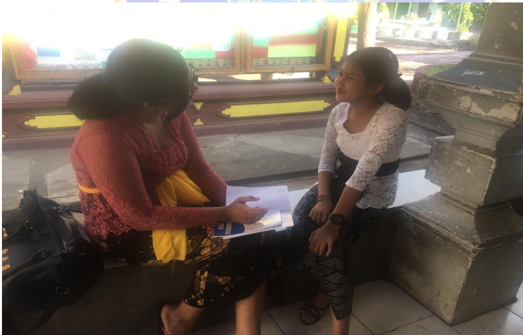
Keterangan kegiatan wawancara siswa kelas VII SMP Negeri 2 Singaraja (data wawancara, 2019)