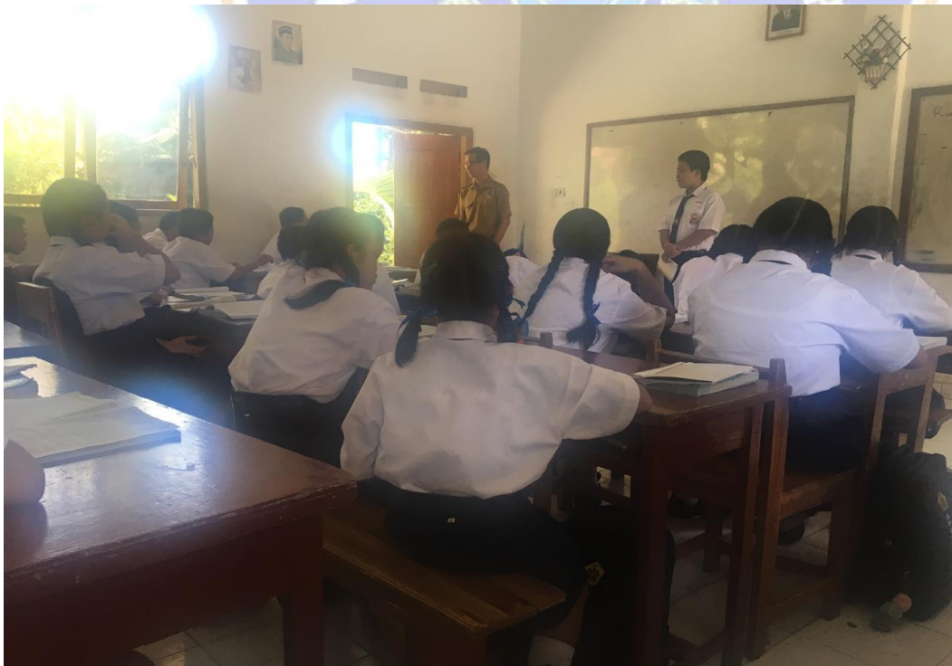
Keterangan belajar mengajar di dalam kelas (data observasi,2019)