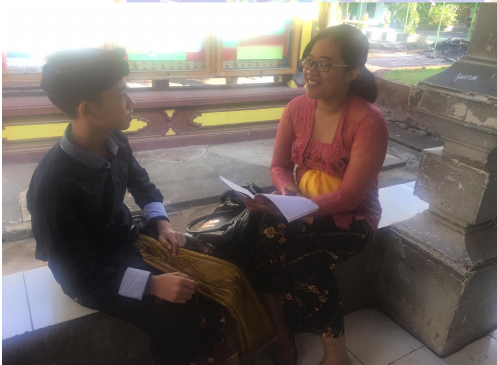
Keterangan kegiatan wawancara siswa kelas VII SMP Negeri 2 Singaraja (data wawancara, 2019)