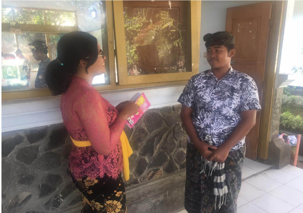
Keterangan kegiatan wawancara siswa kelas VII SMP Negeri 2 Singaraja (data wawancara, 2019)