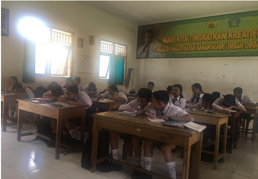
Keterangan kegiatan siswa belajar mengajar di SMP Negeri 2 Singaraja (data observasi, 2019)