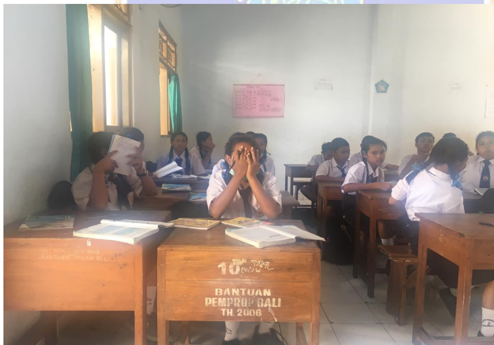
Keterangan kegiatan belajar mengajar siswa kelas VII SMP Negeri 2 Singaraja (data observasi, 2019)