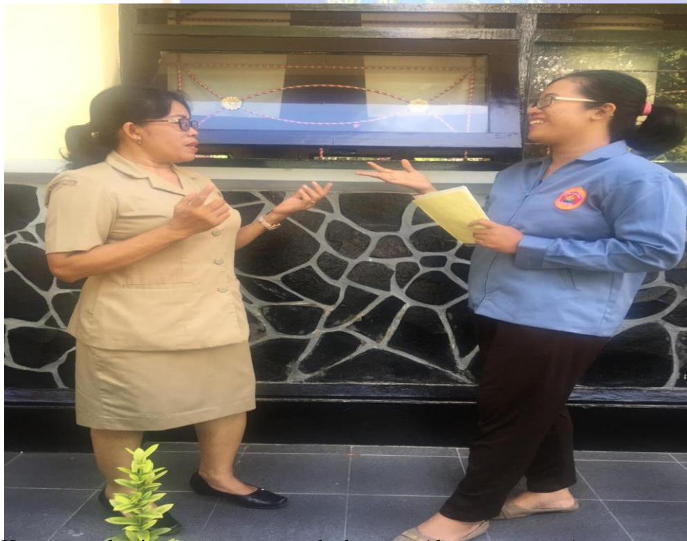
Keterangan kegiatan wawancara terhadap guru (data wawancara)