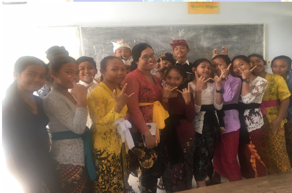
Keterangan foto bersama setelah kegiatan wawancara siswa kelas VII SMP Negeri 2 Singaraja (data wawancara, 2019)