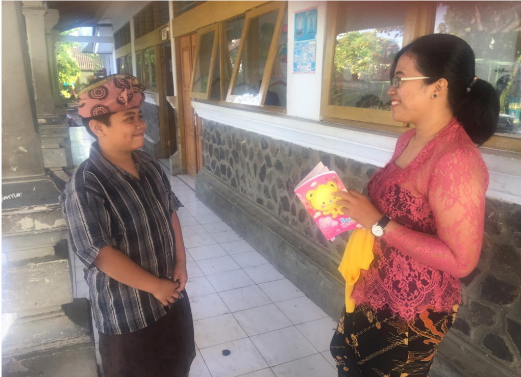
Keterangan kegiatan wawancara siswa kelas VII SMP Negeri 2 Singaraja (data wawancara, 2019)