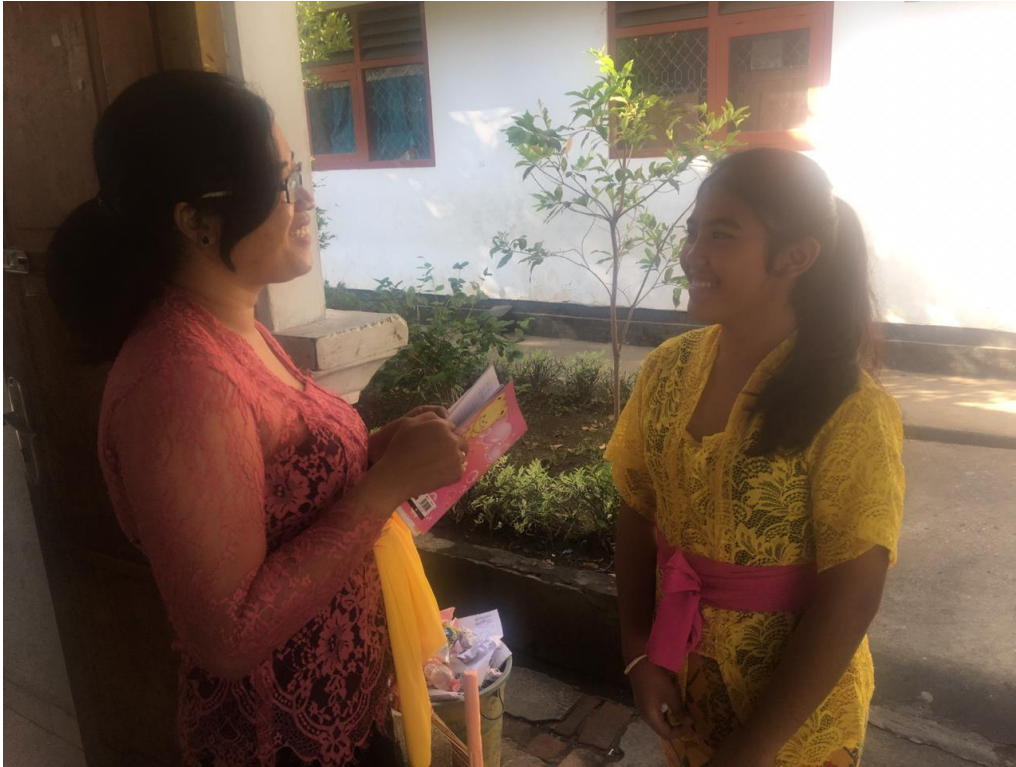
Keterangan kegiatan wawancara siswa kelas VII SMP Negeri 2 Singaraja (data wawancara, 2019)