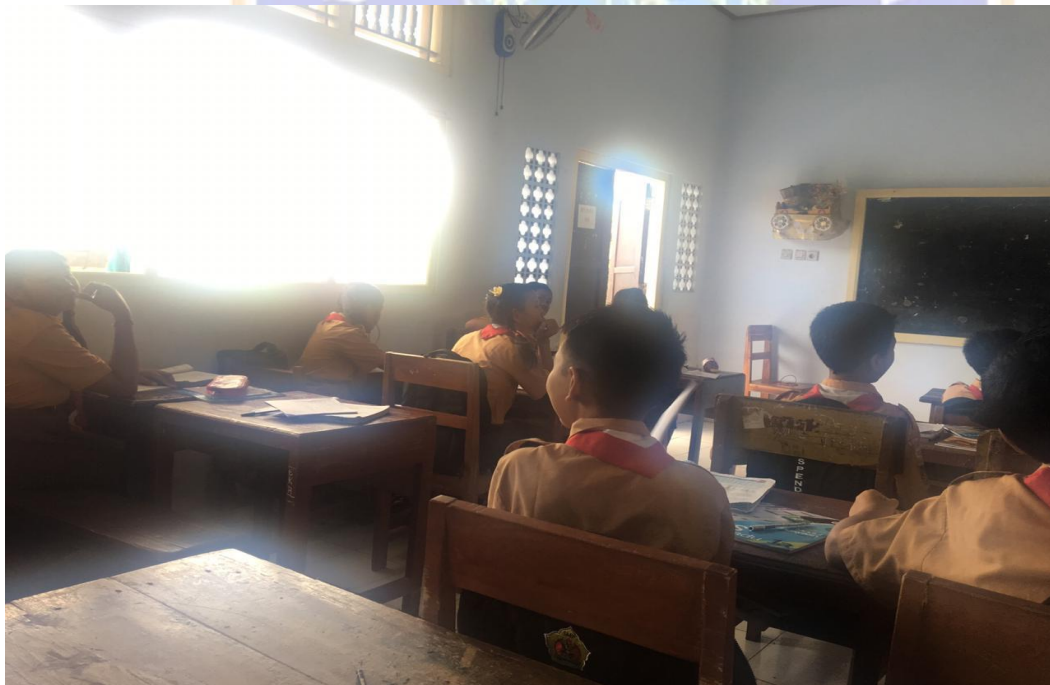
Keterangan belajar mengajar kelas VII siswa SMP Negeri 2 Singaraja (data observasi, 2019)