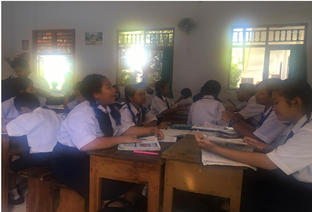
Keterangan belajar mengajar di kelas sesi diskusi atau belajar kelompok (data observasi,2019)