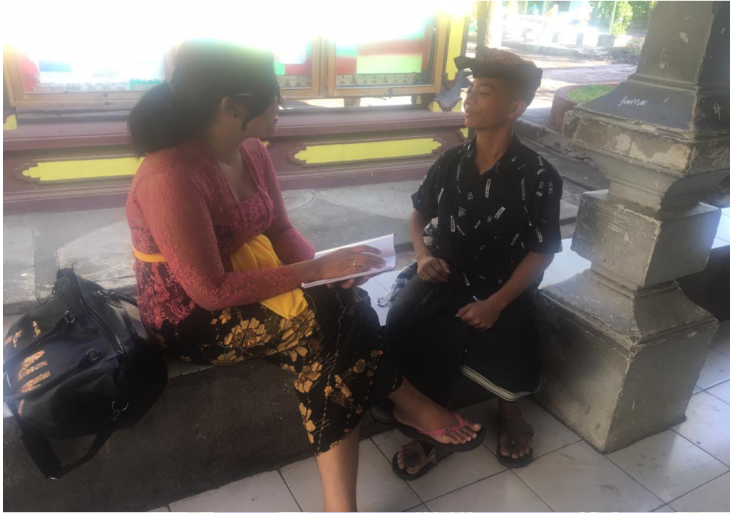
Keterangan kegiatan wawancara siswa kelas VII SMP Negeri 2 Singaraja (data wawancara, 2019)