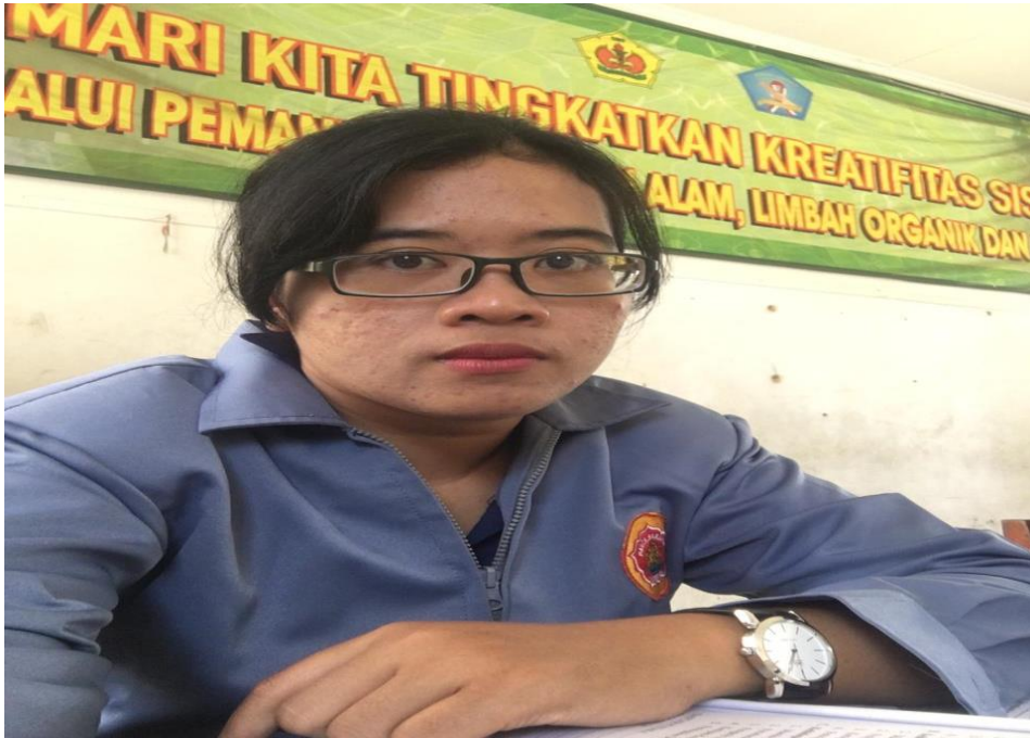
Keterangan peneliti melakukan data observasi di dalam kelas (data observasi,2019)