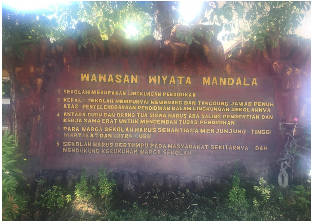
Keterangan papan nama Wawasan Wiyata Mandala SMP Negeri 2 Singaraja