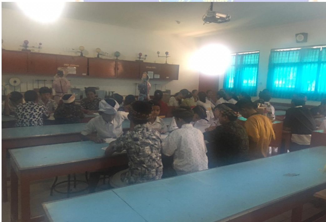
Keterangan kegiatan siswa belajar menggunakan LAB hari Kamis (data, observasi 2019)