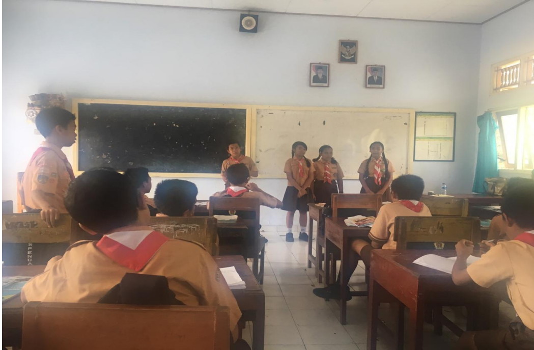
Keterangan kegiatan belajar mengajar siswa kelas VII hari Jumat sesi tanya jawab (data observasi, 2019)