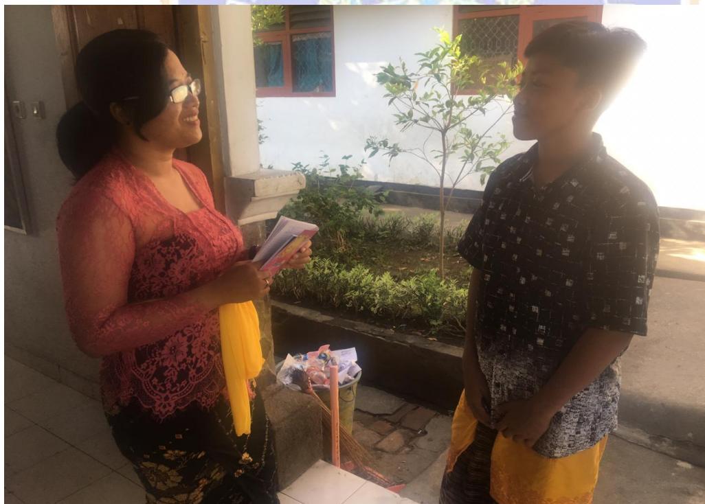
Keterangan kegiatan wawancara siswa kelas VII SMP Negeri 2 Singaraja (data wawancara, 2019)