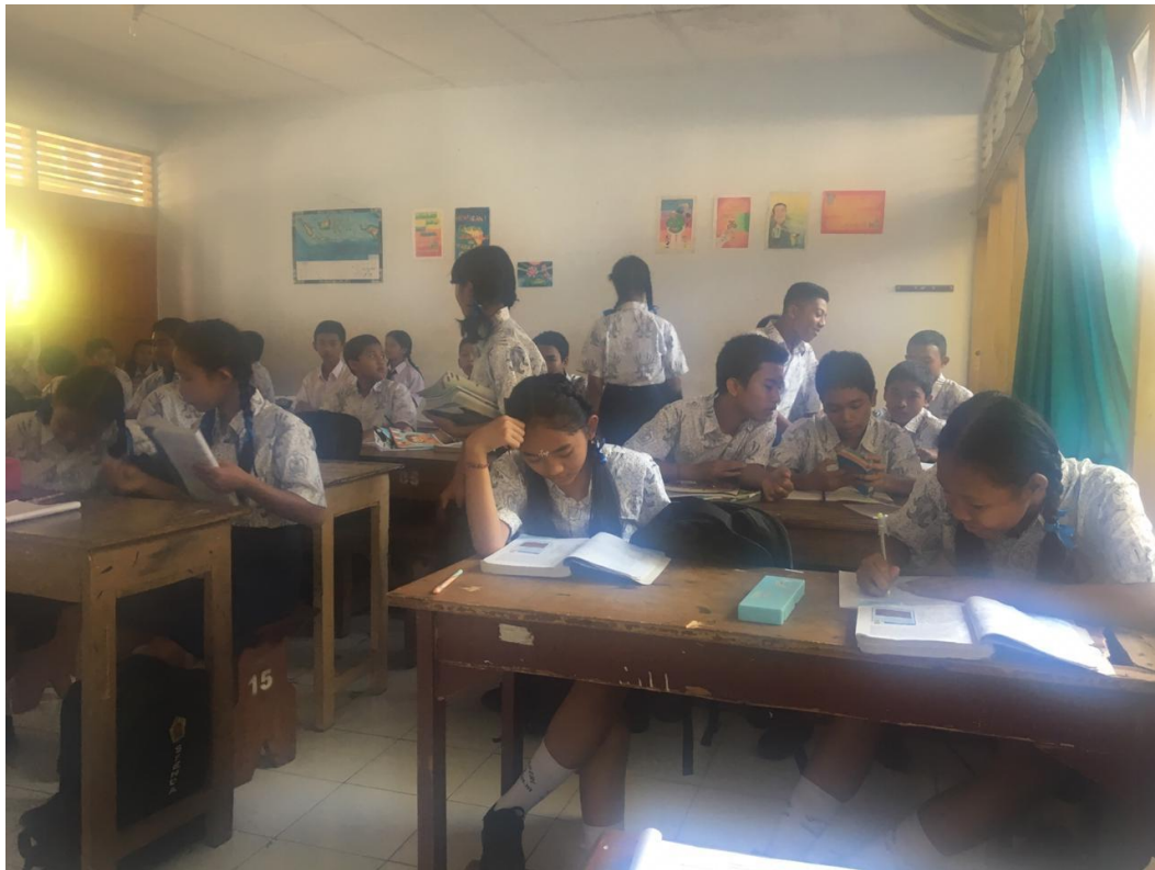
Keterangan belajar mengajar kelas VII SMP Negeri 2 Singaraja