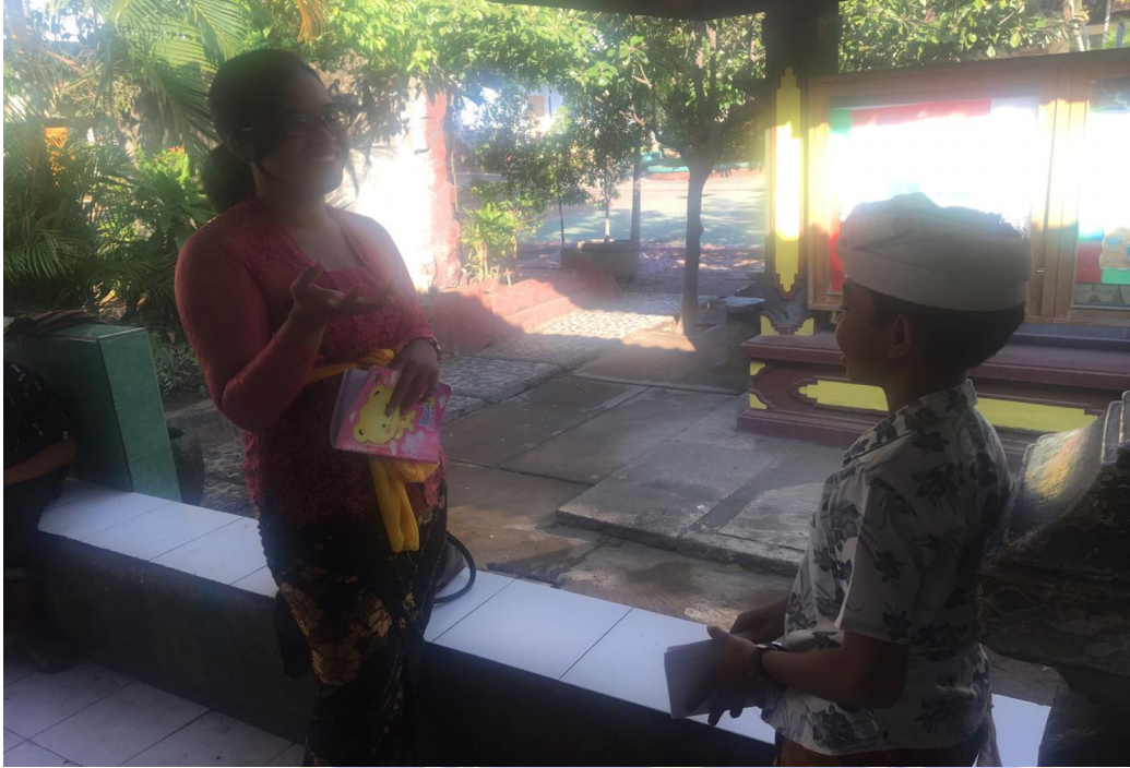
Keterangan kegiatan wawancara siswa kelas VII SMP Negeri 2 Singaraja (data wawancara, 2019)