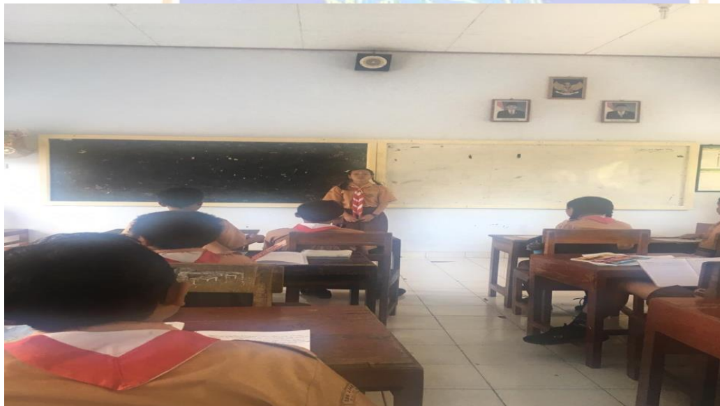
Keterangan kegiatan belajar mengajar siswa kelas VII SMP Negeri 2 Singaraja (data observasi, 2019)