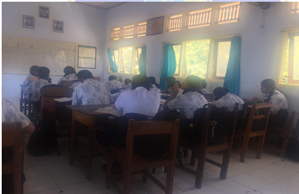
Keterangan belajar mengajar siswa kelas VII SMP Negeri 2 Singaraja