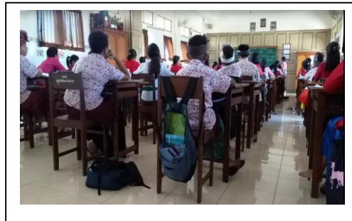
Observation 2 for Teacher 1