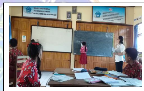
Observation 2 for Teacher 2