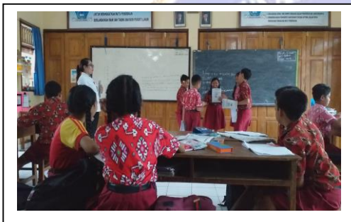
Observation 1 for Teacher 2