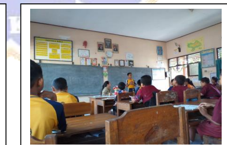
Observation 2 for Teacher 3