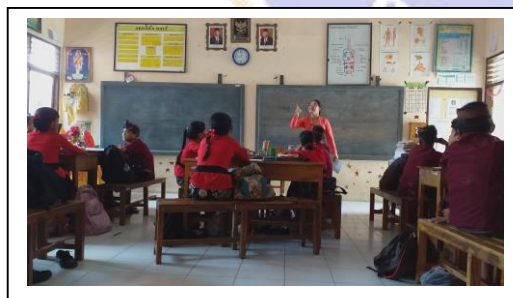
Observation 1 for Teacher 3