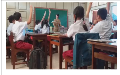
Observation 1 for Teacher 1