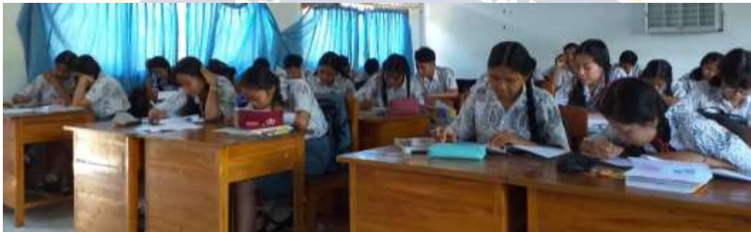
(Pengambilan Data di Kelas XI MIPA 4)