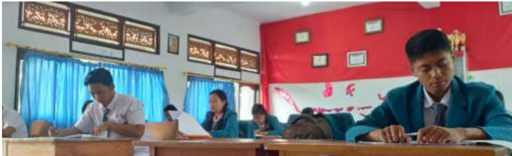
(Pengambilan Data di XI MIPA 3)