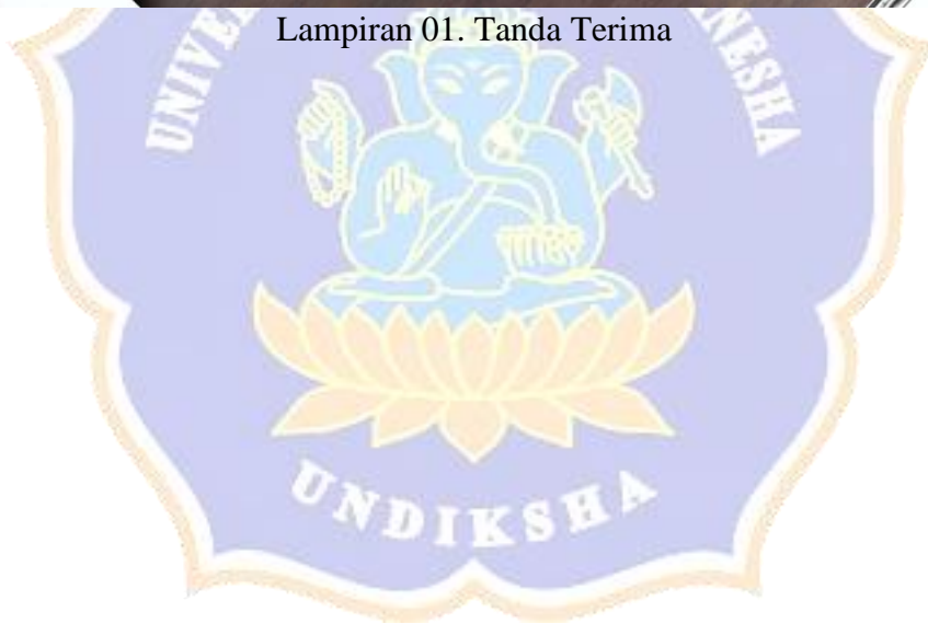
Lampiran 01. Tanda Terima