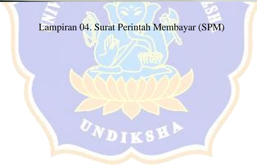
Lampiran 04. Surat Perintah Membayar (SPM)

SPM ini sah apabila ditandatangani dan distempel oleh Ketua Umum KONI Kab. Gianyar