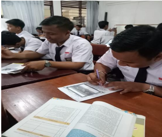
Gambar 7 Siswa membuat teks eksplanasi Siklus II