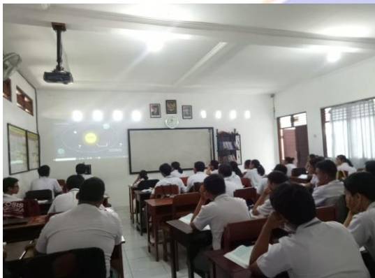
Gambar 3 Siswa menyimak vidio