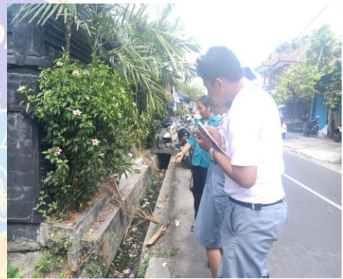
Gambar 4 Siswa dan guru mengamati lingkungan sekitar