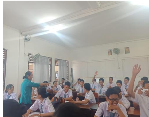
Gambar 2 Siswa antusias menjawab pertanyaan guru