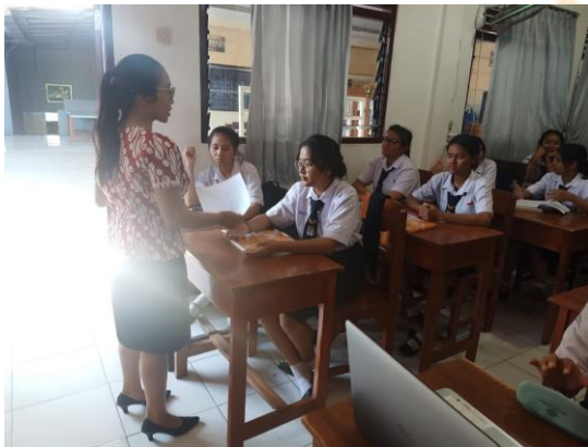
Gambar 9 Peneliti membagikan kuesioner kepada siswa