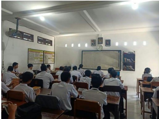
Gambar 1 Siswa menyimak penjelasan guru