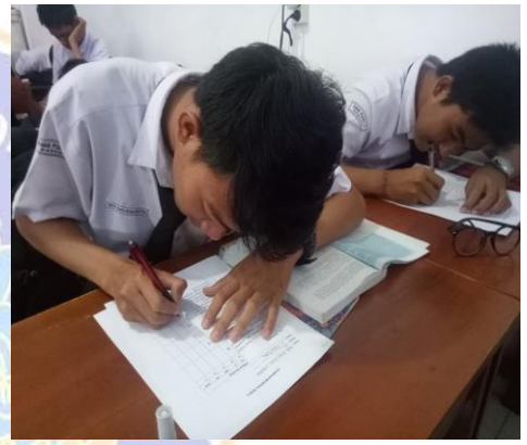
Gambar 10 Siswa mengisi kuesioner (angket)