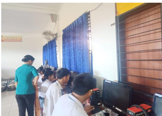
Gambar 5 Siswa mengprint foto hasil pengamatan di luar kelas