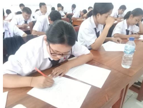
Gambar 6 Siswa membuat teks eksplanasi Siklus I