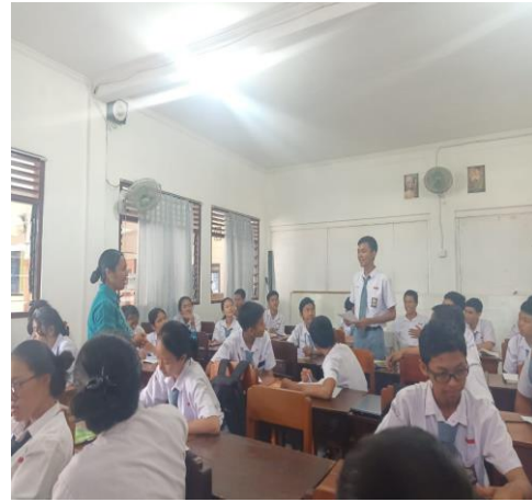
Gambar 8 Menyampaikan apa yang telah dipelajarinya hari itu