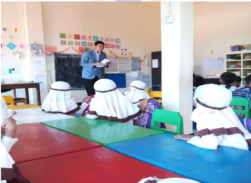
Foto Kegiatan Anak di Kelas Eksperimen