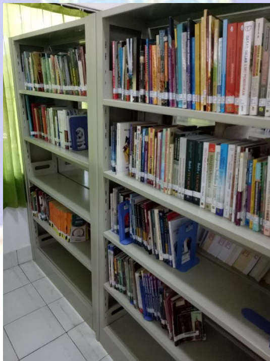
Koleksi buku bersubjek pendidikan