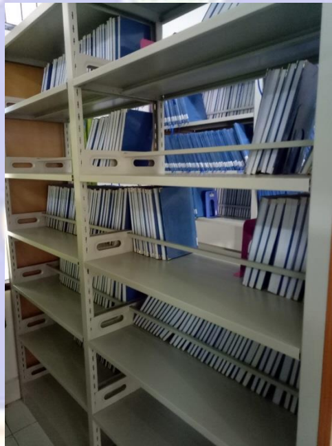
Bagian Rak yang masih kosong