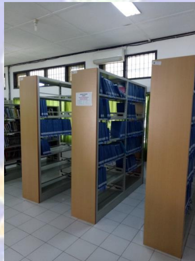
Rak koleksi Skripsi dan Tugas Akhir