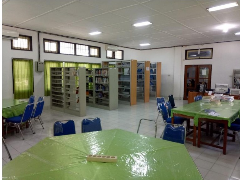
Ruang Baca Perpustakaan FHIS. Tampak pula meja pustakawan