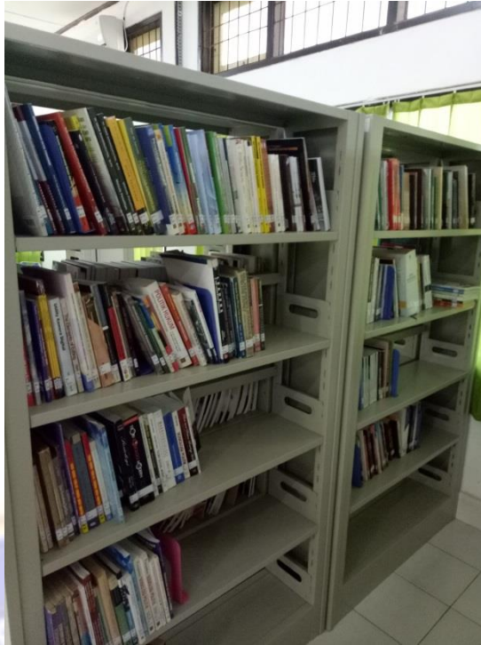
Koleksi Buku-Buku Wajib dan Pengembangan