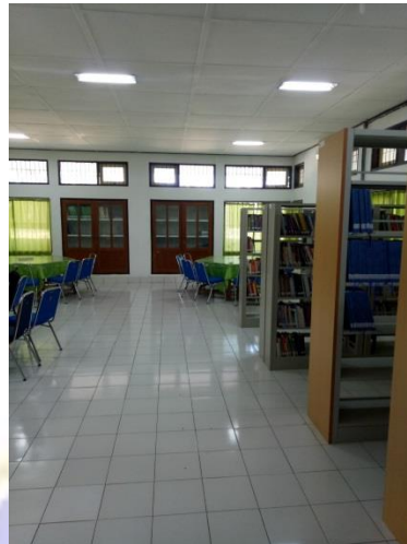
Interior perpustakaan FHIS, dipotret dari pintu utama