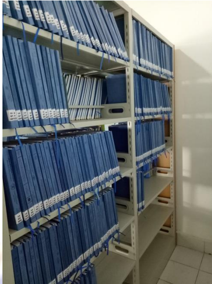
Koleksi Skripsi Mahasiswa Lulusan 2014