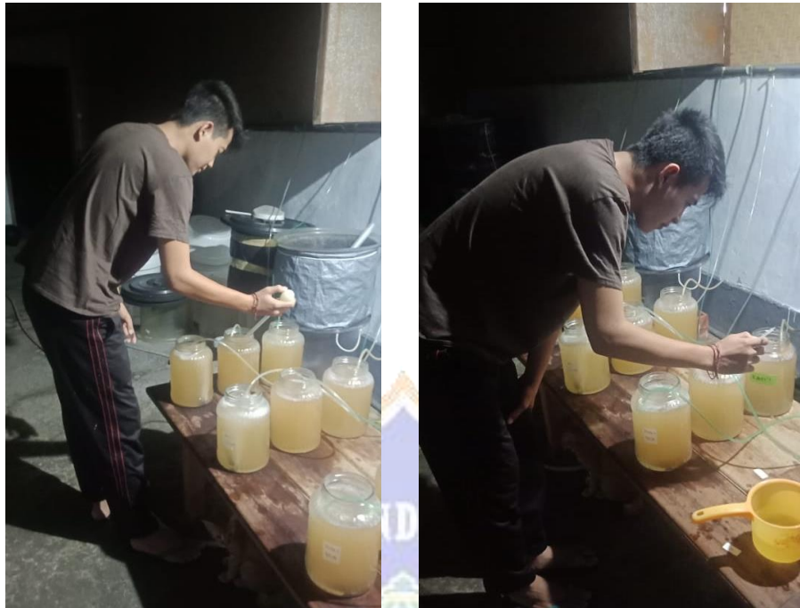
Gambar 11. Proses Pengamatan