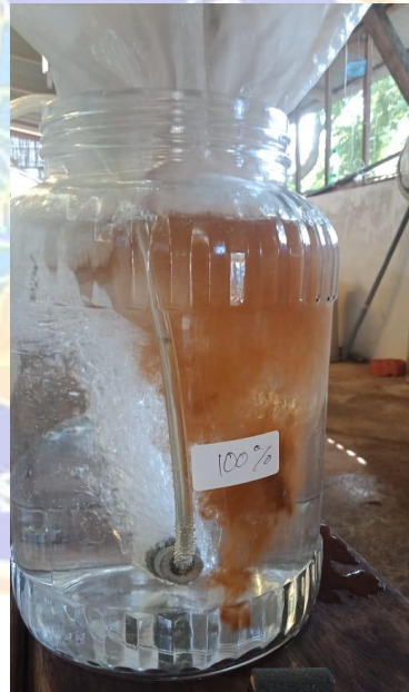
Gambar 10. Proses Kultur