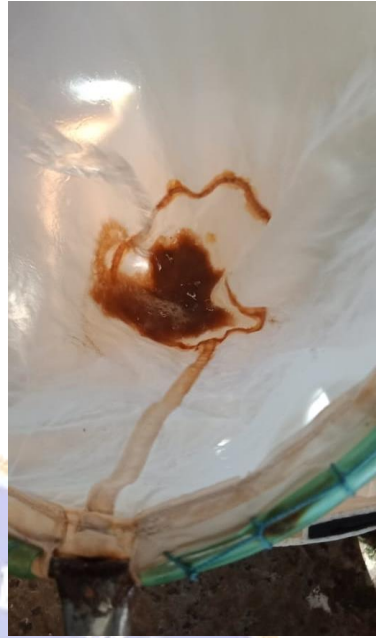
Gambar 9. Proses Penyucian Kista