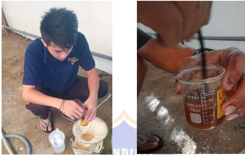
Gambar 5. Proses Dekapsulasi