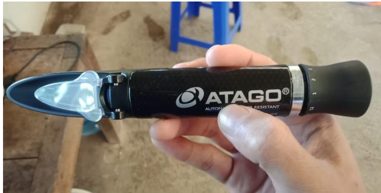
Gambar 7. Alat Pengukur Salinitas