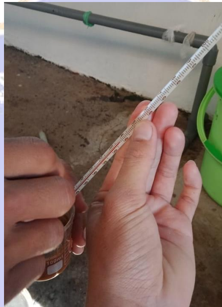
Gambar 8. Alat Pengukur Suhu