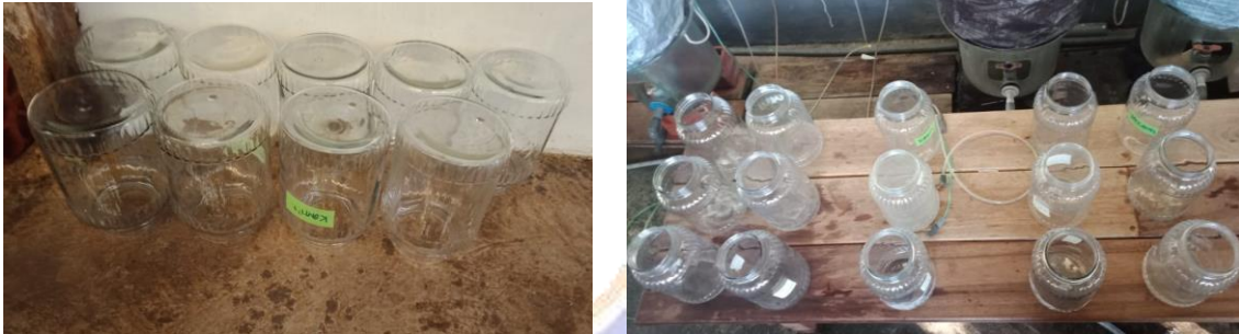
Gambar 1. Wadah Kultur