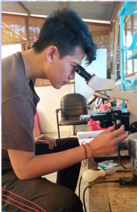
Gambar 12. Pengamatan Artemia