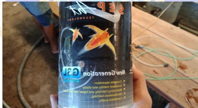
Gambar 3. Artemia