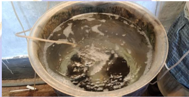
Gambar 2. Wadah air laut yang sudah difilter dan salinitas 28ppt