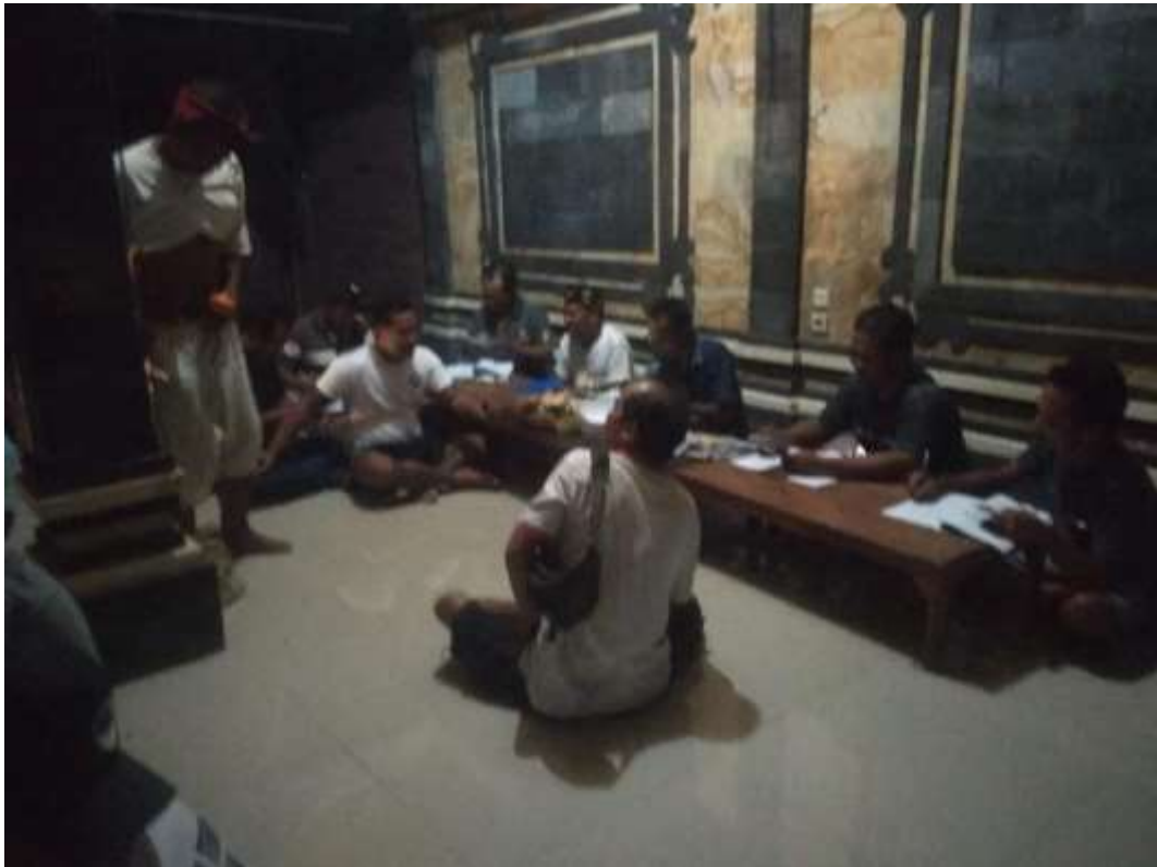
Lampiran 10. Foto saat anggota sekaa suka duka Bharata melakukan sangkepan .