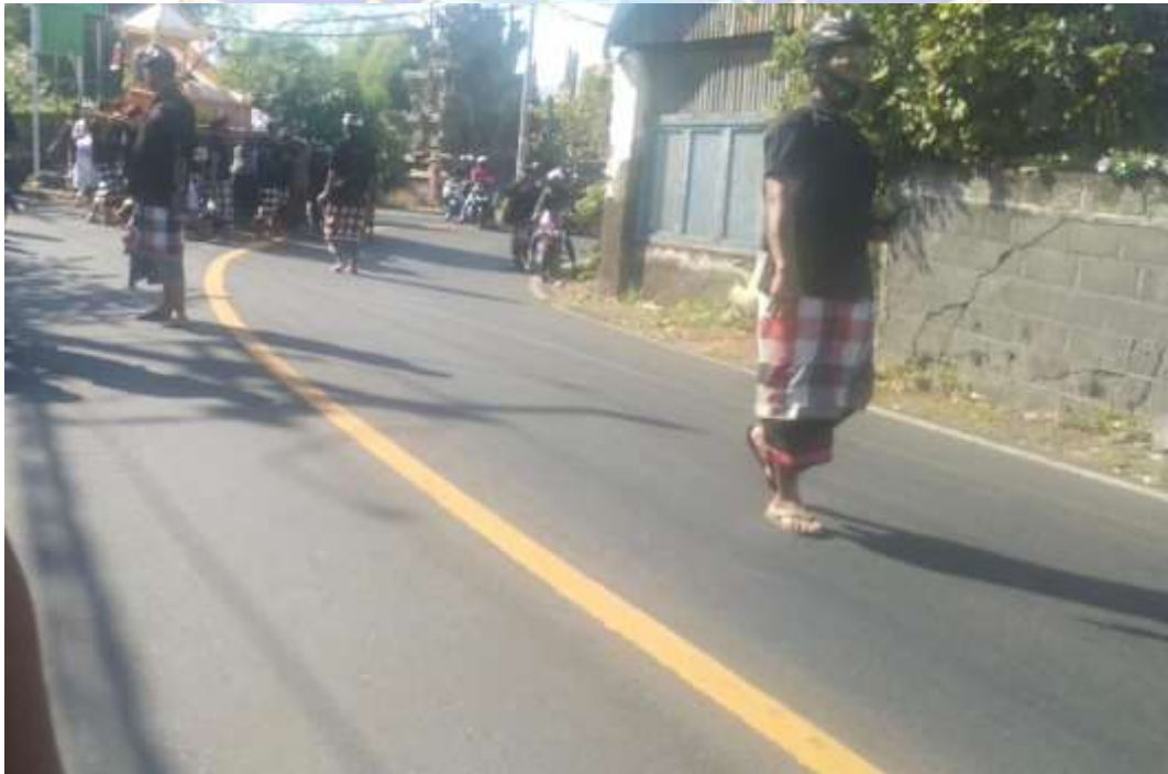
Lampiran 11. Foto Pecalang sekaa suka duka Bharata saat melaksanakan tugas.