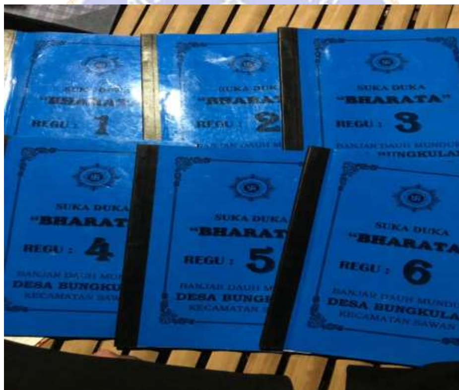
Lampiran 7. Foto buku anggota sekaa suka duka Bharata.