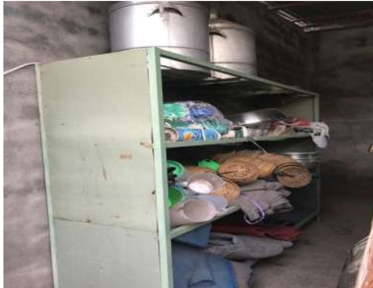
Lampiran 8. Foto alat-alat inventaris sekaa suka duka Bharata.