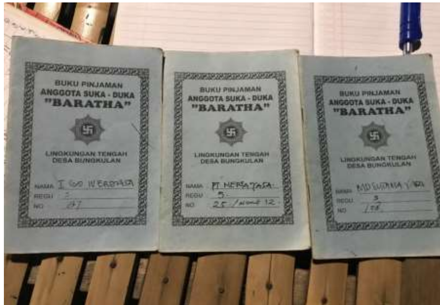
Lampiran 6. Foto buku tabungan anggota sekaa suka duka Bharata