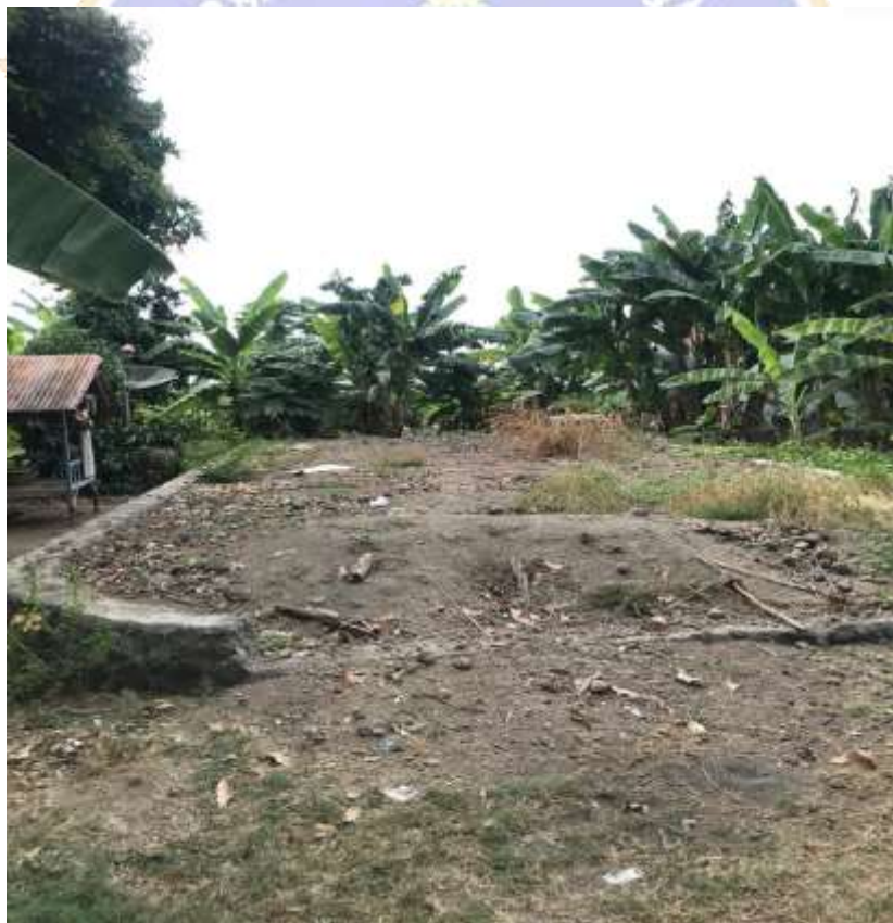
Lampiran 9. Tanah milik sekaa suka duka Bharata