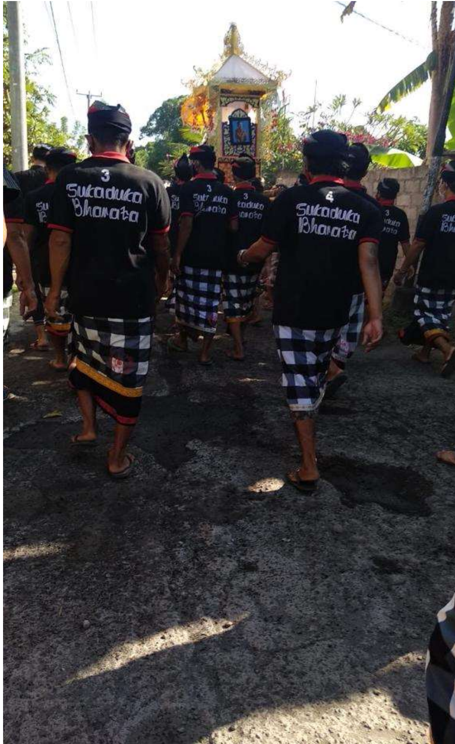
Lampiran 12. Foto kegiatan anggota sekaa suka duka Bharata saat ada anggota yang meninggal.