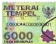
I Putu Aryasa

Singaraja, 06 Agustus 2020 Yang membuat pernyataan