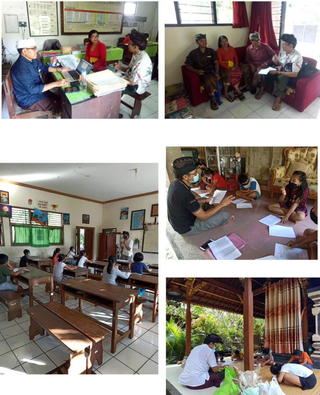
Gambar 3. Dokumentasi Kegiatan Penelitian, Koordinasi dan Posttest