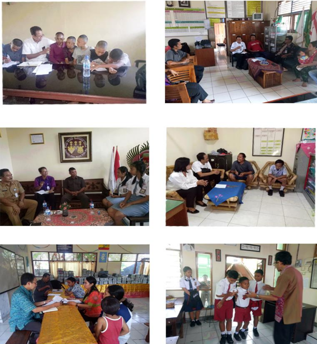
Gambar 1. Beberapa Pemantauan dan Pendampingan Kasus Kekerasan terhadap Anak