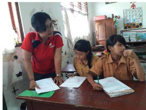
Gambar 2. Dokumentasi Kegiatan Penelitian, Koordinasi dan Pretest