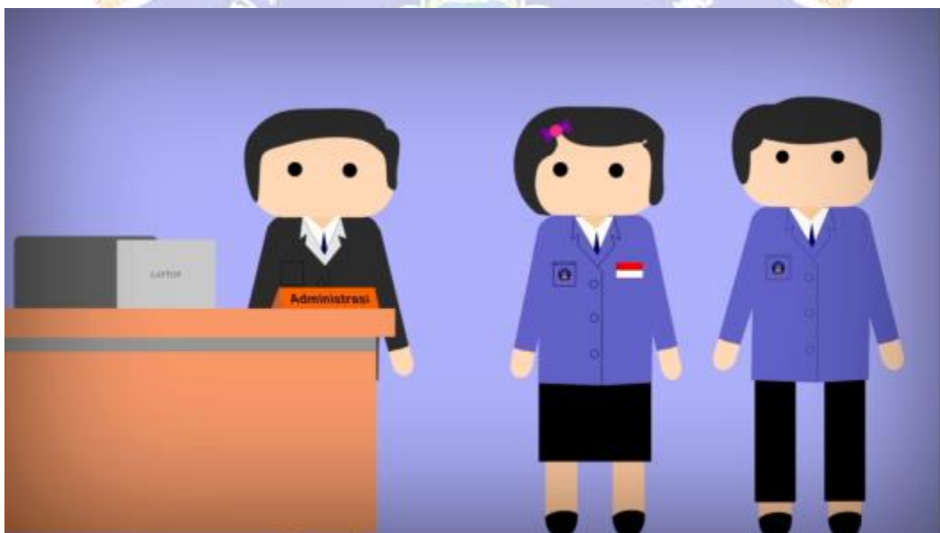
Gambar 8. Menampilkan Mahasiswa Membuat Janji Konseling