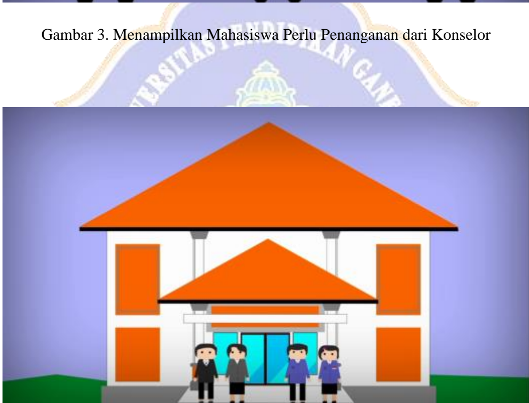
Gambar 4. Menampilkan Mahasiswa Sedang Berada di Gedung UPTBK