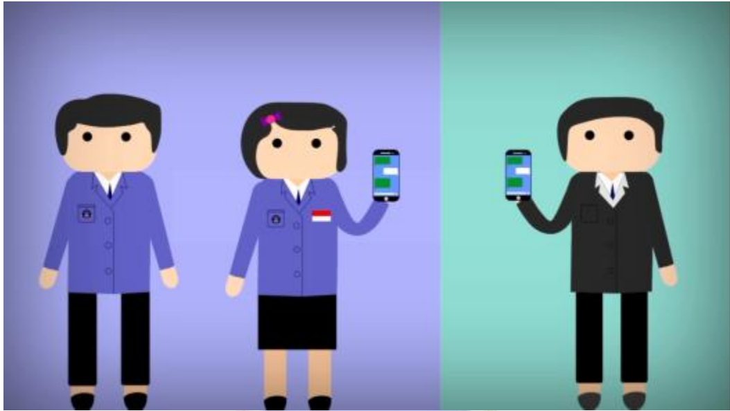
Gambar 5. Menampilkan Tutor Sebaya Menghubungi Bagian Administrasi UPTBK