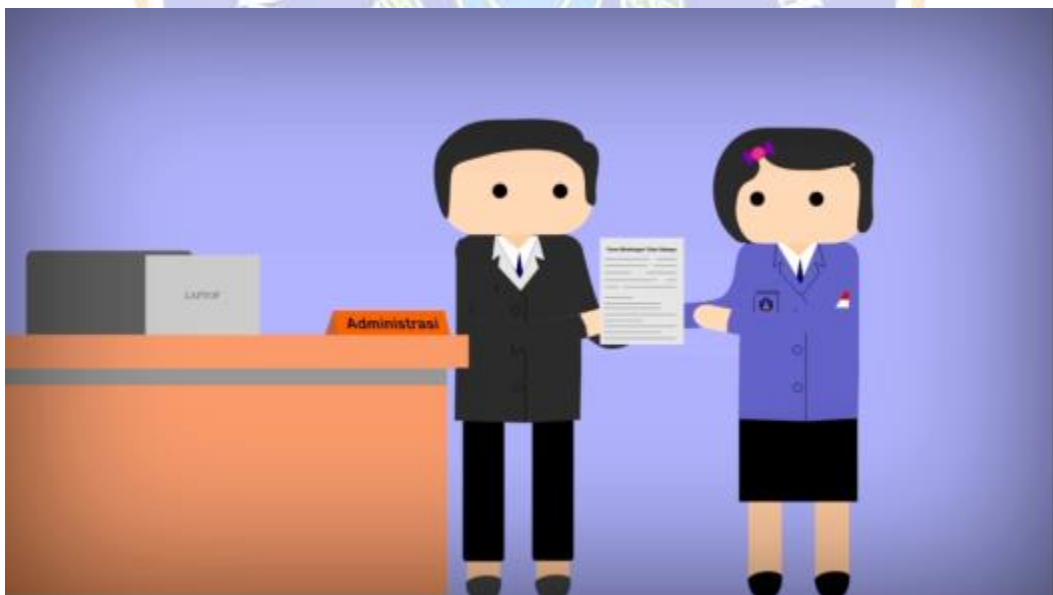
Gambar 6. Menampilkan Tutor Sebaya Menyerahkan Form Riwayat Kasus