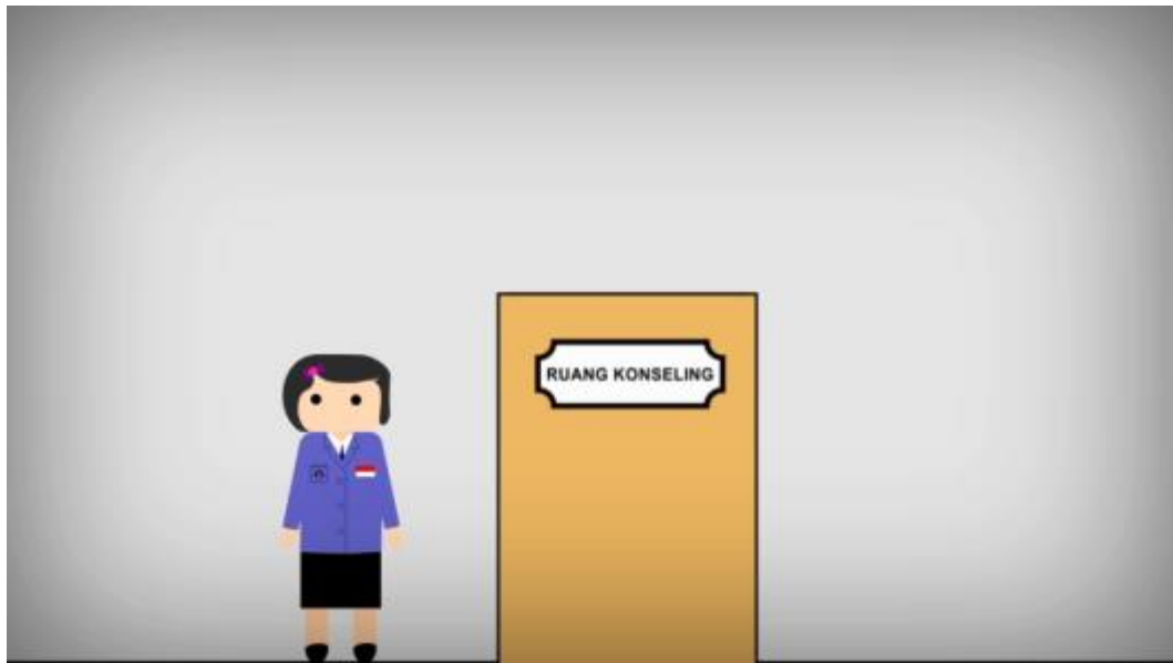
Gambar 9. Menampilkan Proses Konseling