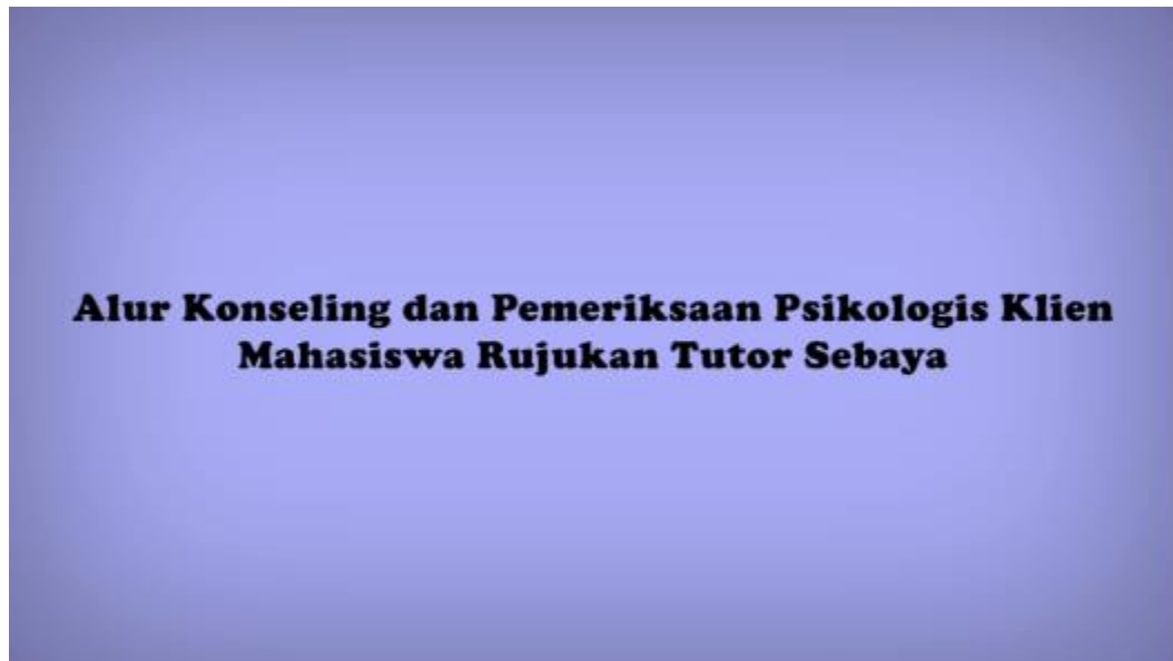
Gambarr 1. Tampilan Pembuka