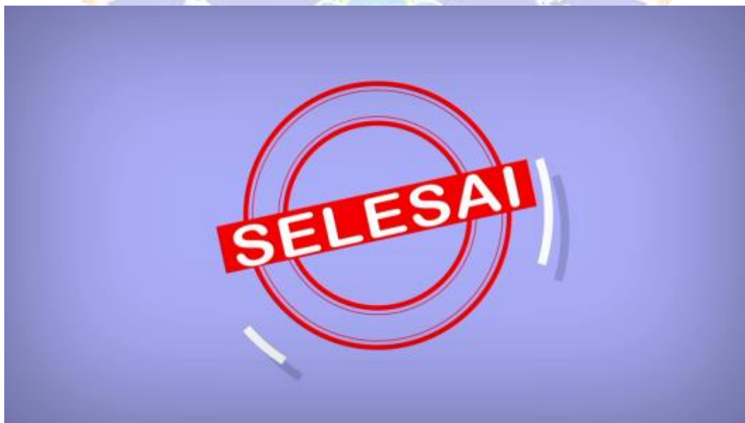
Gambar 10. Menampilkan Penutup