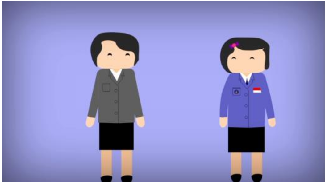
Gambar 7. Menampilkan Tutor Sebaya Bertemu Dengan Konselor