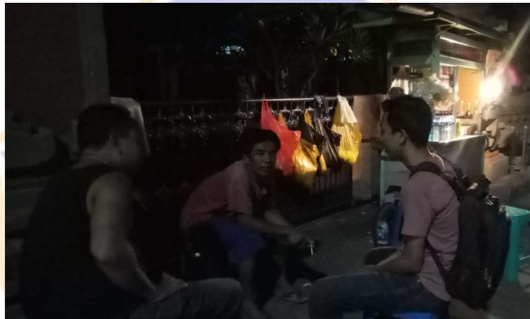
Gambar Wawancara dengan salah satu PKL di Jalan Ngurah Rai