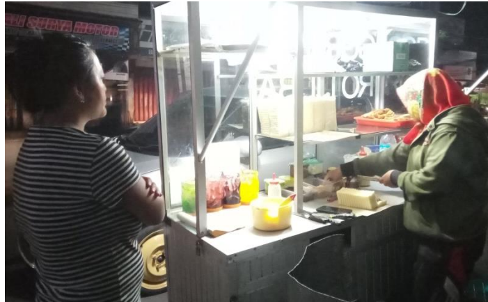
Gambar Penjual Roti Bakar Di Jalan A. Yani, Sedang Melayani Pelanggan