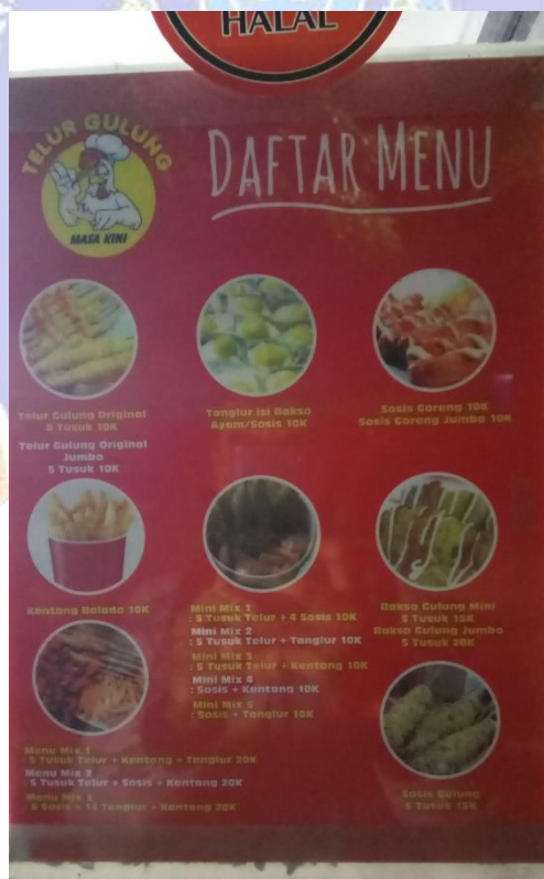
Gambar Daftar Menu salah satu PKL yang memiliki strategi menarik pelanggan dengan variasi menu olahan