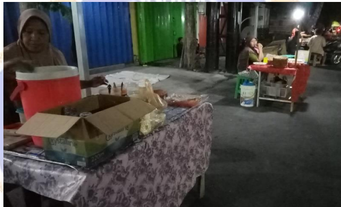
Gambar Jarak PKL satu dengan yang lainnya di Jalan A. Yani