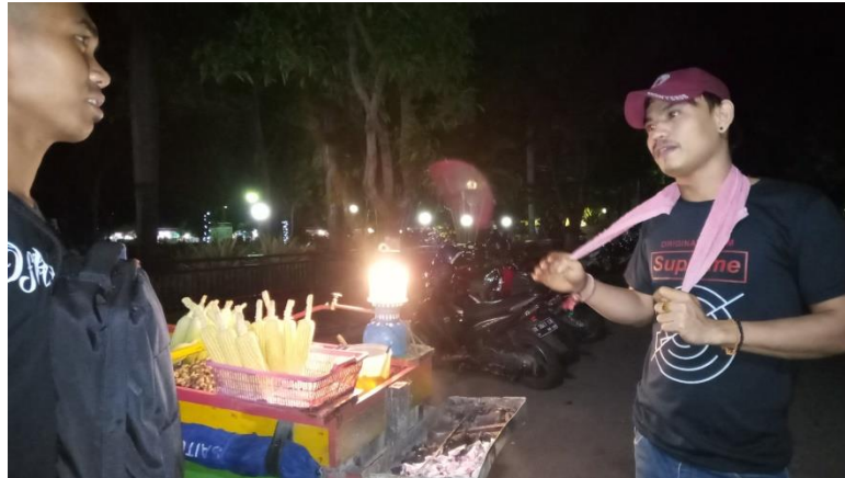
Gambar PKL di Jalan Ngurah Rai yang sedang berbincang