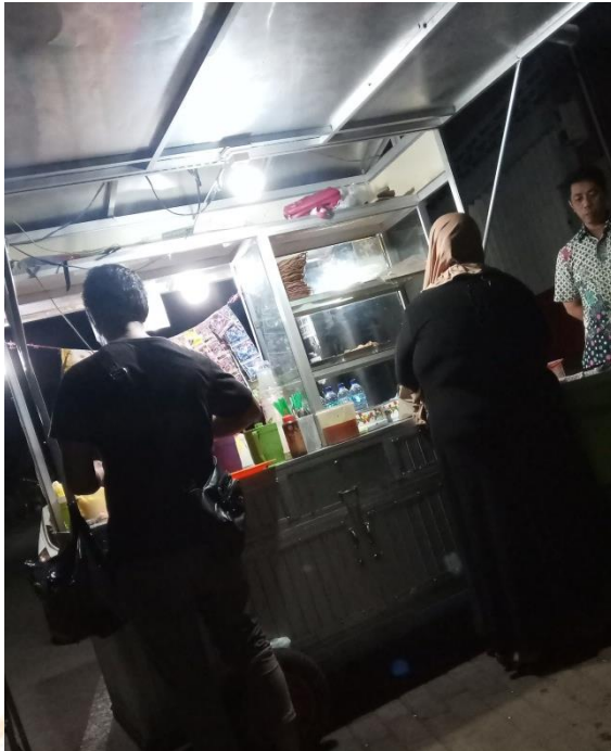
Gambar PKL di Jalan Diponegoro sedang melayani pelanggan