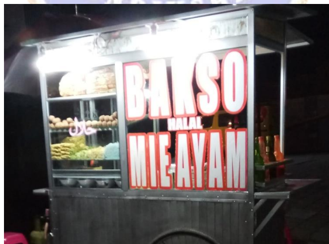
Gambar Rombong Bakso di Jalan Gajah Mada