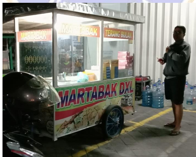
Gambar PKL dekat kedai waralaba di Jalan Surapati