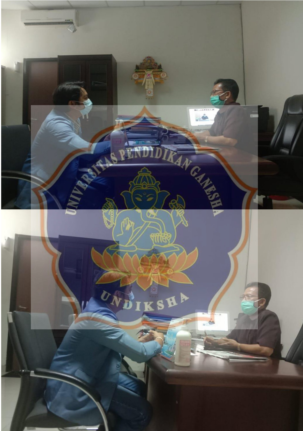
FOTO DOKUMENTASI PENELITIAN