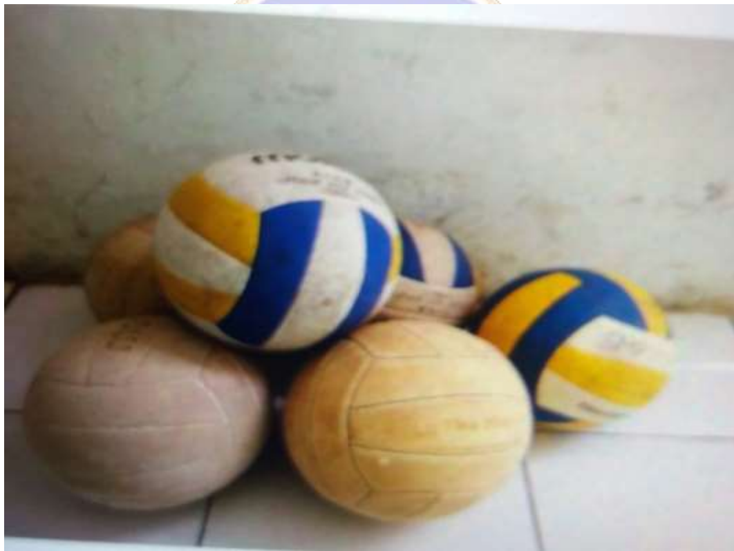
Lampiran 13 Sarana dan Prasarana SMP Mutiara Singaraja