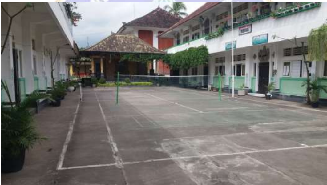
Lampiran 9 Sarana dan Prasarana SMPN 6 Singaraja