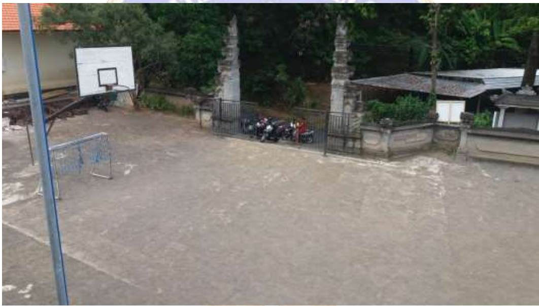
Lampiran 10 Sarana dan Prasarana SMPN 7 Singaraja