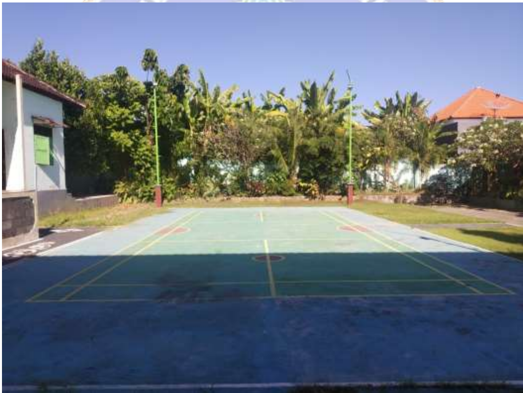
Lampiran 8 Sarana dan Prasarana SMPN 4 Singaraja