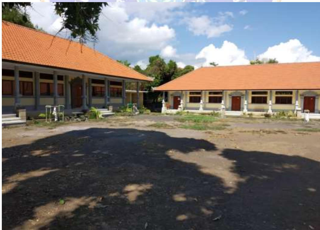
Lampiran 11 Sarana dan Prasarana SMPN 8 Singaraja