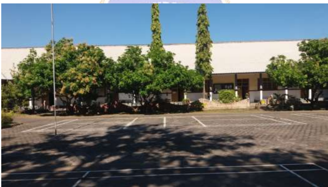
Lampiran 14 Sarana dan Prasarana SMP Santo Paulus Singaraja