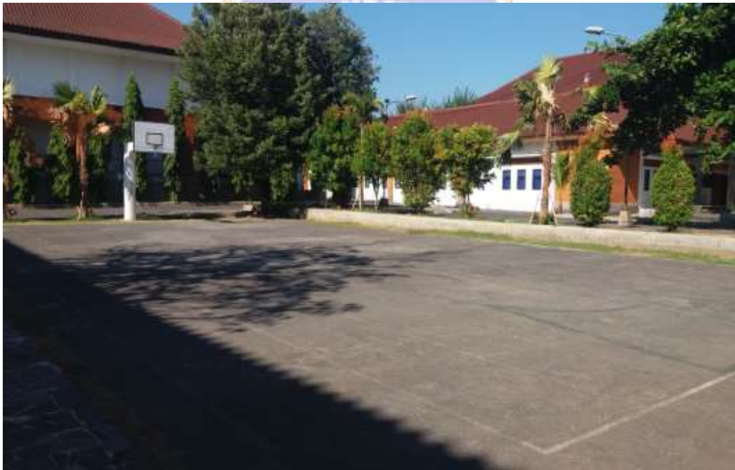
Lampiran 12 Sarana dan Prasarana SMP Lab Undiksha Singaraja