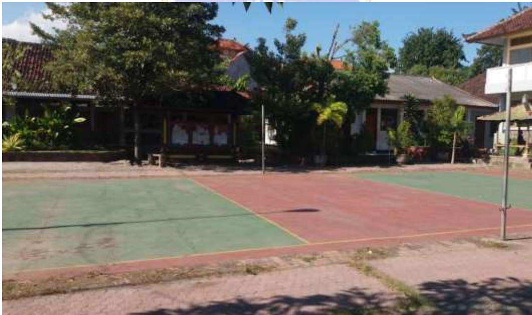
Lampiran 6 Sarana dan Prasarana SMPN 2 Singaraja