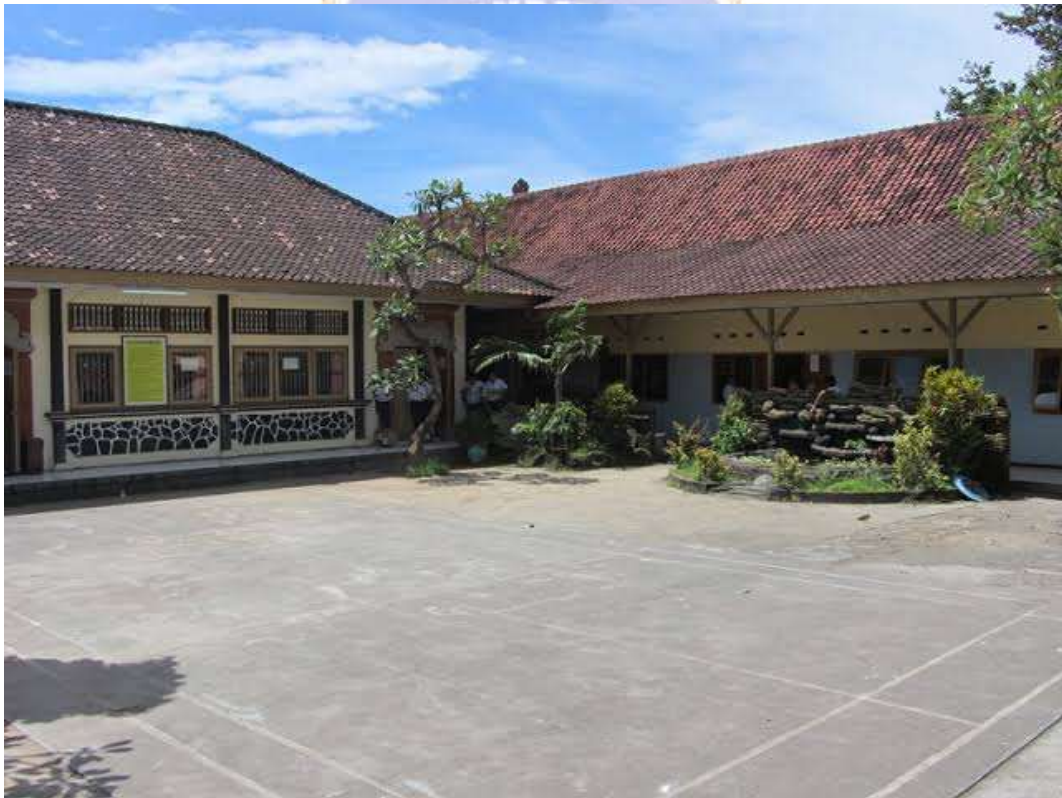
Lampiran 7 Sarana dan Prasarana SMPN 3 Singaraja