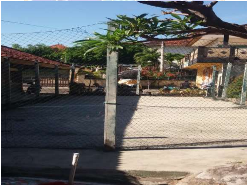
Lampiran 15 Sarana dan Prasarana SMP Saraswati Singaraja