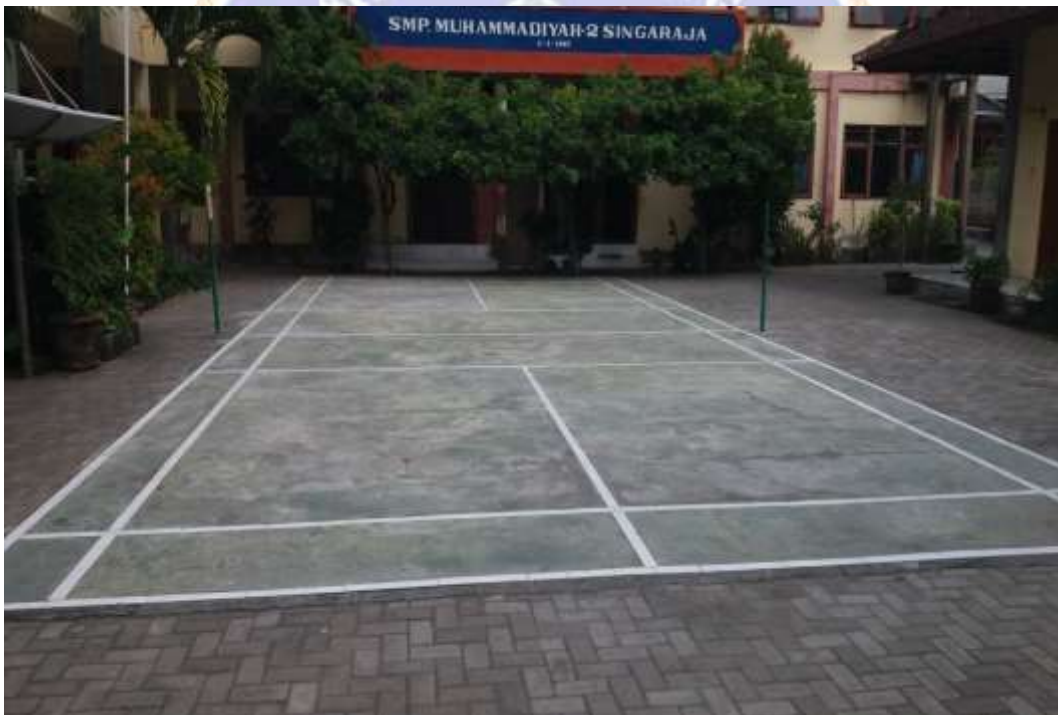
Lampiran 5 Sarana dan Prasarana SMP Muhammadiyah 2