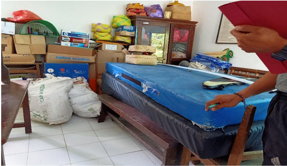
Gambar 12. matras di SD 6 Peninjoan