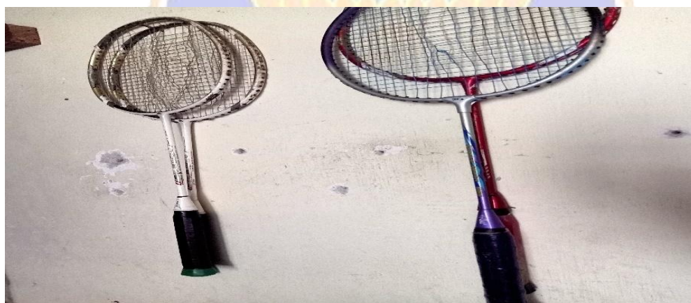
Gambar 07. Raket Bulu Tangkis