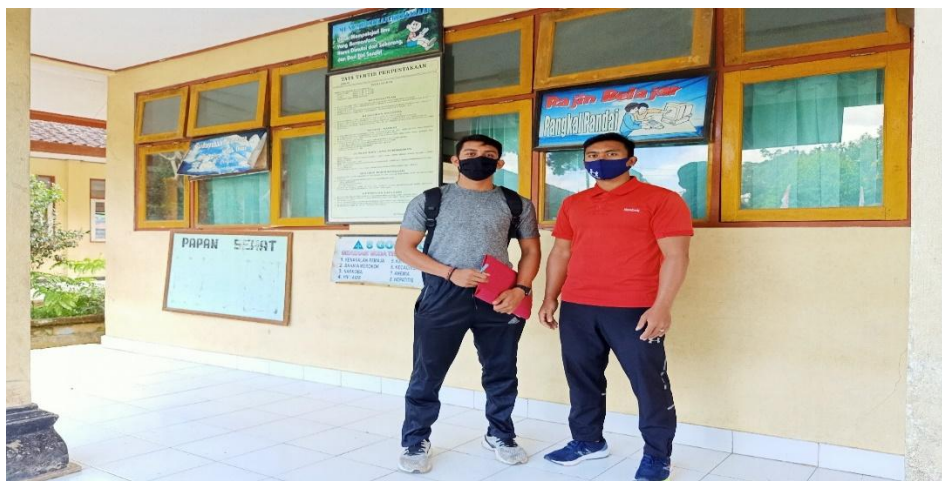
Gambar 14. dokumentasi dengan guru PJOK SD 6 peninjoan