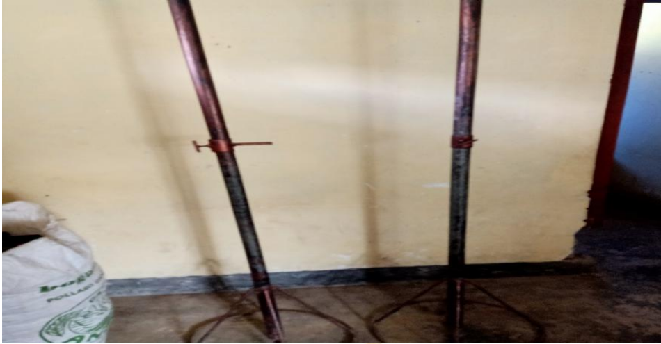
Gambar 10. Tiang Lompat Tinggi di SD 5 Jhem