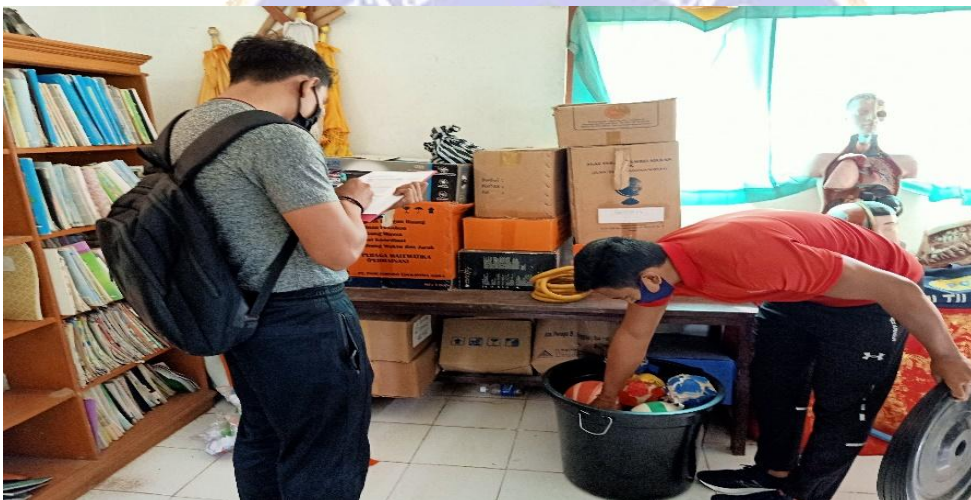
Gambar 11. Bola sepak di SD 6 Peninjoan