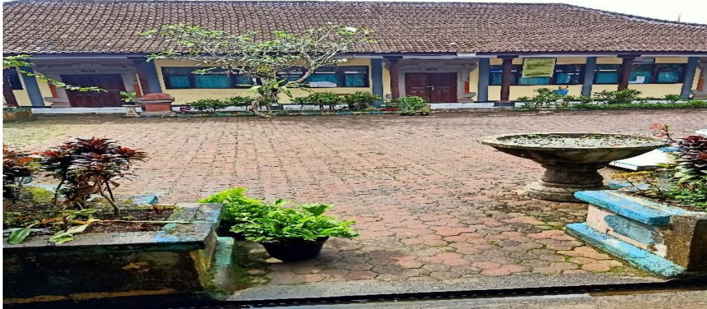
Gambar 01. Halaman sekolah SD 1 Tembuku