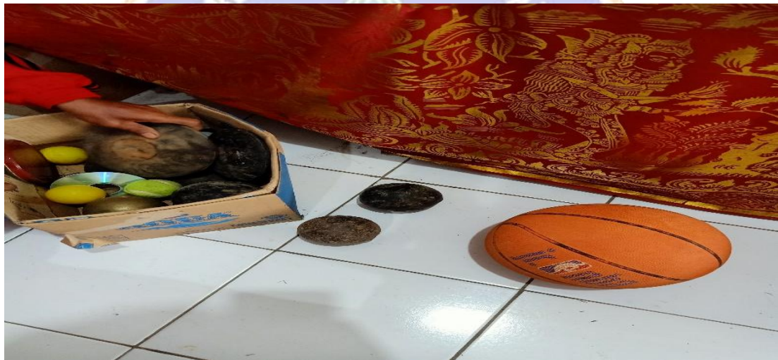
Gambar 02. Bola Basket