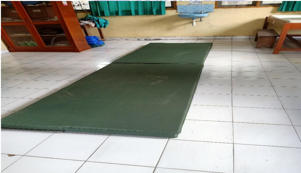
Gambar 04. Matras