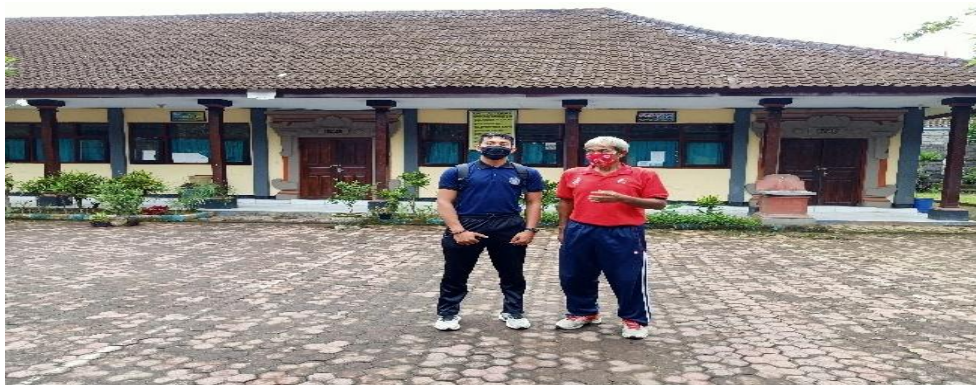
Gambar 05. dokumentasi dengan guru PJOK SD 1 Tembuku