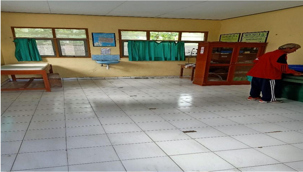
Gambar 03. Ruang Senam