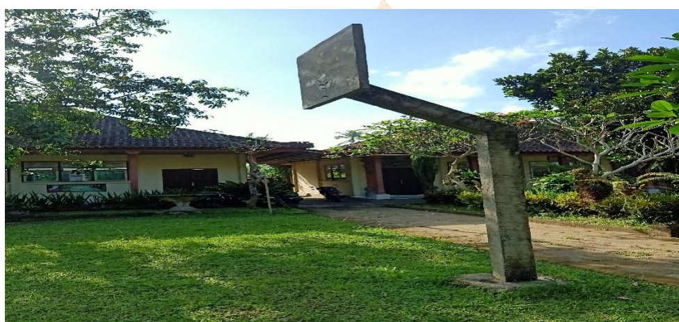
Gambar 06. Lapangan basket SD 5 Jhem