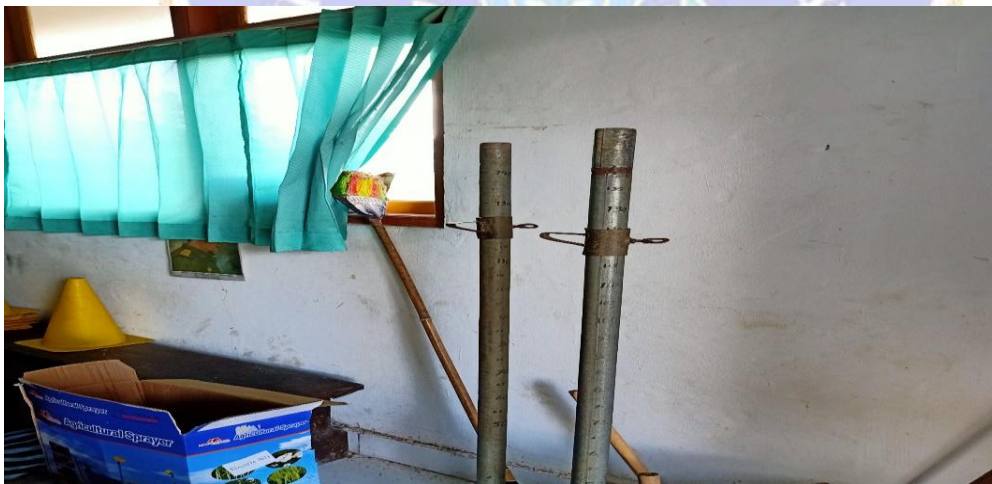
Gambar 13. tiang lompat tinggi di SD 6 Peninjoan