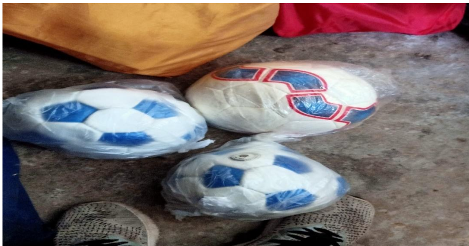
Gambar 08. Bola Sepak SD 5 Jehem