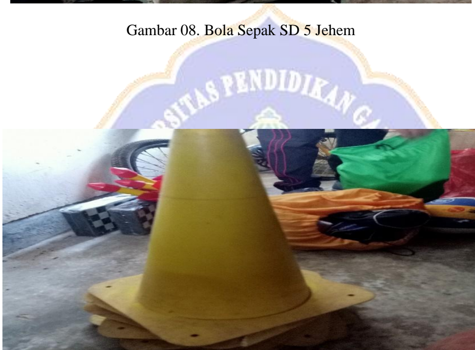
Gambar 09. Cune yang ada di Gudang SD 5 Jehem