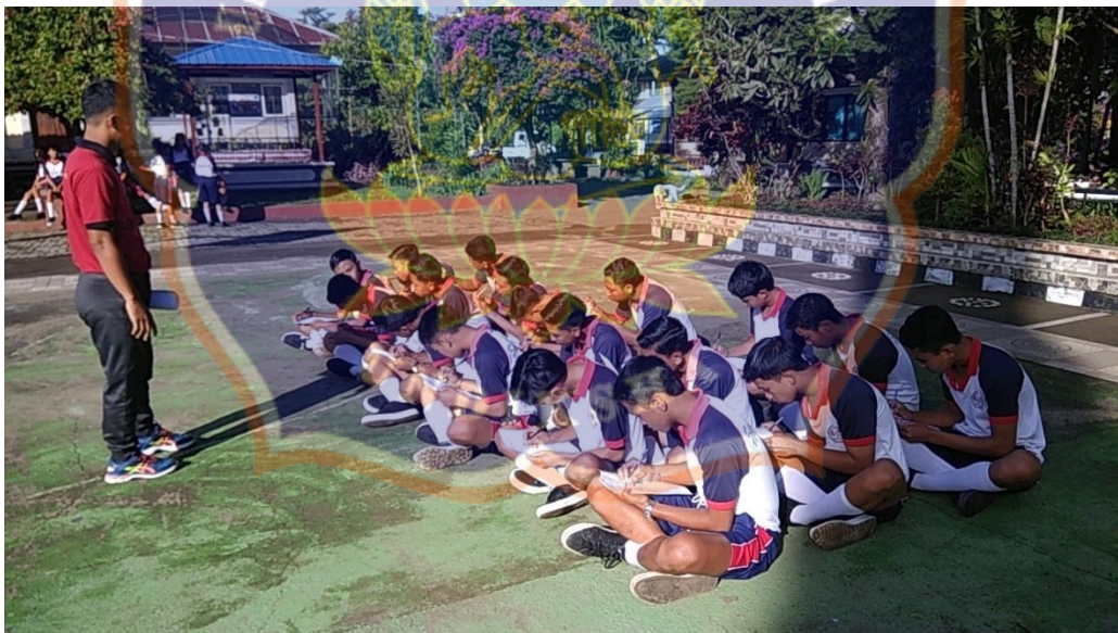
(Keterangan: pengisian angket minat dan motivasi berprestasi siswa terhadap kegiatan ekstrakurikuler bolavoli)