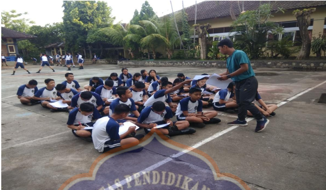
(Keterangan: pengisian angket minat dan motivasi berprestasi siswa terhadap kegiatan ekstrakurikuler bolavoli)