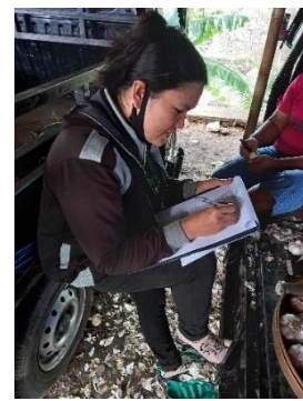
Dokumentasi Penyebaran Kuesioner Penelitian Pada Pedagang Bongkar Muat Bermobil di Pasar Banyuasri Kabupaten Buleleng