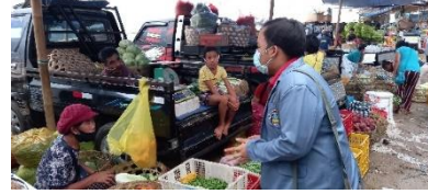
Dokumentasi Observasi Awal ke Pedagang Bongkar Muat Bermobil di Pasar Banyuasri Kabupaten Buleleng