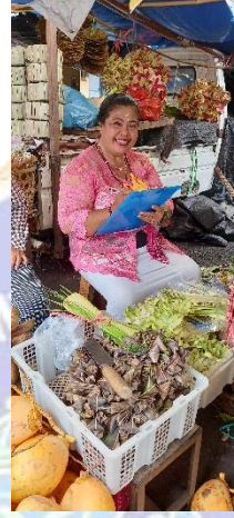
Dokumentasi Penyebaran Kuesioner Penelitian Pada Sampel Kecil di Pasar Anyar Kabupaten Buleleng