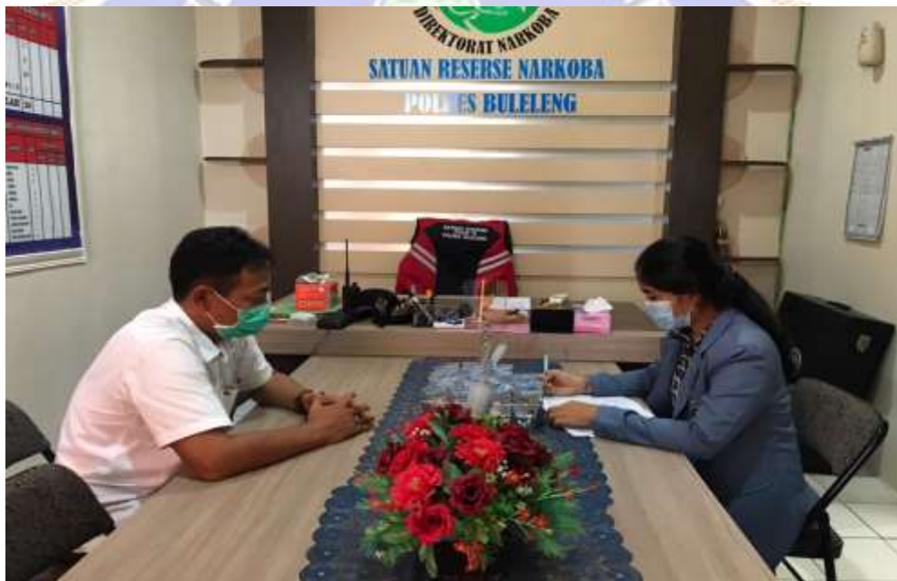
FOTO WAWANCARA DENGAN NARASUMBER II