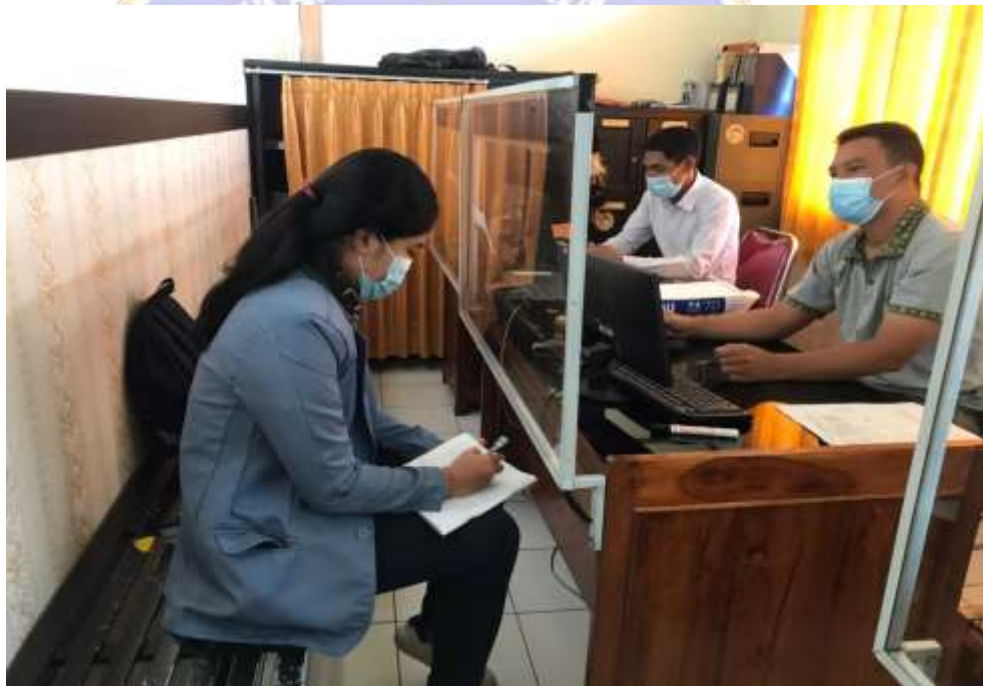
FOTO WAWANCARA DENGAN NARASUMBER IV