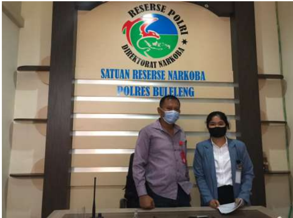
FOTO SETELAH WAWANCARA DENGAN NARASUMBER I