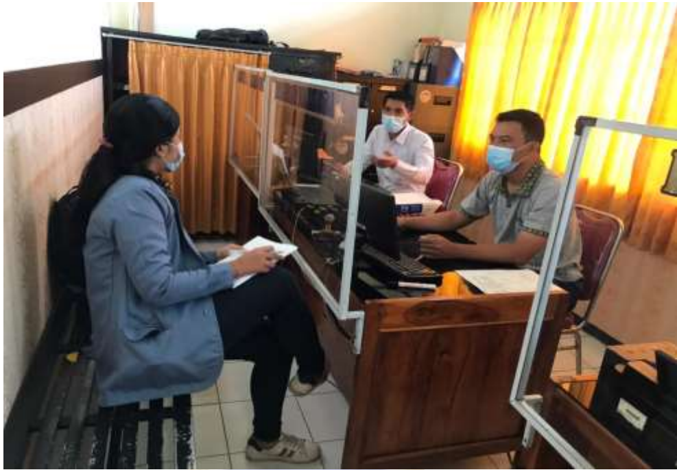
FOTO DENGAN NARASUMBER III