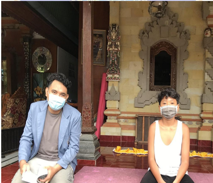
FOTO WAWACARA DENGAN RESPONDEN II