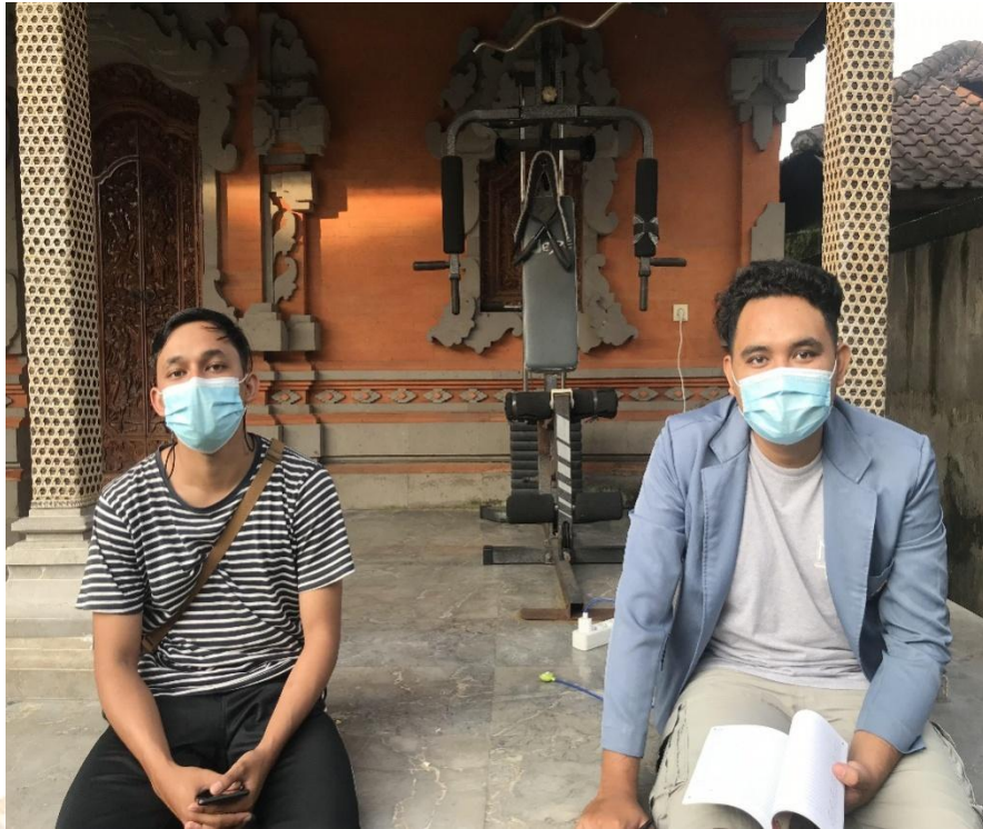
FOTO WAWACARA DENGAN RESPONDEN I