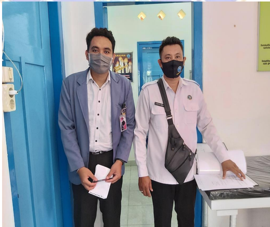
FOTO WAWANCARA DENGAN NARASUMBER II