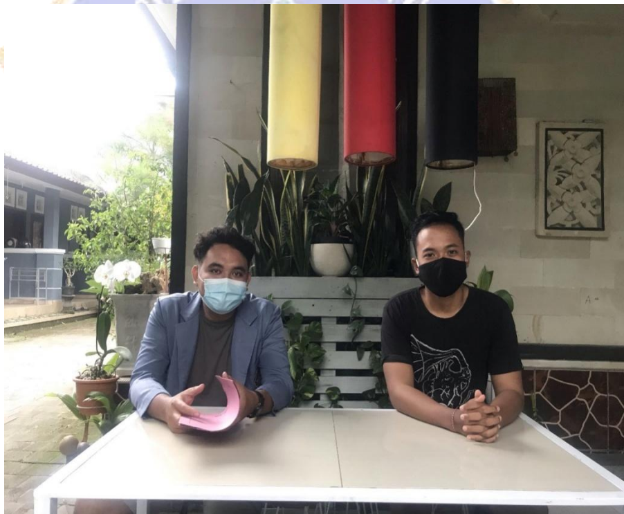
FOTO WAWACARA DENGAN RESPONDEN IV