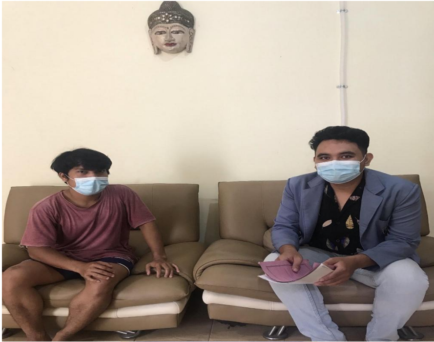
FOTO WAWACARA DENGAN RESPONDEN III