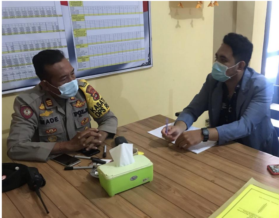
FOTO WAWANCARA DENGAN NARASUMBER I