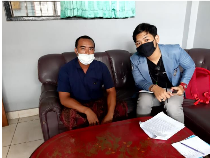
FOTO WAWANCARA DENGAN RESPONDEN V