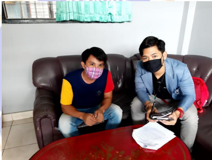
FOTO WAWANCARA DENGAN RESPONDEN VI