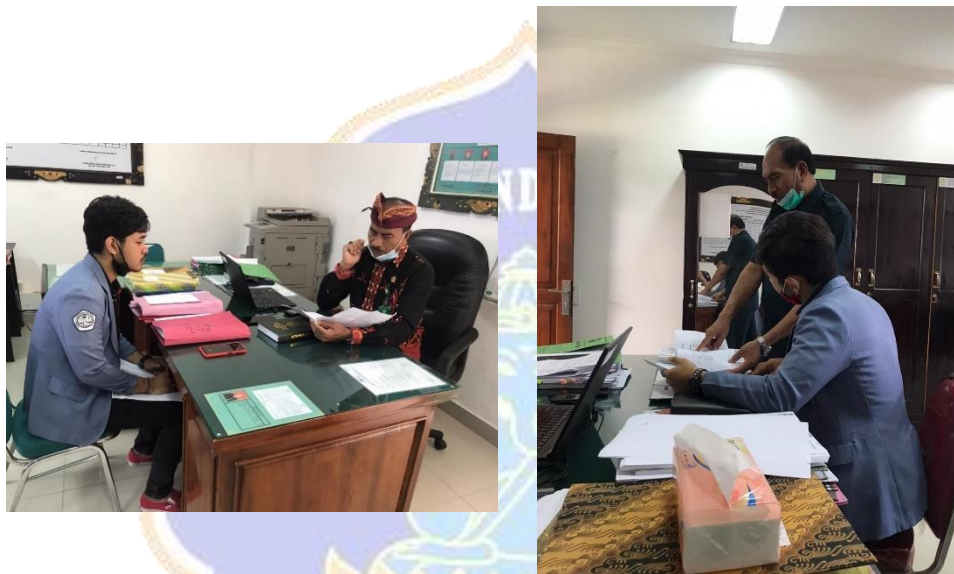
FOTO WAWANCARA DENGAN NARASUMBER II