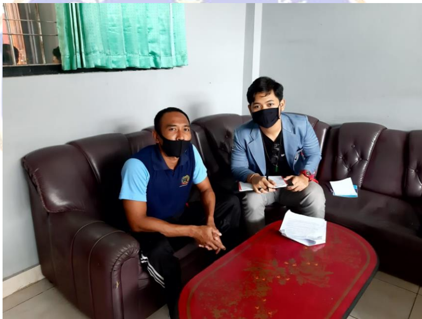
FOTO WAWANCARA DENGAN RESPONDEN II