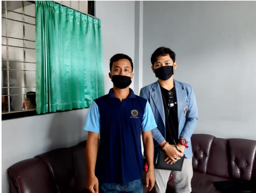
FOTO WAWACARA DENGAN RESPONDEN I