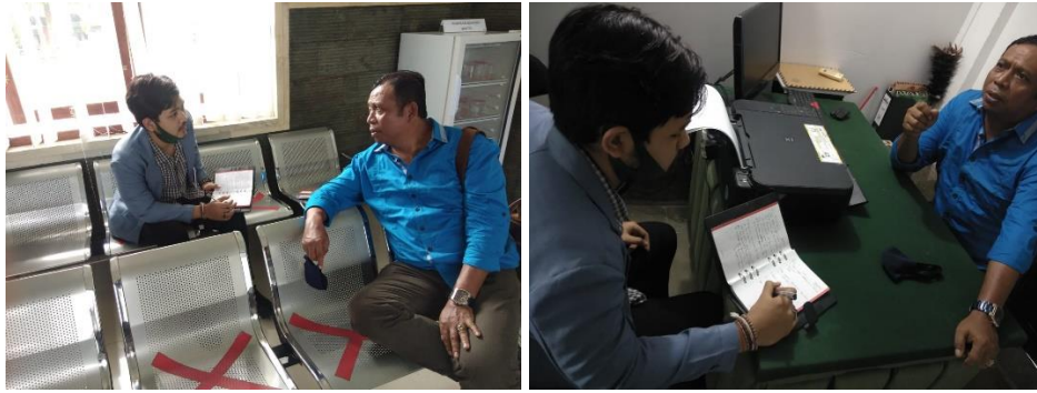
FOTO WAWANCARA DENGAN NARASUMBER I