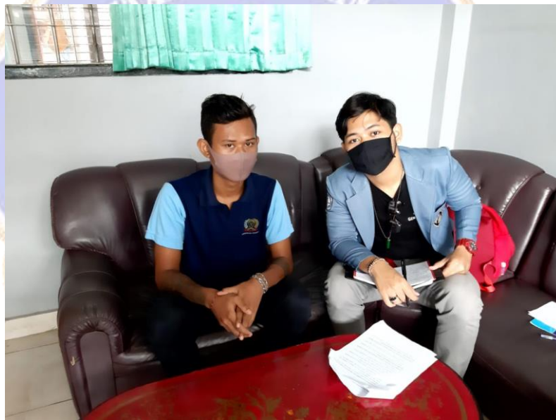
FOTO WAWACARA DENGAN RESPONDEN IV