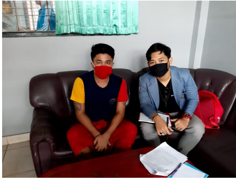
FOTO WAWACARA DENGAN RESPONDEN III