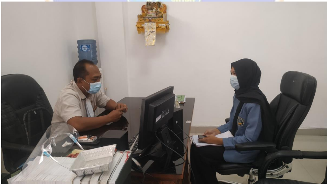
WAWANCARA DENGAN NARASUBER DAN INFORMAN II