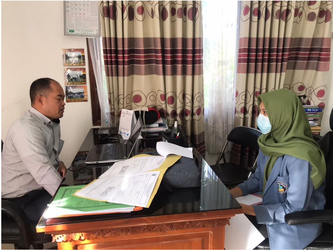
WAWANCARA DENGAN NARASUMBER DAN INFORMAN I