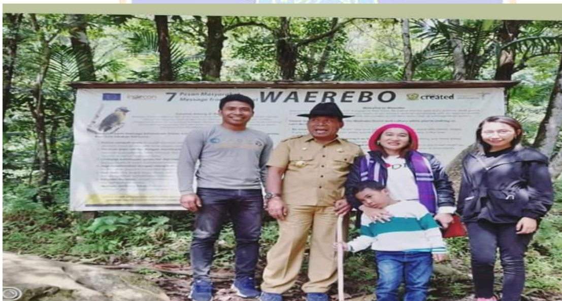
Gambar 10. Bapa bupati Kabupaten Manggarai mengunjungi Kampung Wae Rebo sebagai tempat pariwisata budaya untuk sosialisasi pelestarian permukiman tradisional.