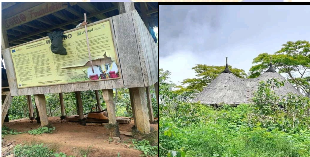
Gambar 03. Permukiman tradisional persinggahan sementara atau post kedua sebelum masuk Mbaru Niang