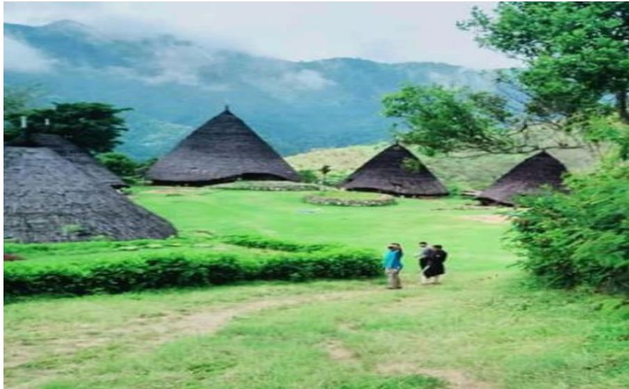
Gambar 05. Jalan utama masuk permukiman tradisional Kampung Wae Rebo