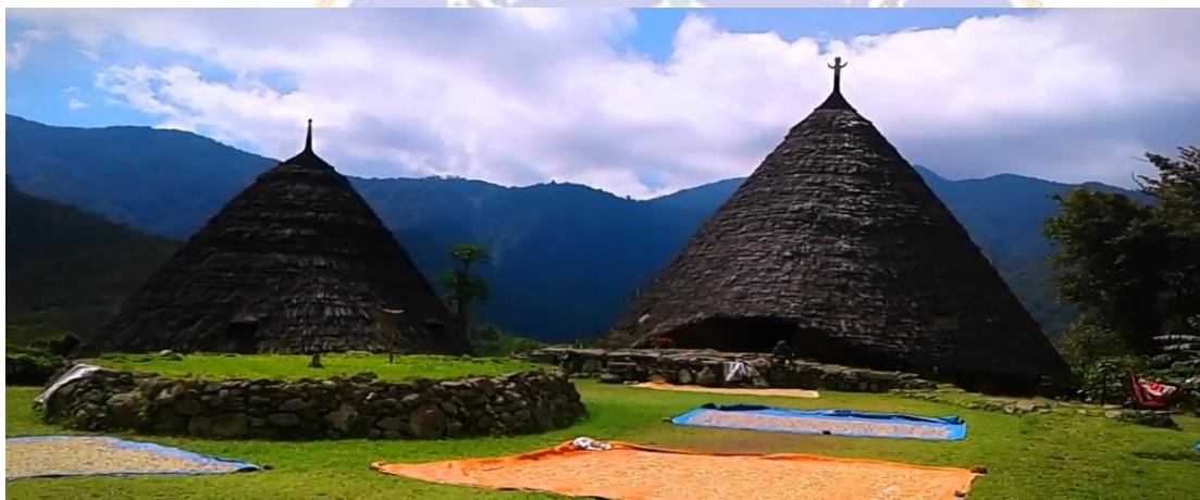
Gambar 06. Compang didepan Mbaru Niang Gendang dan Mbaru Niang Gena Maro