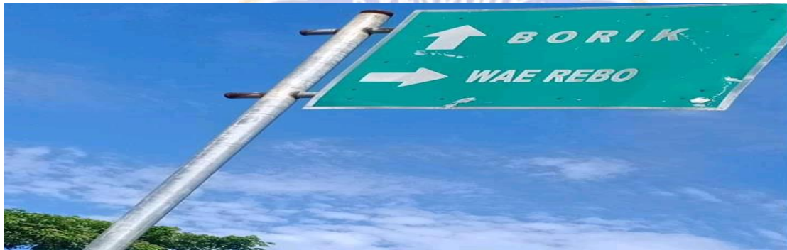
Gambar 02 Plan Petunjuk Kampung Wae Rebo