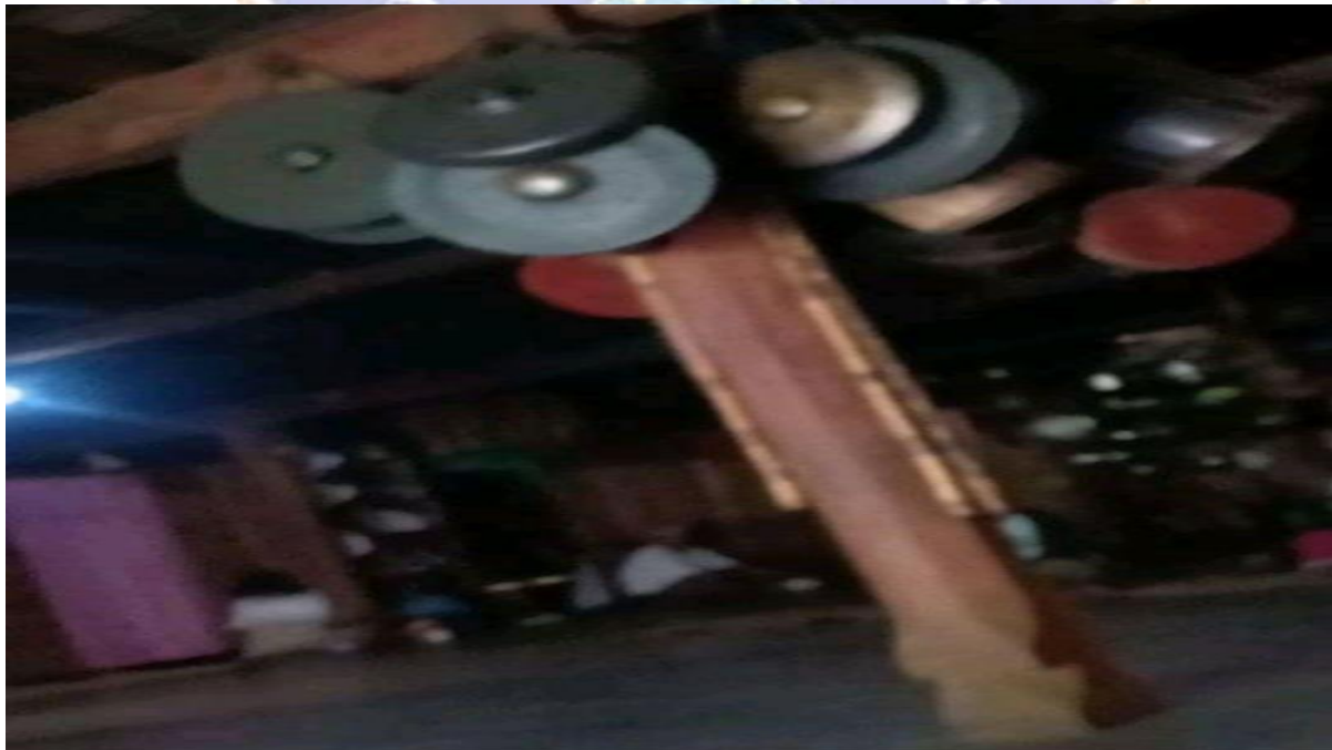
Gambar 08. Perlengkapan adat istadat Manggarai berupa Gong dan Gedang dalam permukiman tradisional (Mbaru Niang Mbaru Gendang).