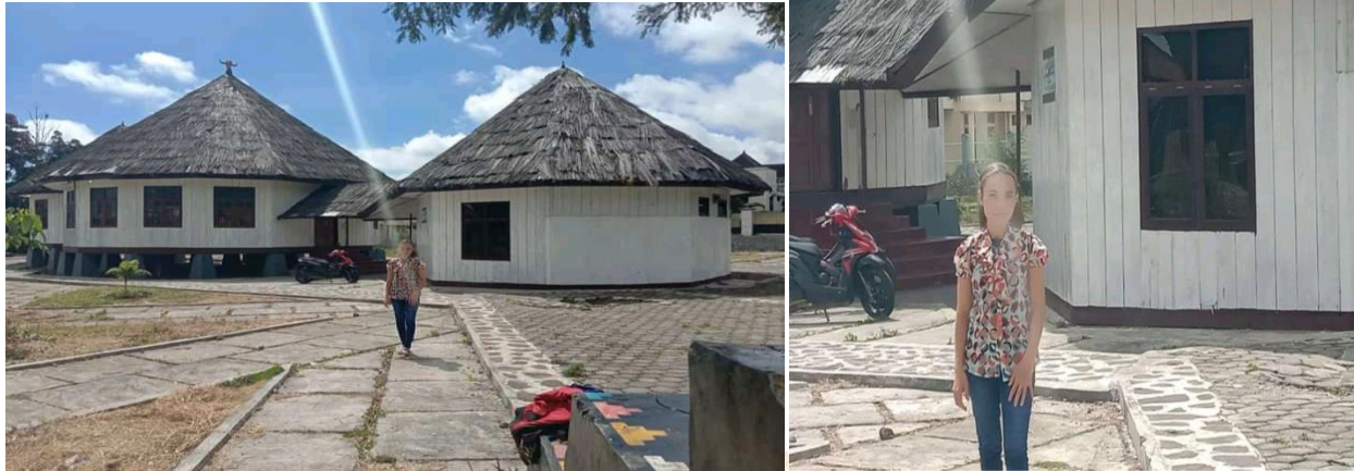
Gambar 01. Mbaru Niang Kabupaten Manggarai di Kota Ruteng (Minta ijin penelitian dan sebelum Ke Mbaru Niang Wae Rebo)