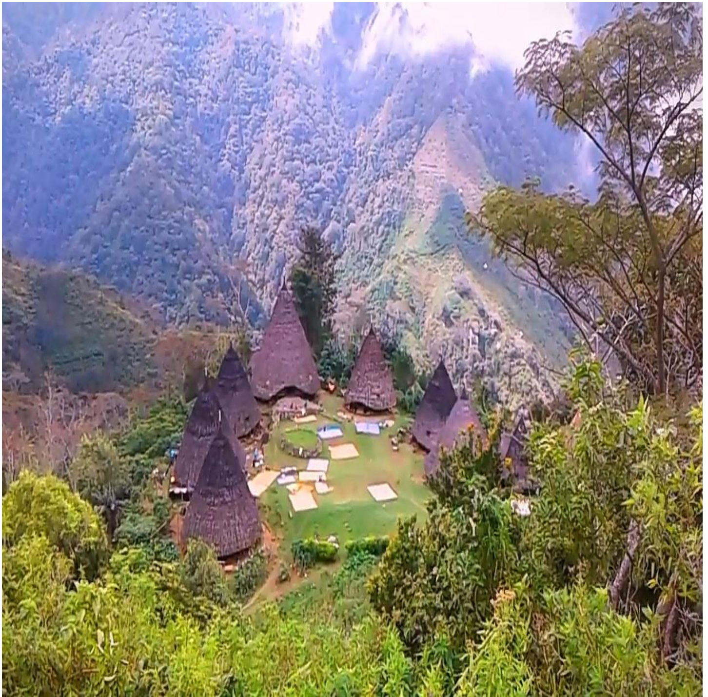
Gambar 11. Pola permukiman tradisional Mengelompok dalam satu Kampung Wae Rebo