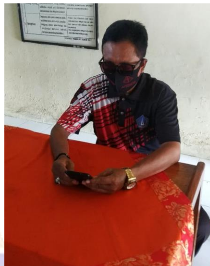
Penyebaran Angket di SD Negeri 32 Pemecutan