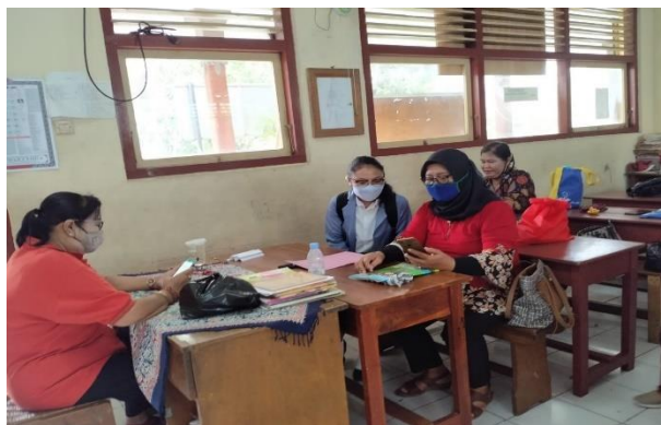
Penyebaran Angket di SD Negeri 15 Pemecutan