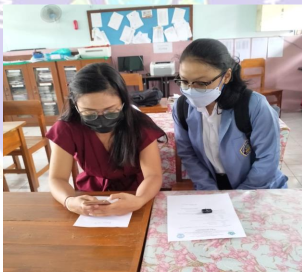
Penyebaran Angket di SD Negeri 27 Pemecutan