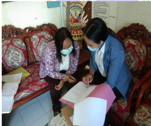
Gambar 03. Uji praktisi I