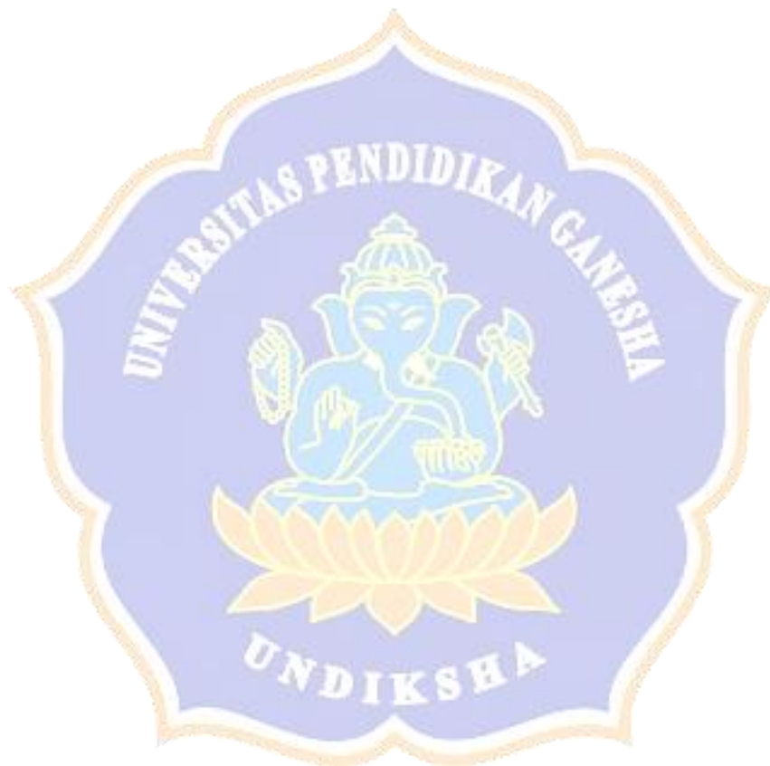
Lampiran 9. Hasil Uji Validasi Instrumen Sikap Spiritual oleh Ahli/Pakar