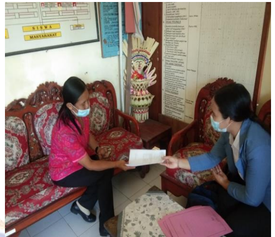
Gambar 02. Permohonan izin observasi di SD N 1 Batungsel