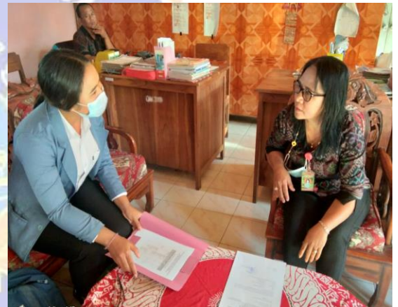
Gambar 04. Permohonan izin uji praktisi di SD N 5 Batungsel