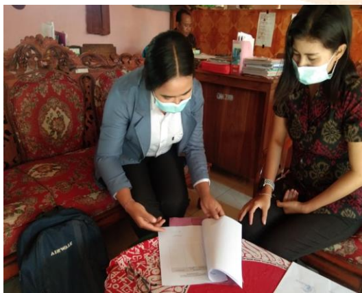
Gambar 05. Uji praktisi II