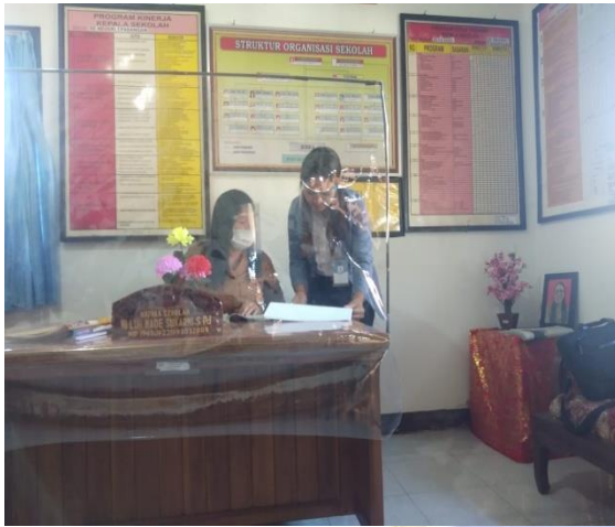
Gambar 01. Permohonan izin observasi di SD N1 Padangan