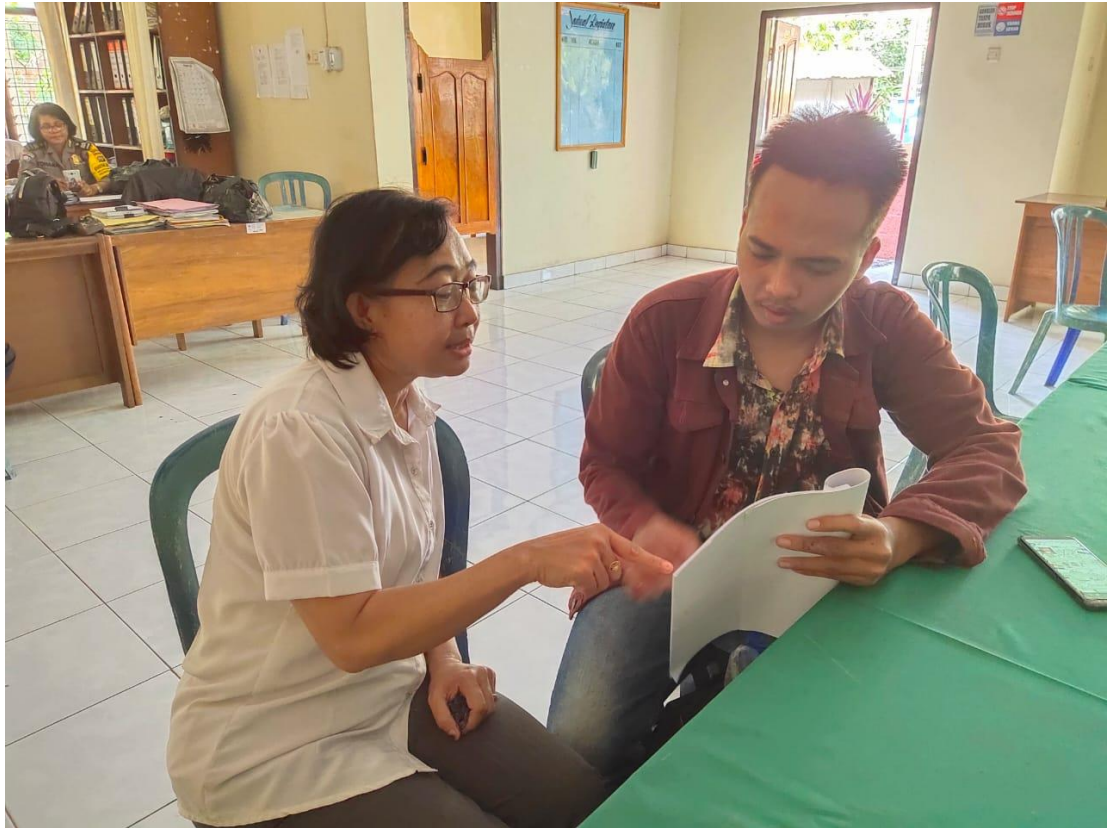
Wawancara dengan Sekretaris Dinas Perindustrian dan Perdagangan